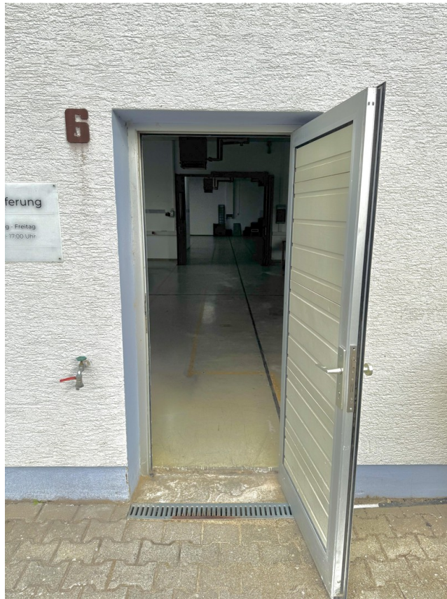
Blick von der Hallentür aus