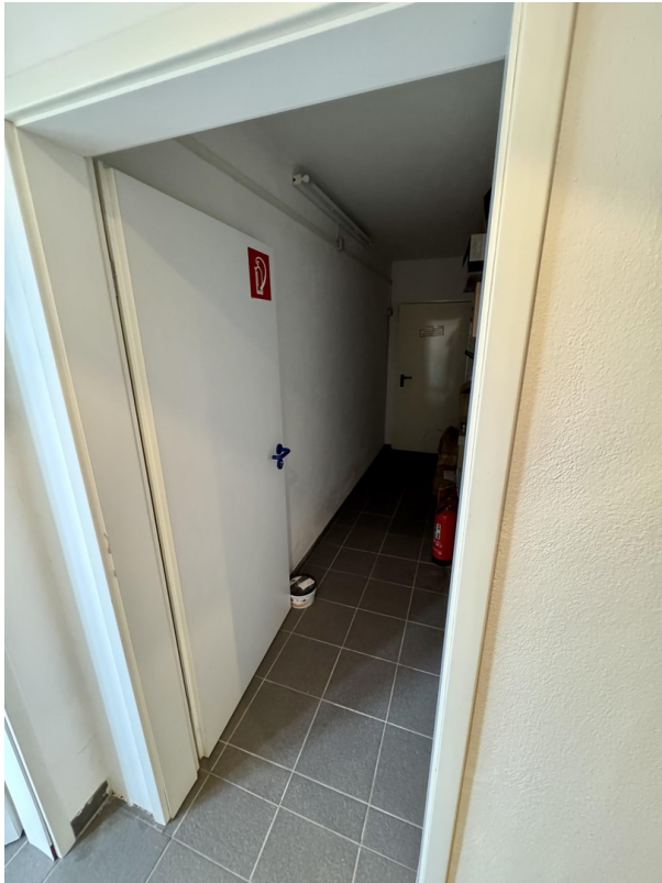
Lagerraum Heizung Öltank