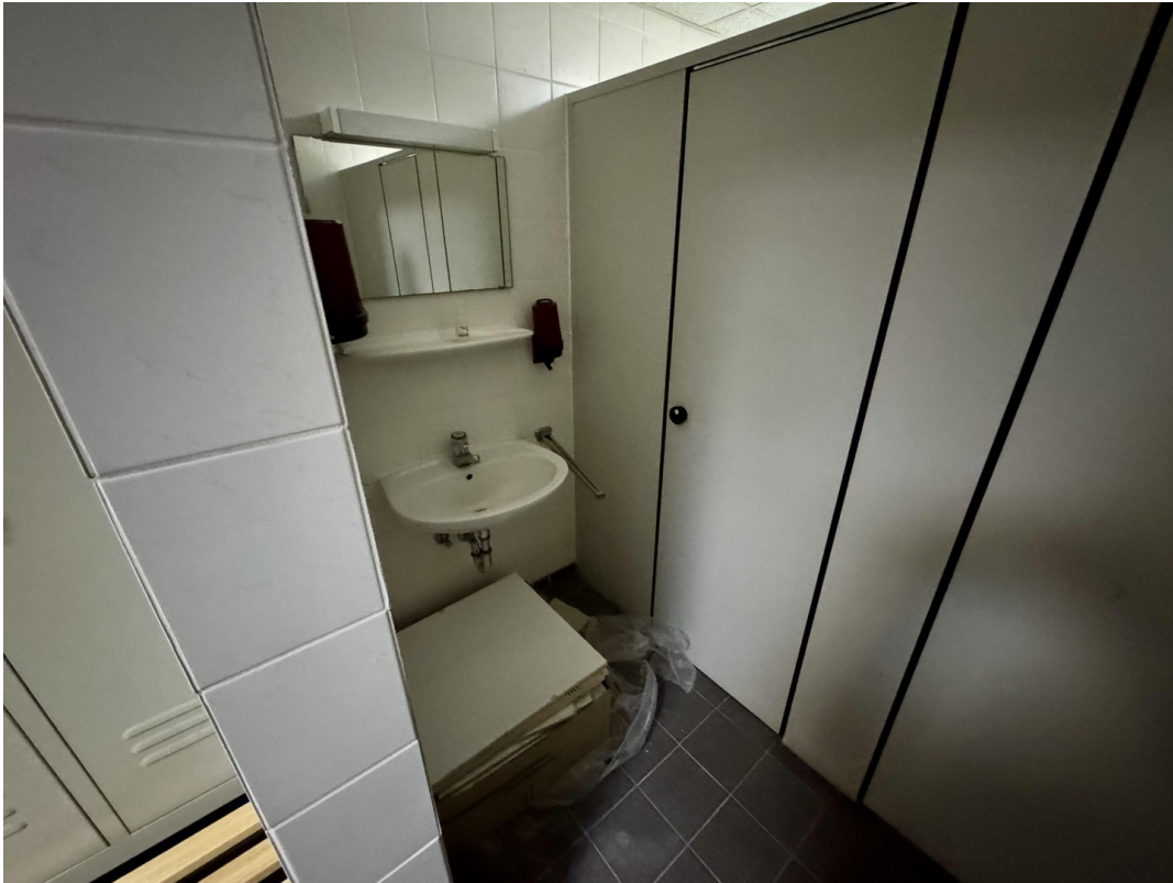
Umkleide + Duschen Herren