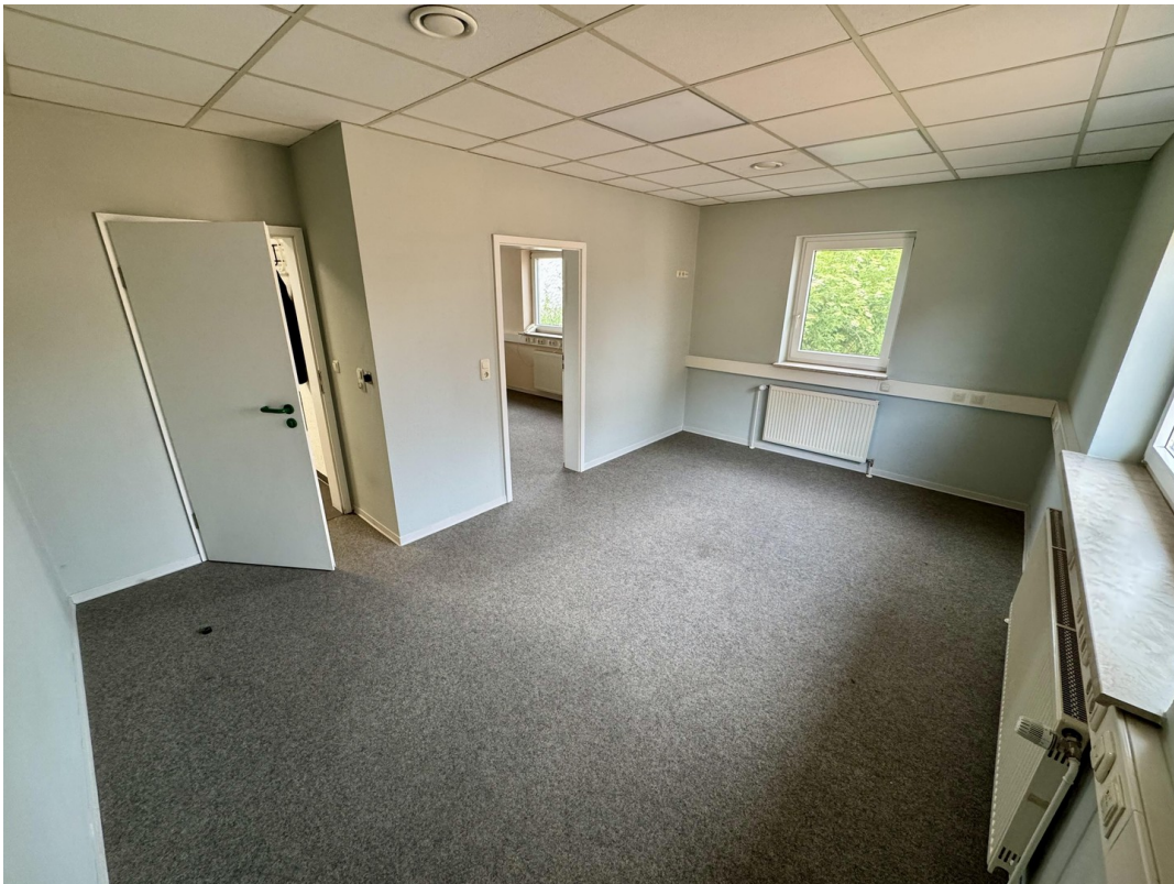
Büro 2 (Verbindung zu Büro 1)