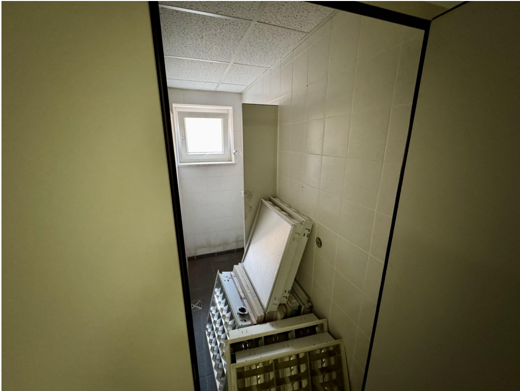
Umkleide + Duschen Damen