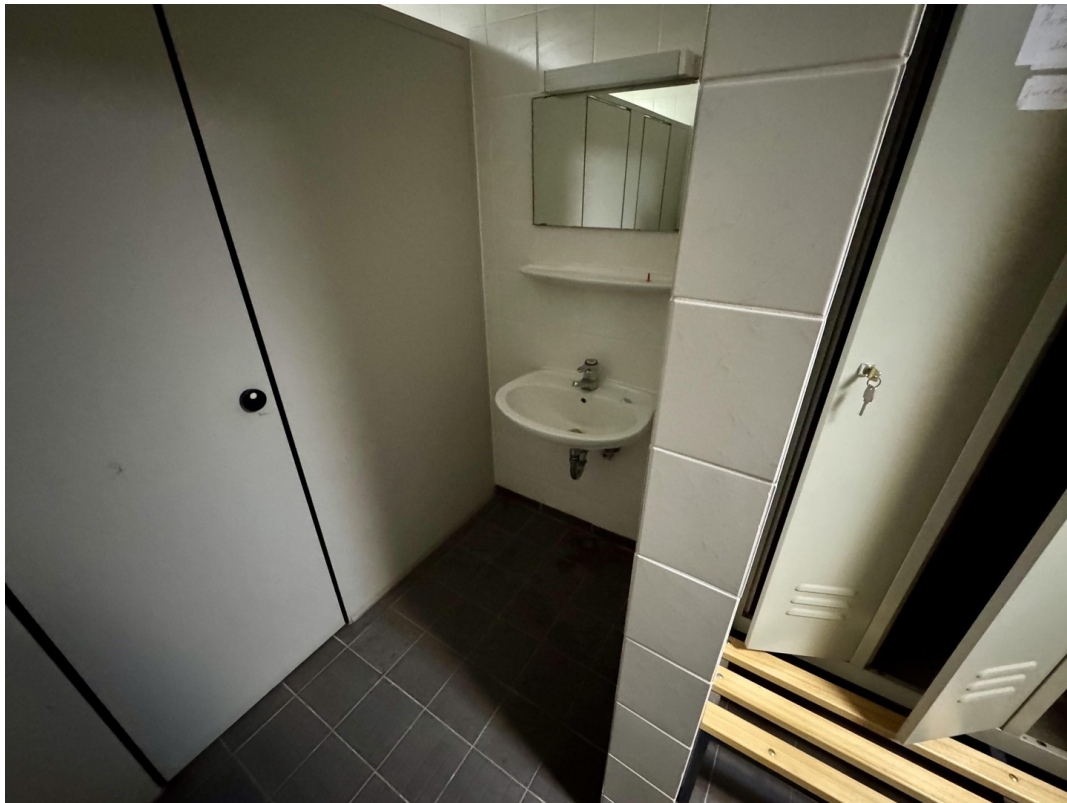
Umkleide + Duschen Herren