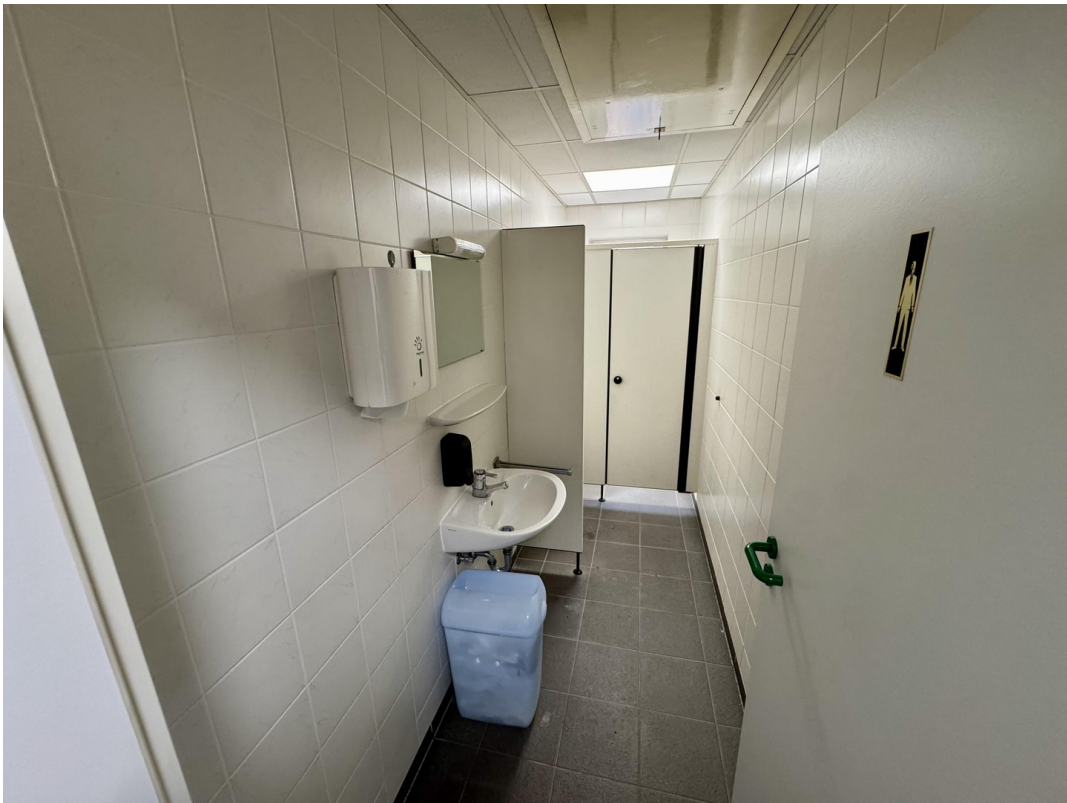
Toilette Herren Büro