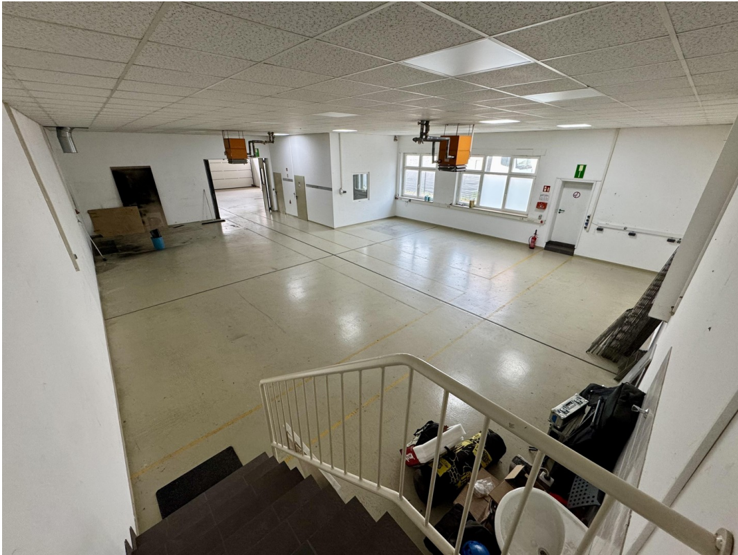
Hintere Halle (Büroausgang)