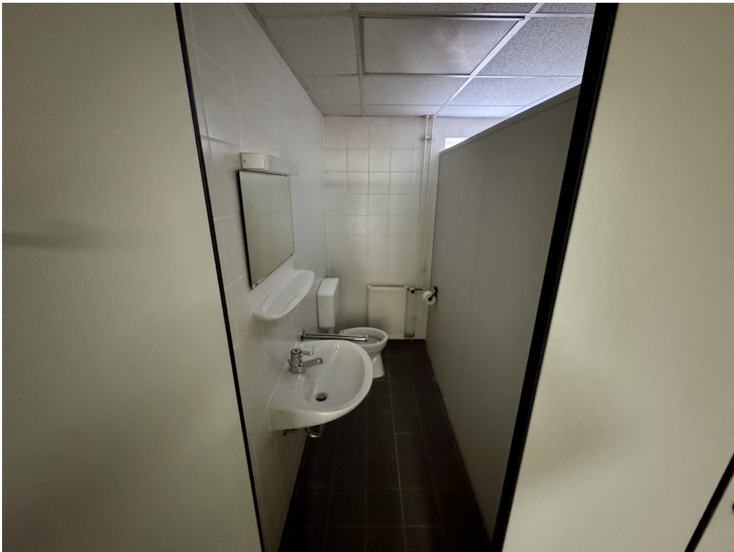
Umkleide + Duschen Damen