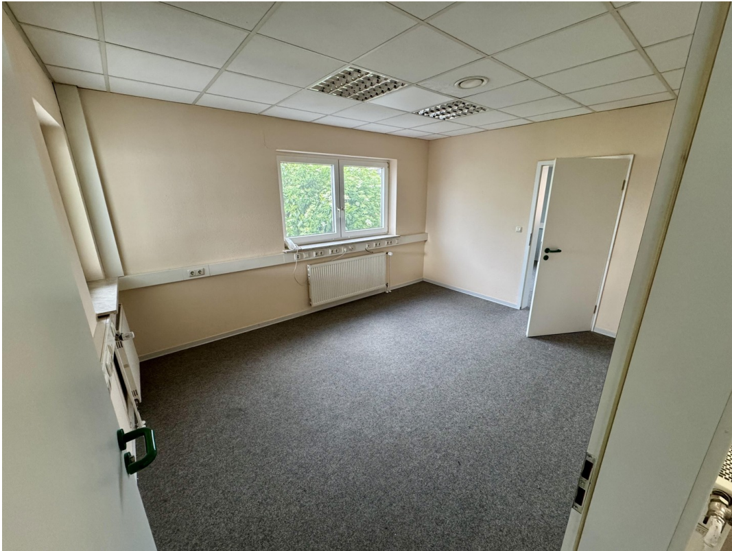
Büro 1 (Verbindung zu Büro 2)