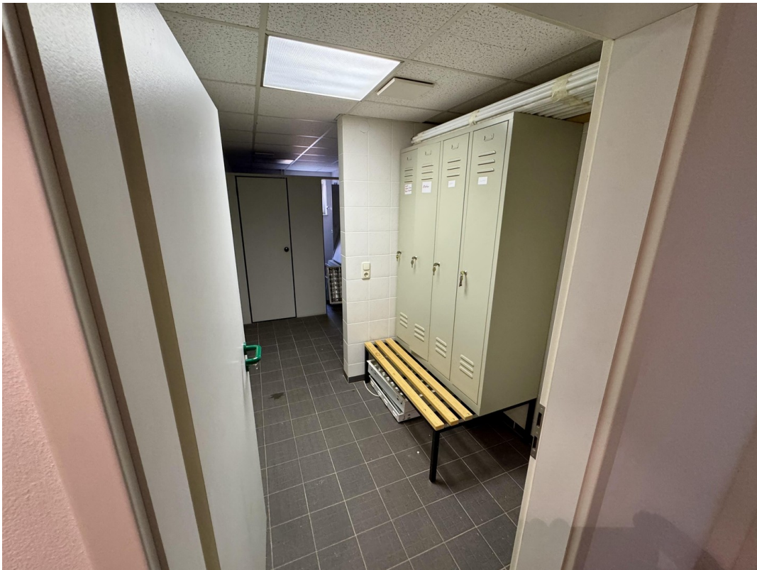
Umkleide + Duschen Damen