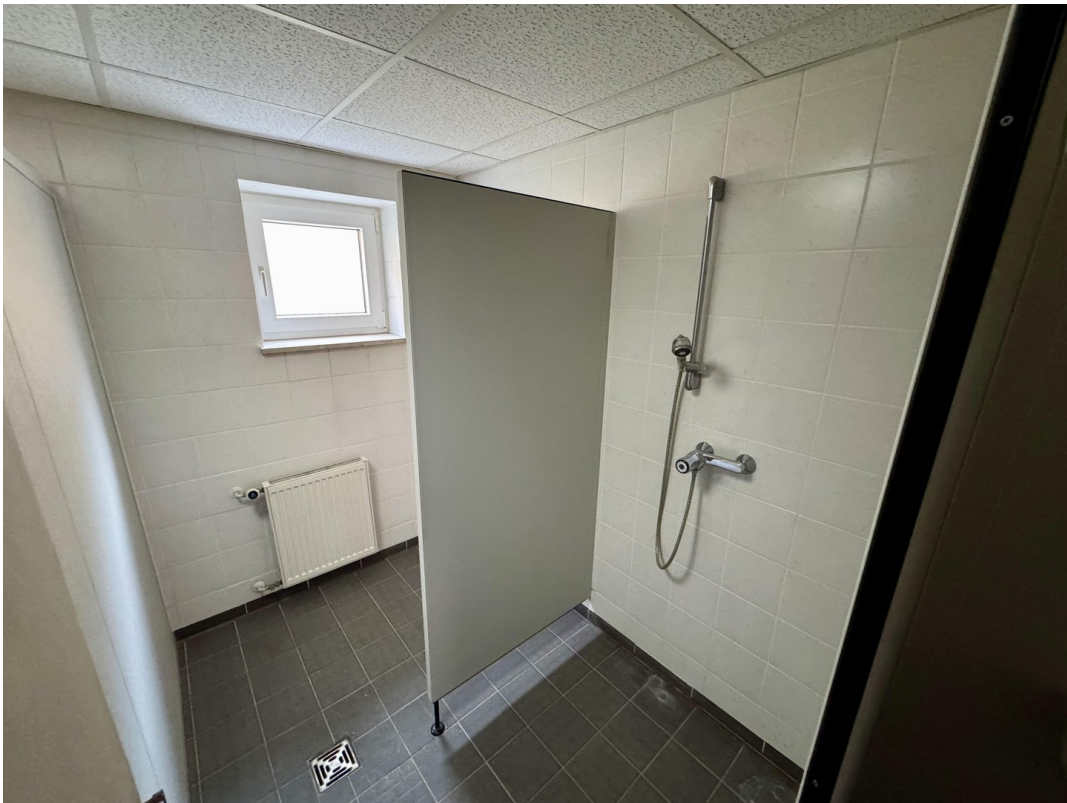
Umkleide + Duschen Herren