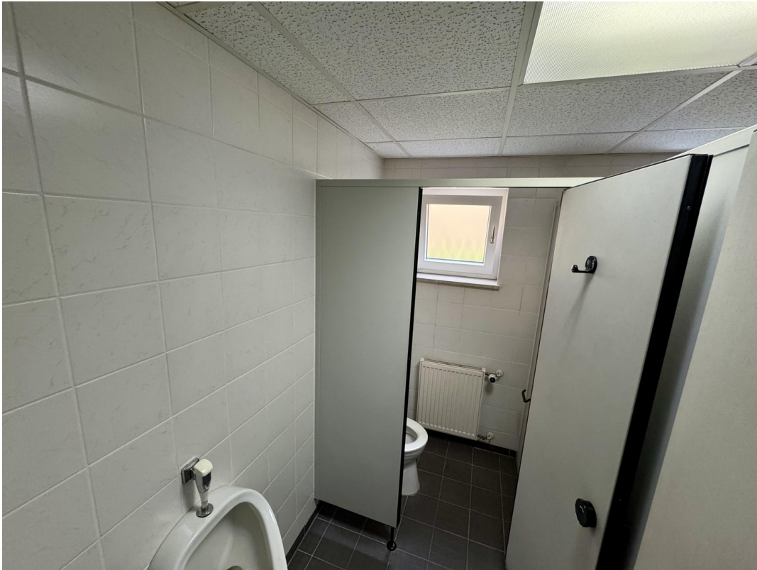
Umkleide + Duschen Herren