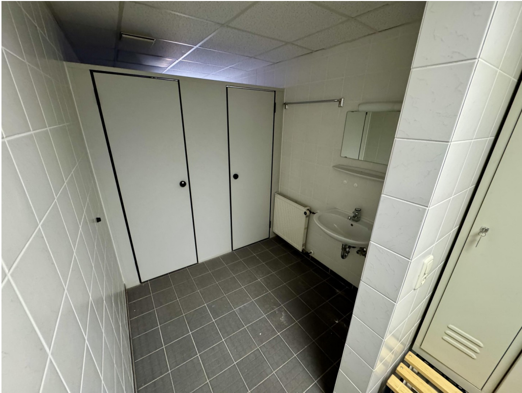
Umkleide + Duschen Damen