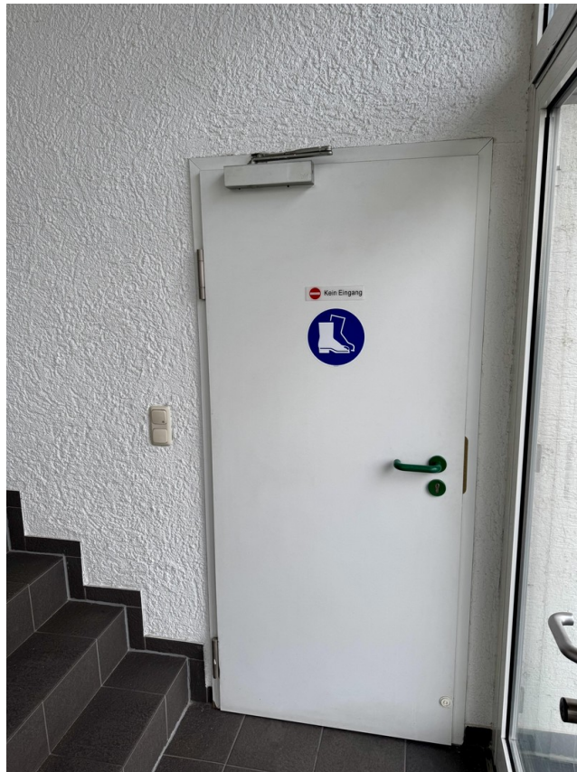
Eingang Halle von Büroeingang