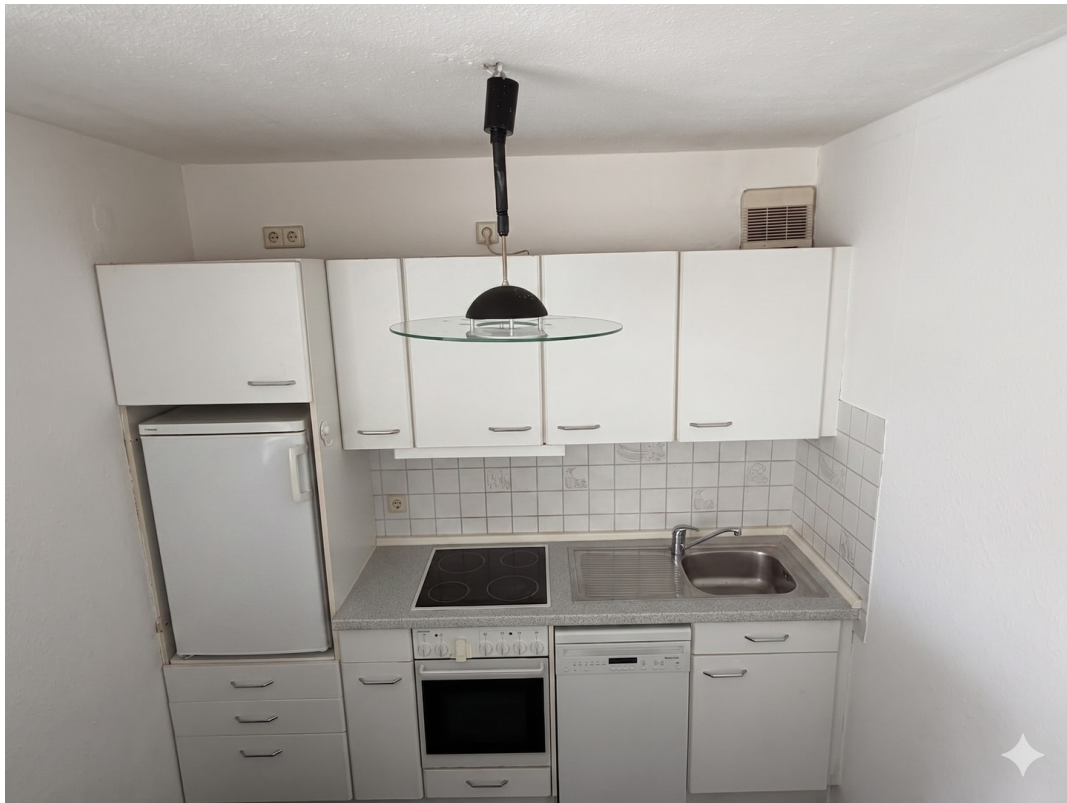
Küche mit Kühlschrank