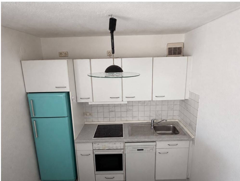
Küche mit Kühlschrank