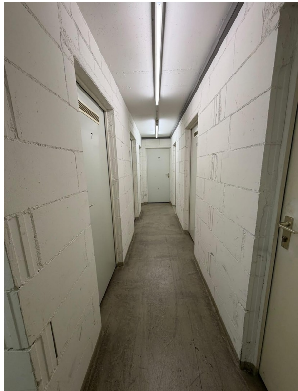
Eingang zum Keller