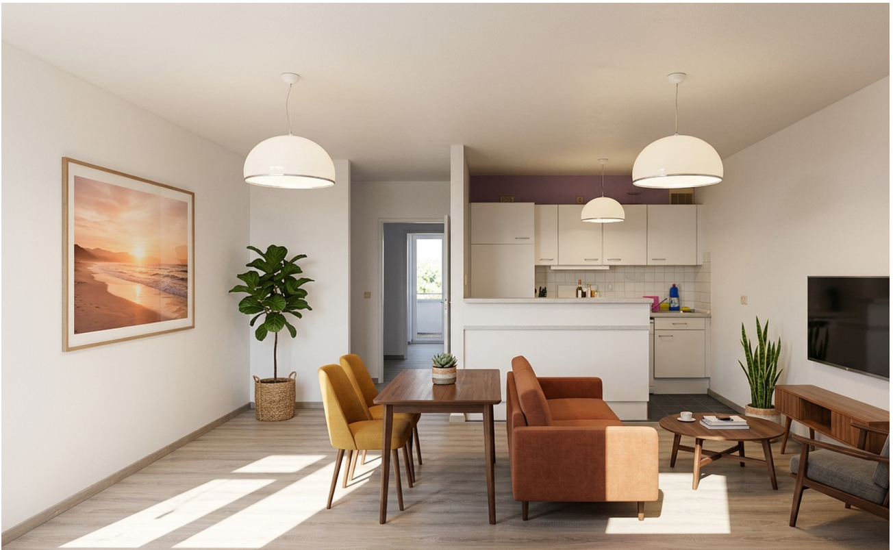
Wohn und Esszimmer, Beispiel