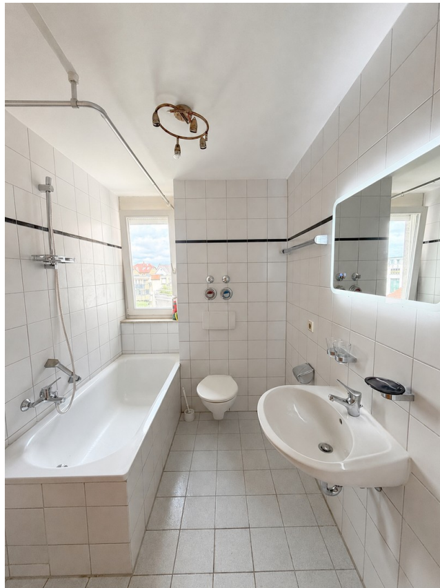
Badezimmer mit Fenster