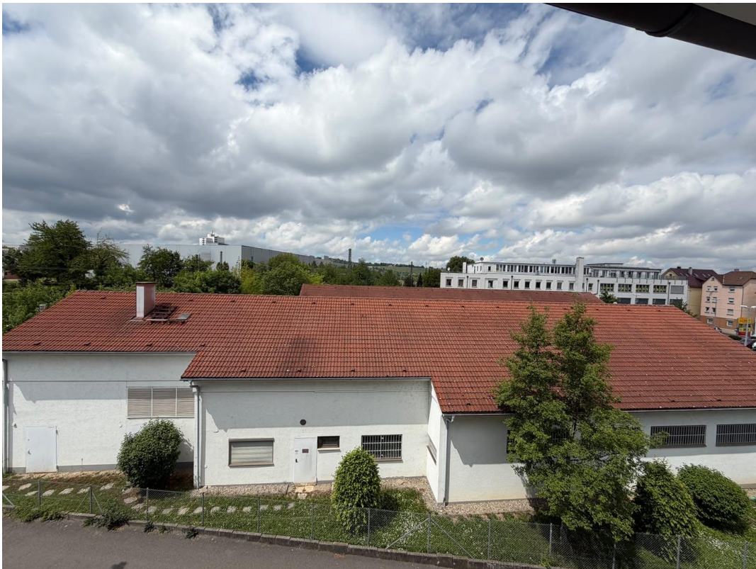
Blick Vom Schlafzimmer