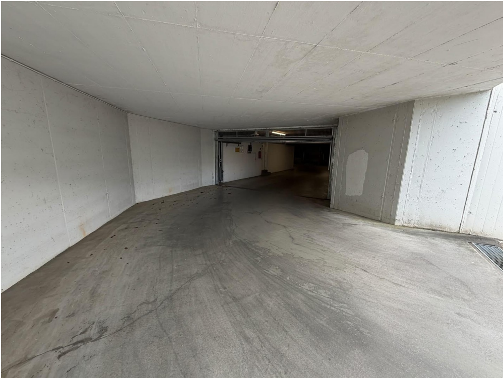
Einfahrt in die Tiefgarage