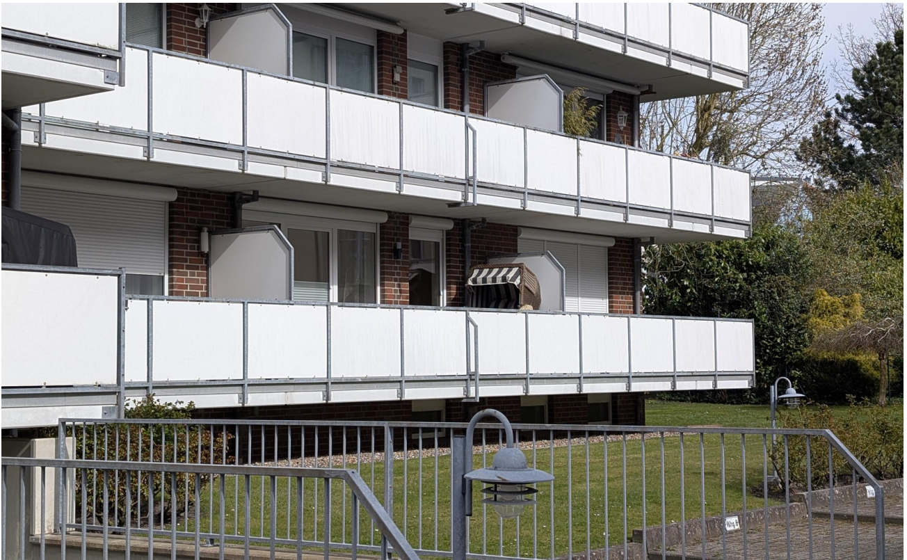
Haus - Frontansicht