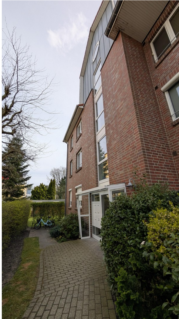
Haus - Rückseite/Eingang