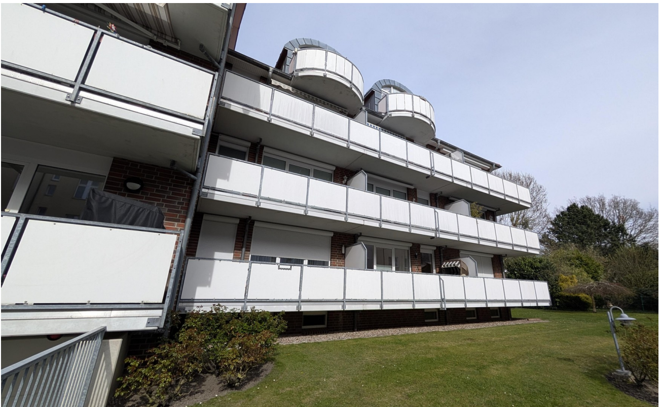
Haus - Frontansicht