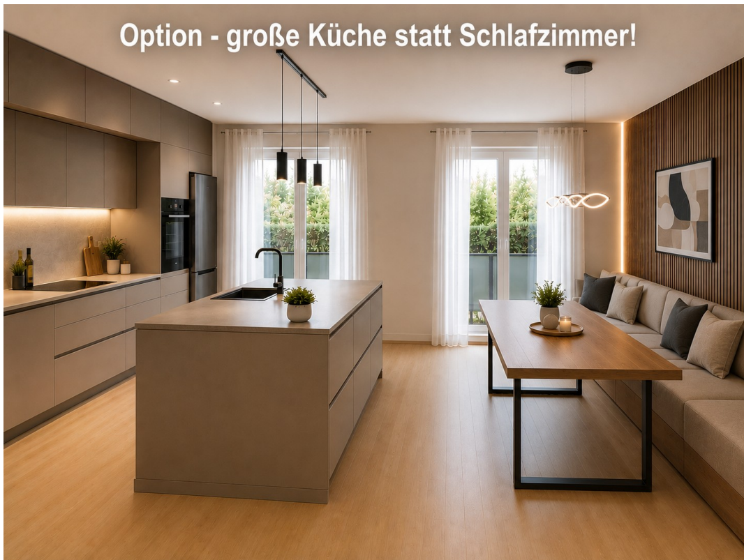
Option KI große Küche EG