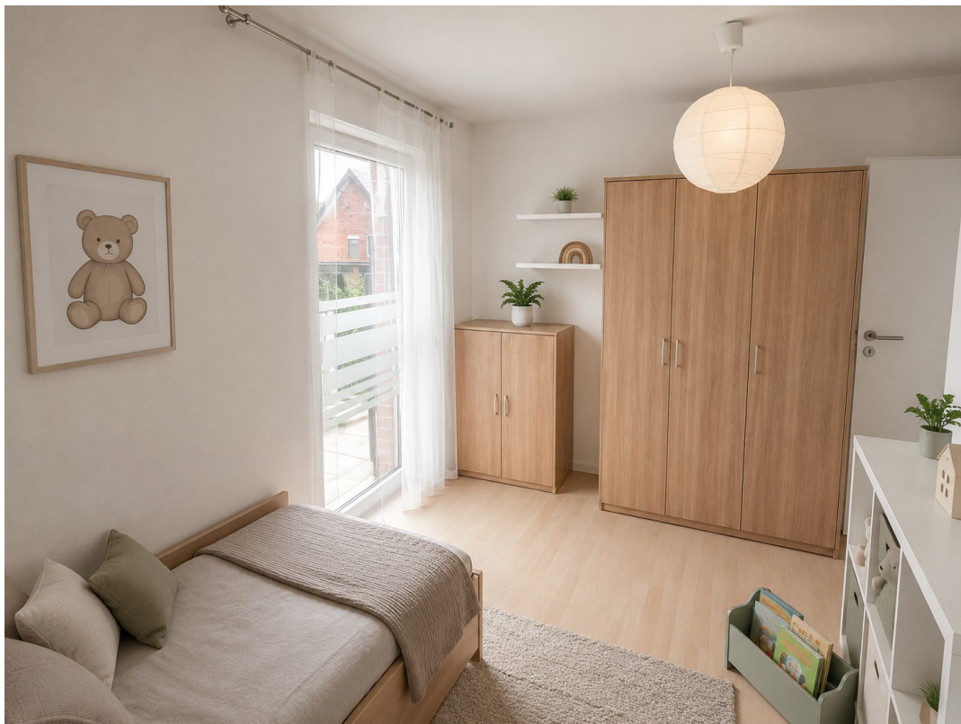
Kinder- / Gästezimmer OG