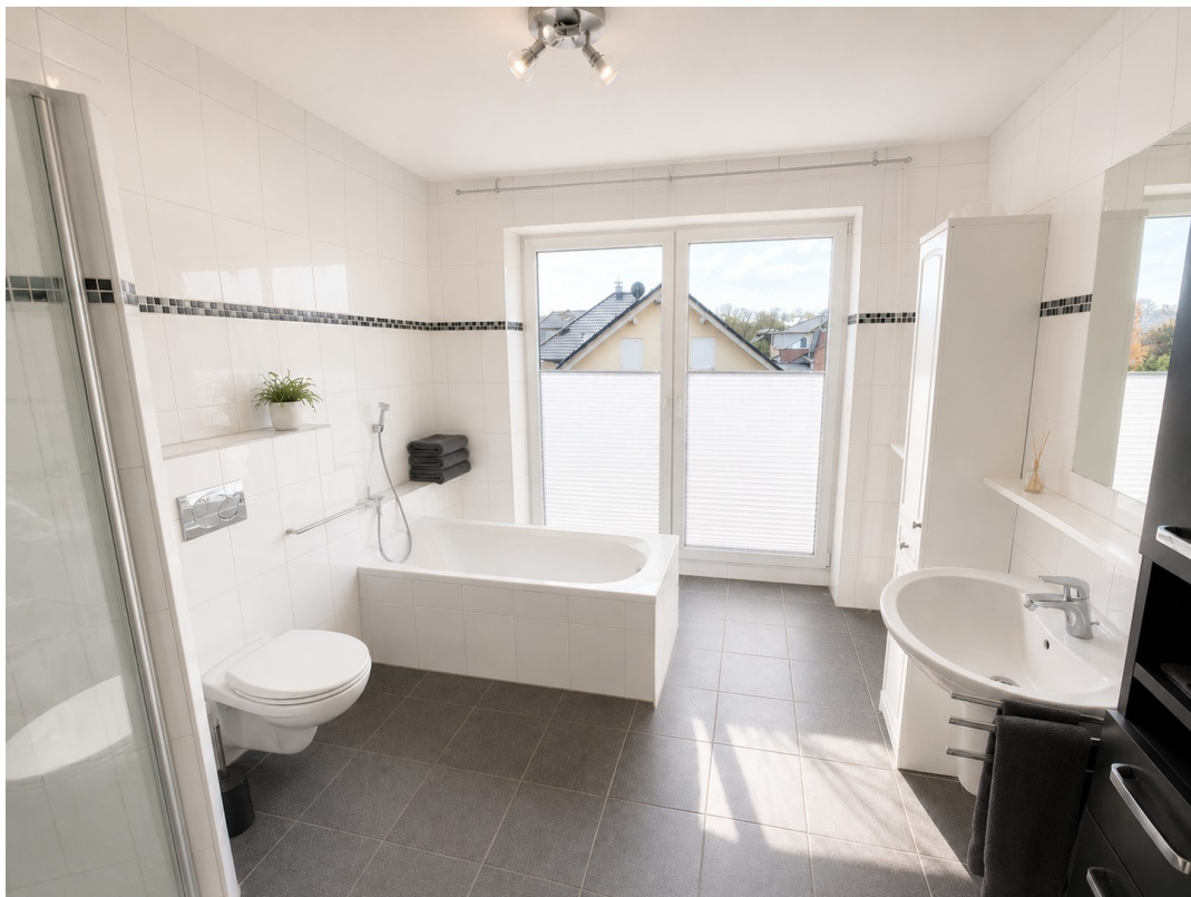
Bad OG II