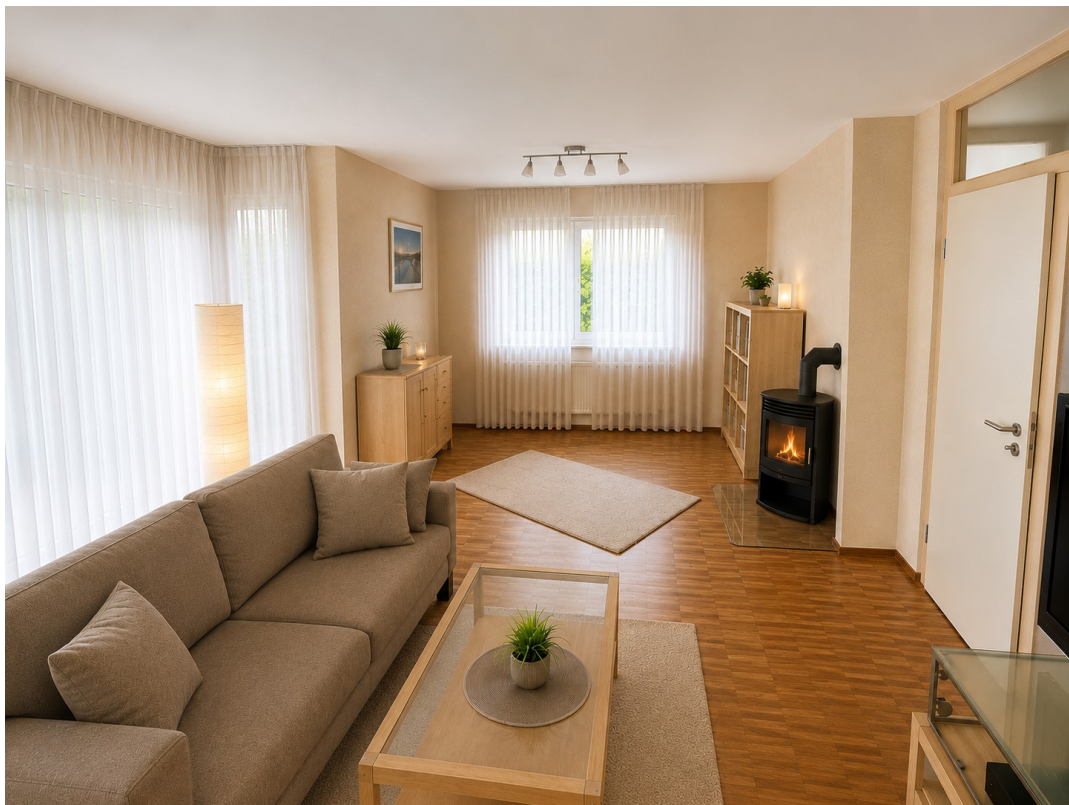
WohnzimmerEG KI mit Ofen