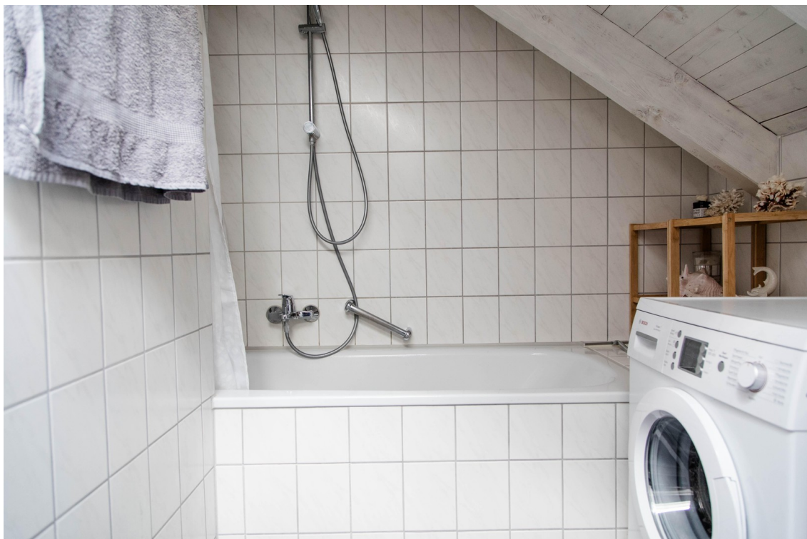
Badezimmer mit Wanne