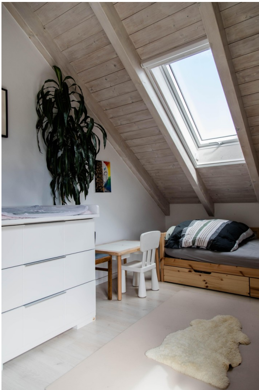
Kinderzimmer mit Dachfenster