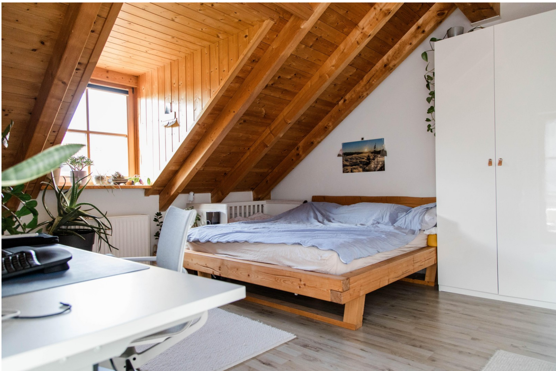
Schlafzimmer mit Holzdecke