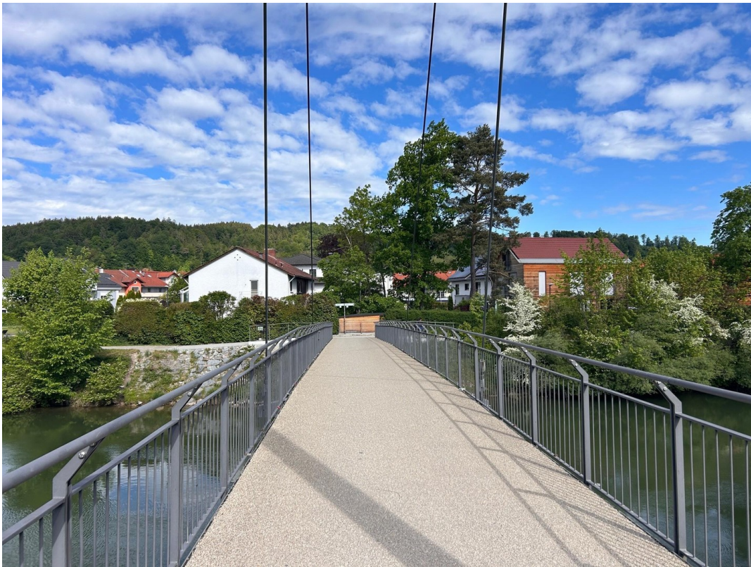
Fahrradbrücke ums Eck