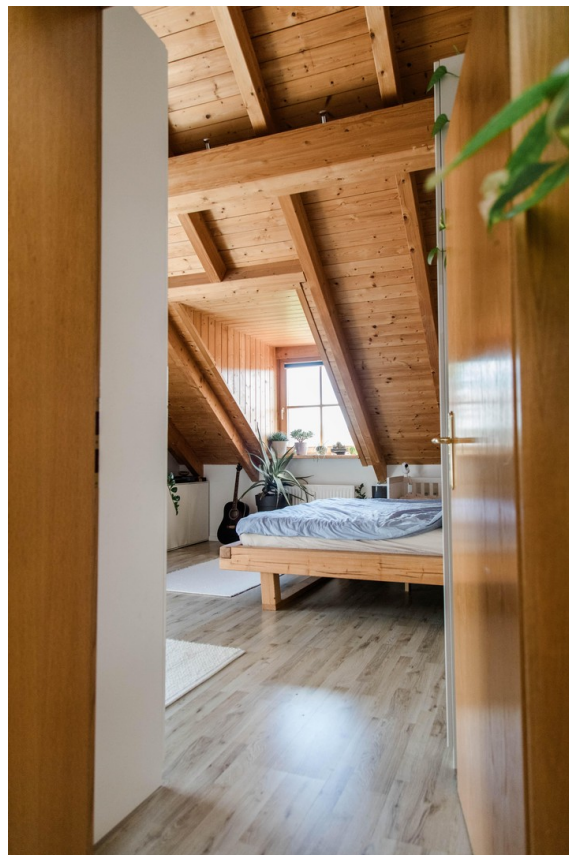
Schlafzimmer mit Gaube