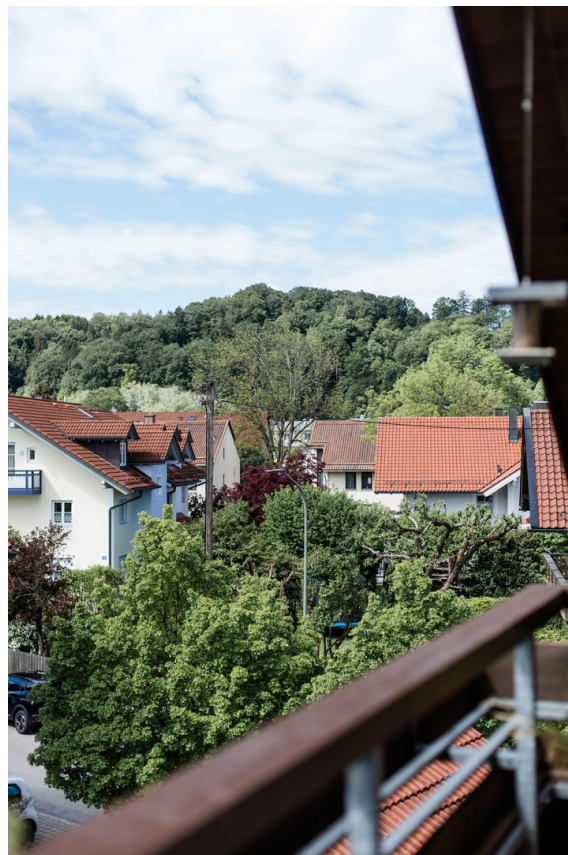
Aussicht auf den Bergwald