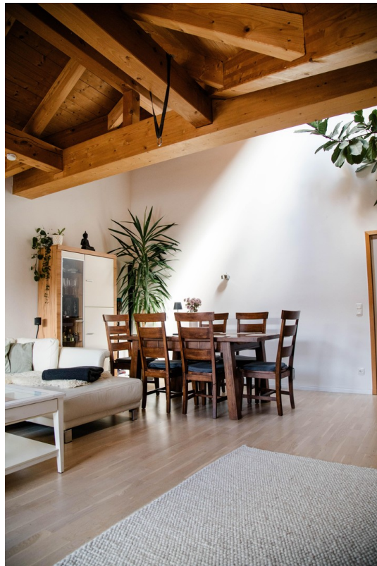
Essbereich im Wohnzimmer