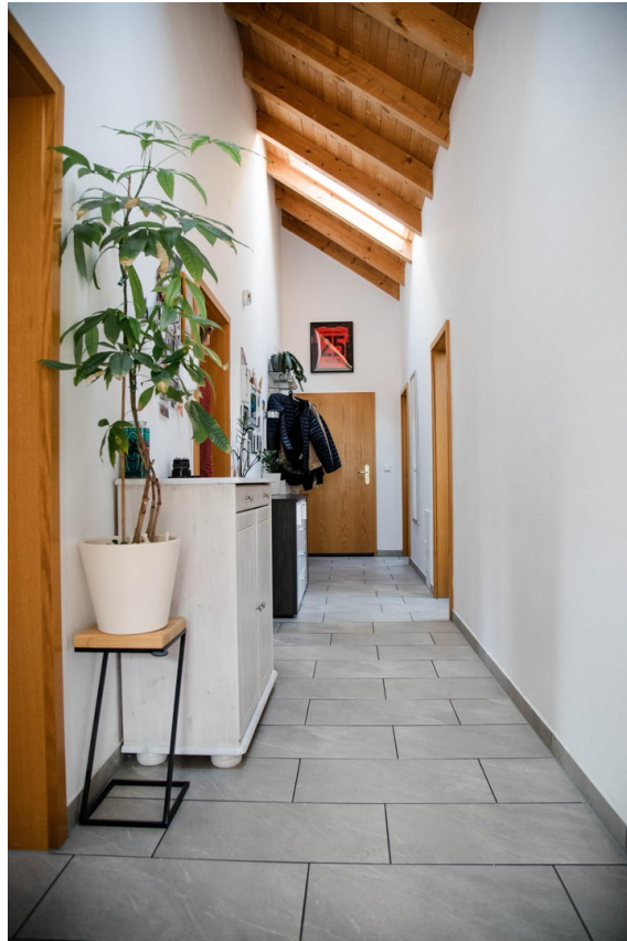
großer heller Flur