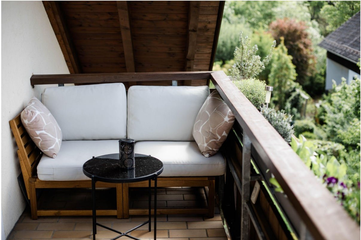
Südbalkon andere Seite