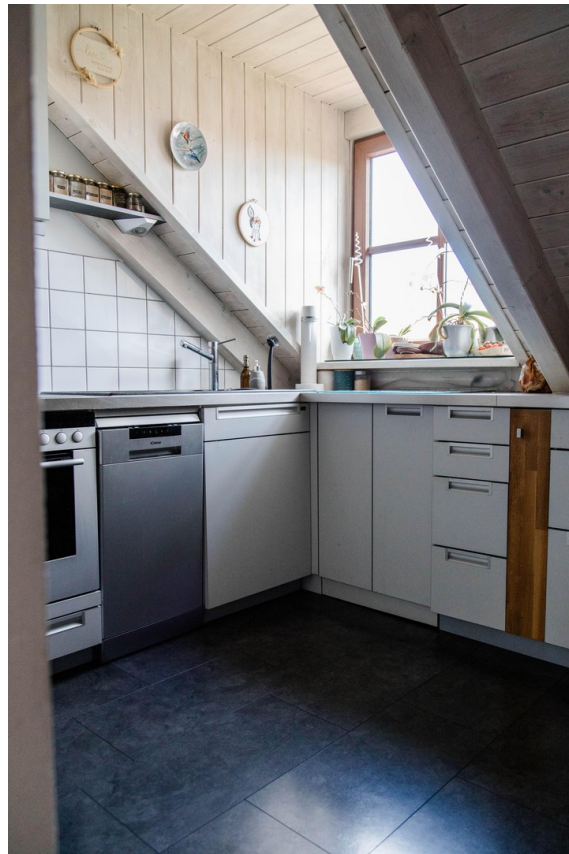
Küche mit Gaube