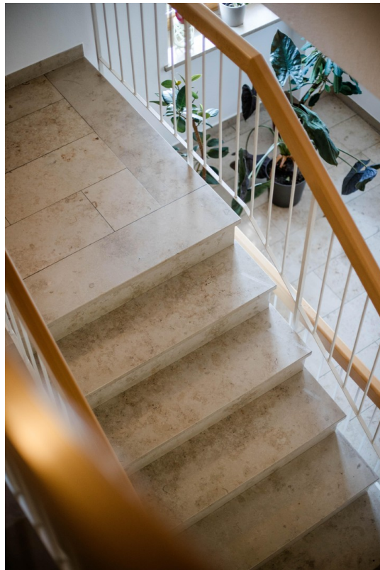
Treppenhaus aus Marmor