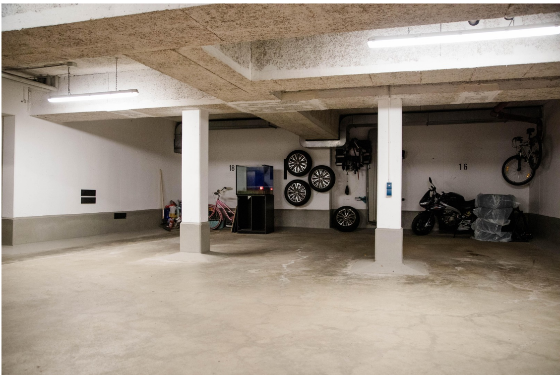
großer Stellplatz Tiefgarage