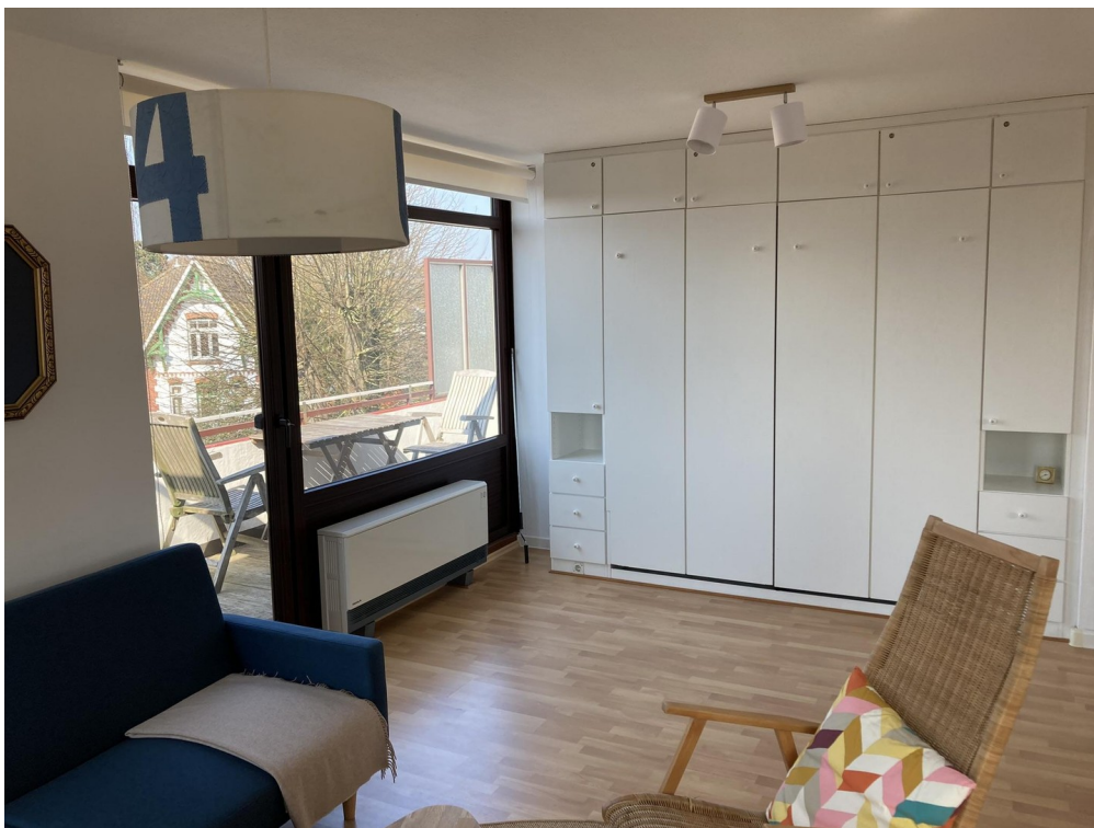
Schrankbett zum Ausklappen