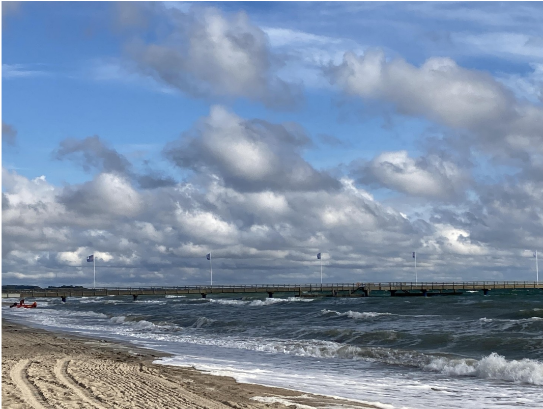
Dahmer Strand im Herbst