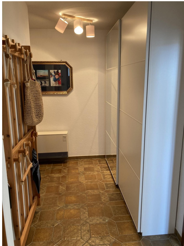
Flur mit großem Schrank