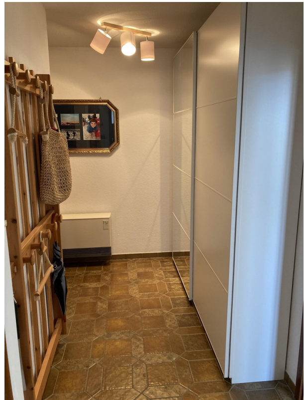
Flur mit großem Schrank