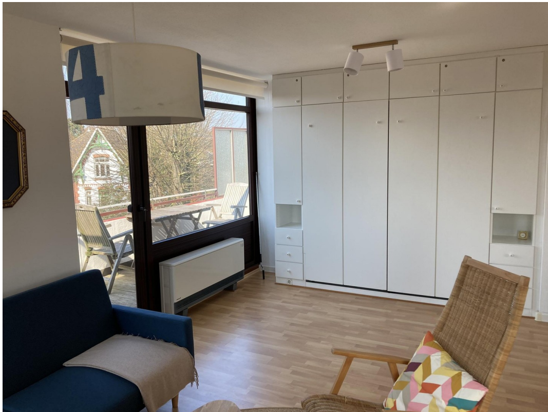
Schrankbett zum Ausklappen