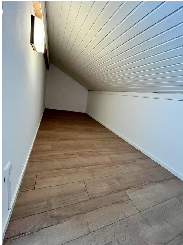
Abseite / Dachkammer