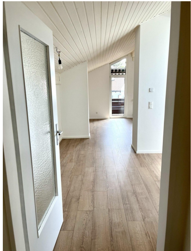
Eingang / Flur