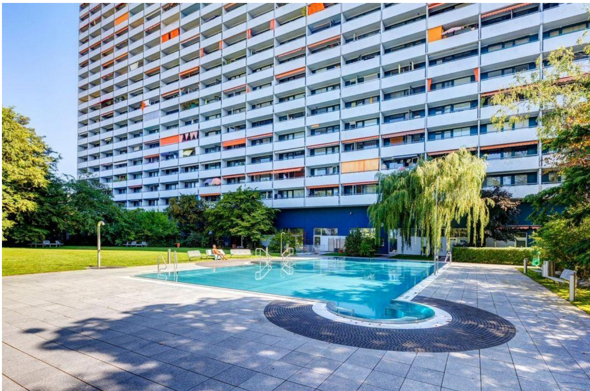
Pool / Garten