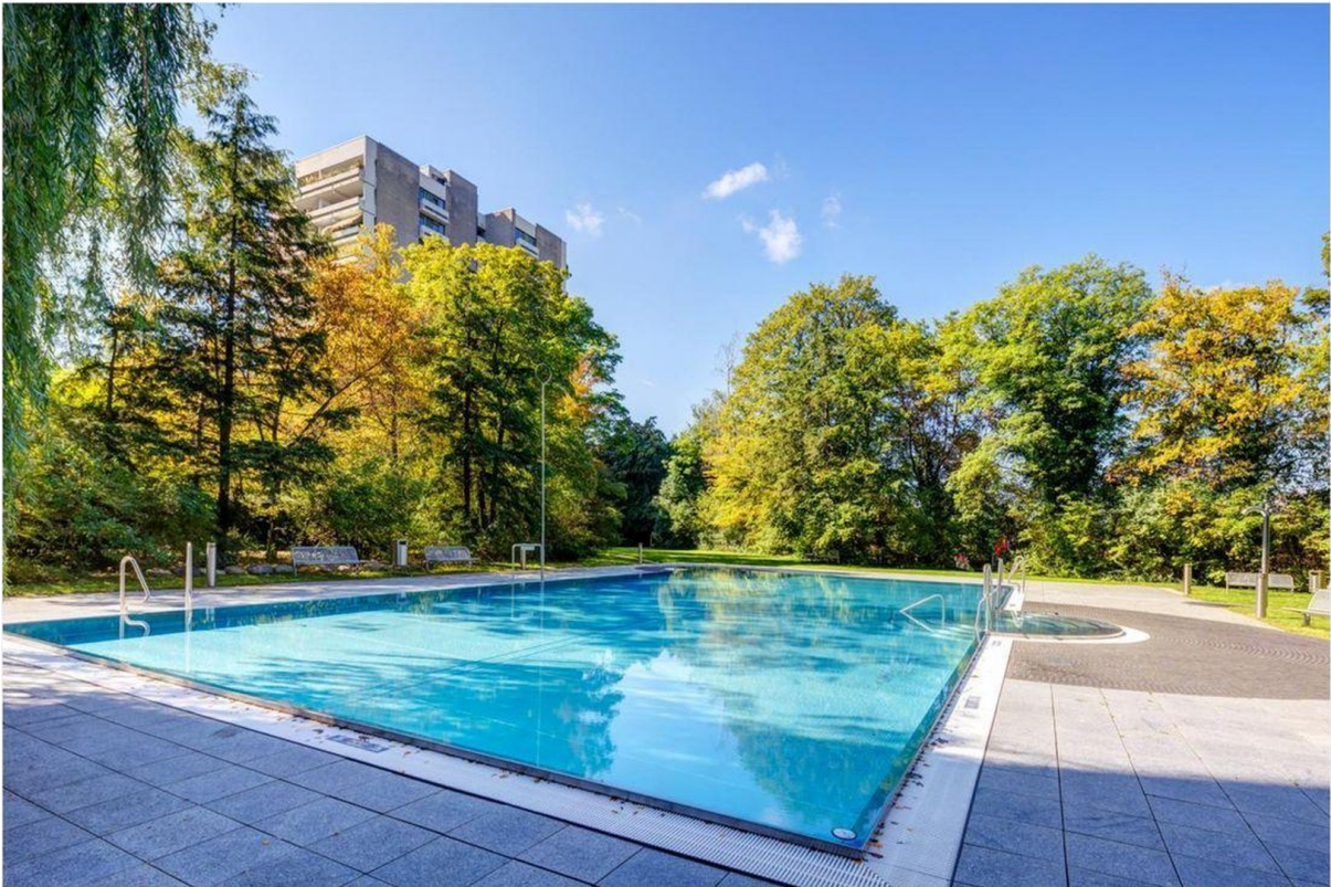
Pool / Garten