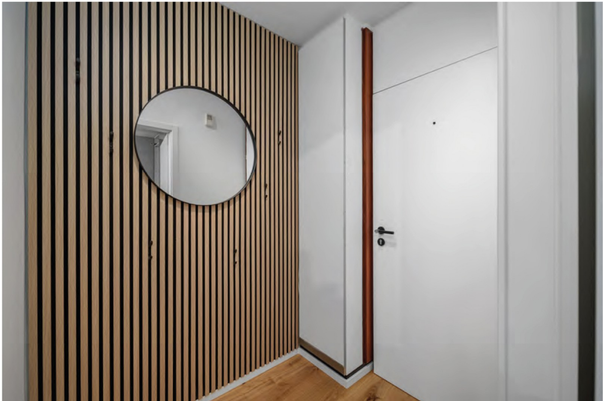
Flur / Eingangsbereich