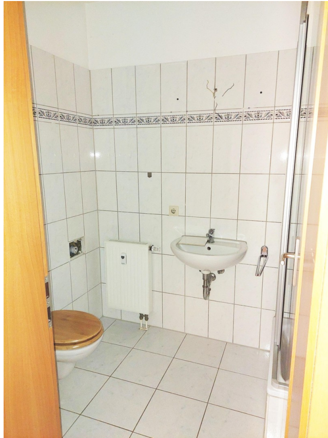
WC / Dusche