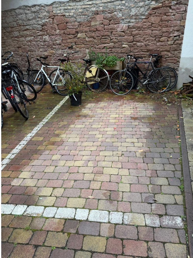
Stellplatz im Innenhof