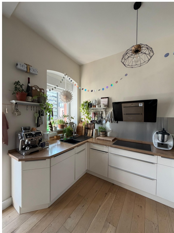
Küche mit Fenster