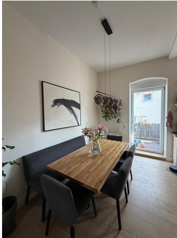
Ausgang zum Balkon