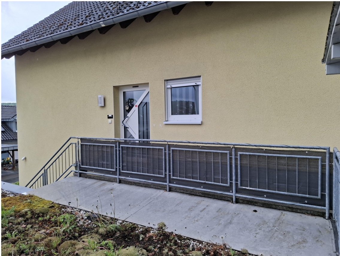
Haus Ansicht von vorne