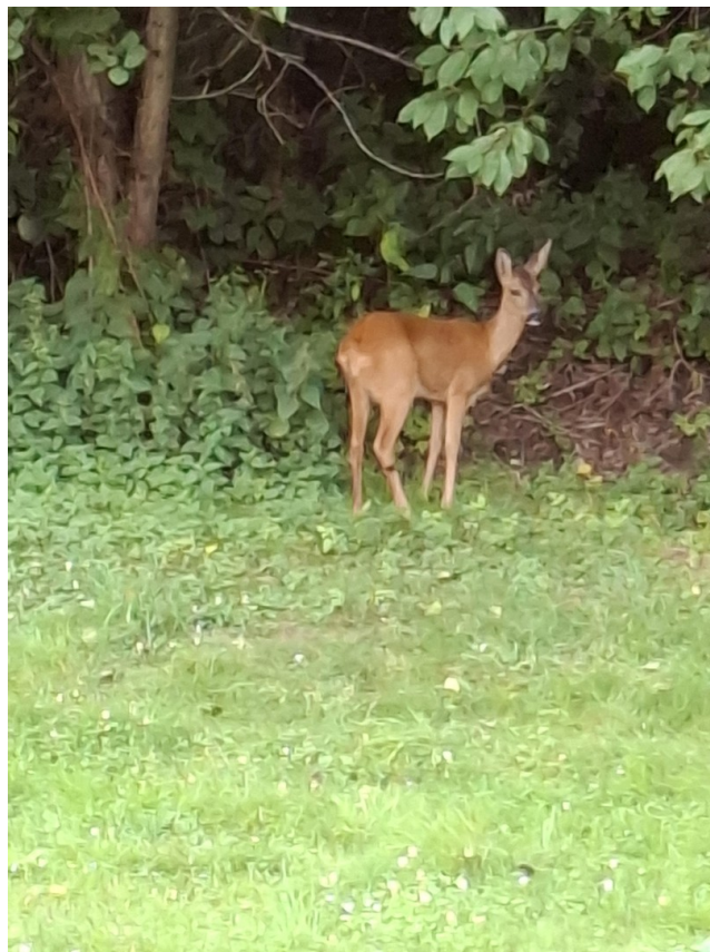
Der fremde Gast:.)