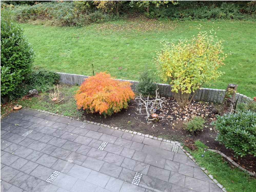
Garten im Herbst