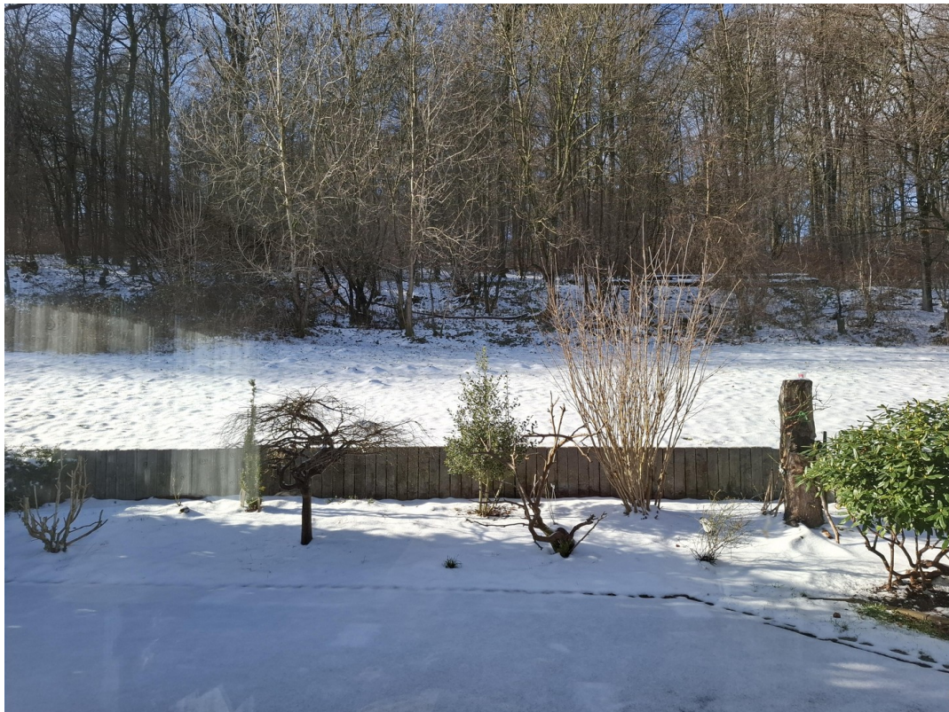
Garten im Winter