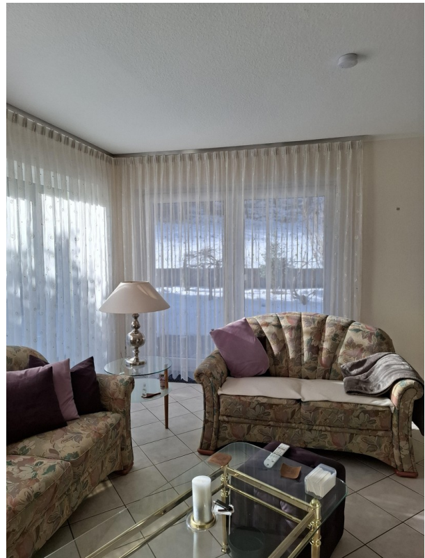
Wohnzimmer Aussicht zum Garten