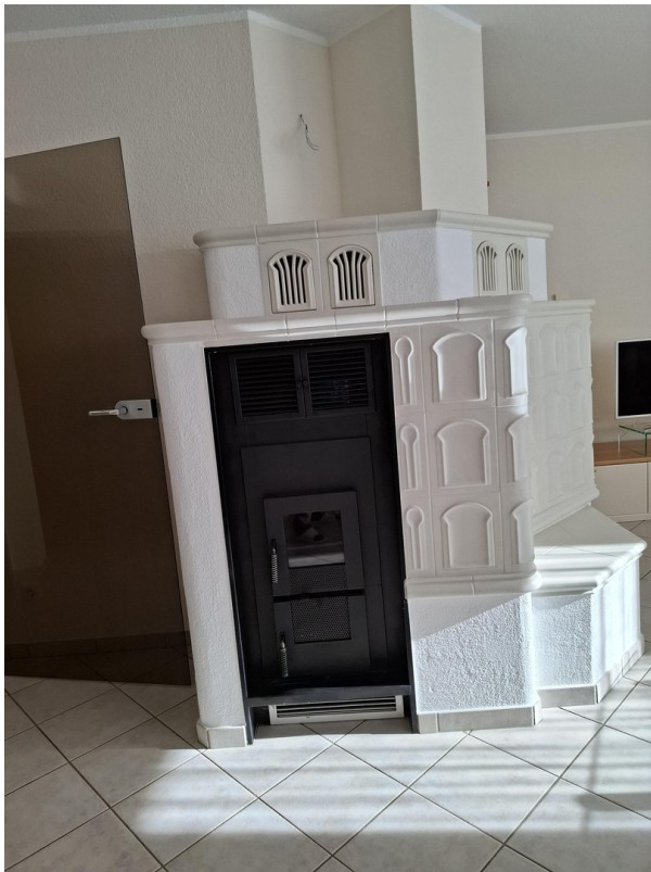
Kamin im Wohnzimmer