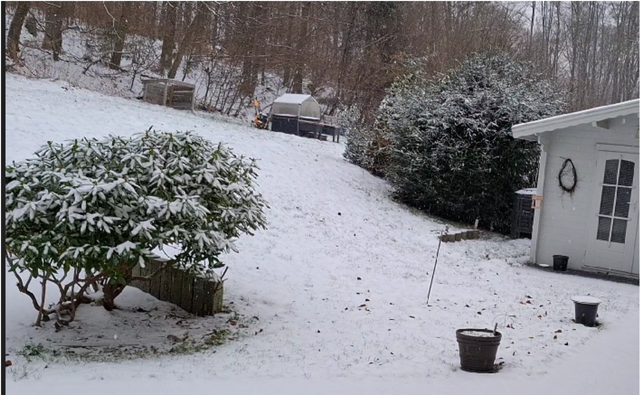
Garten im Winter u. Gartenhaus