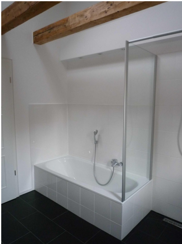
OG - Bad mit Dusche und Wanne