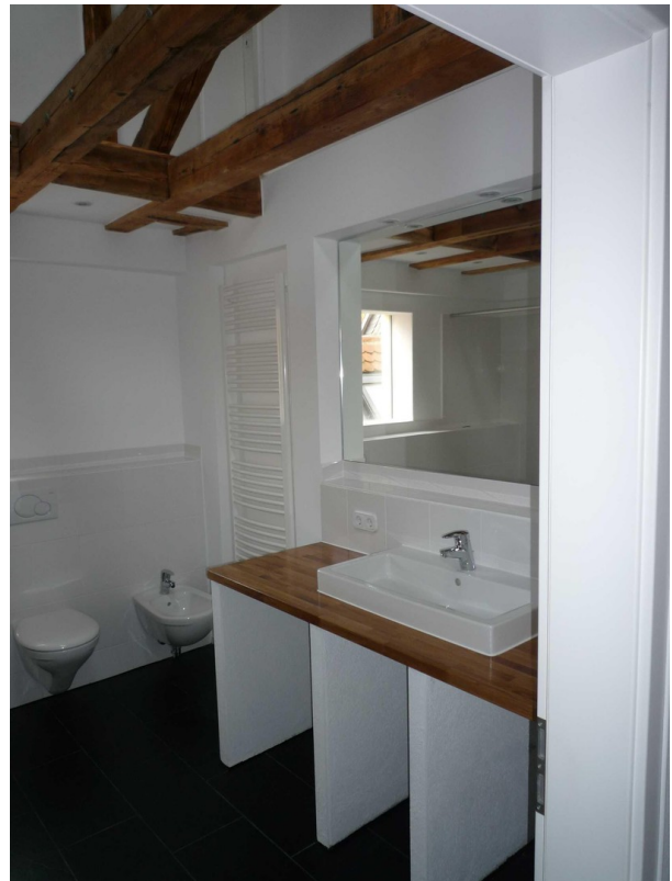
OG - Bad