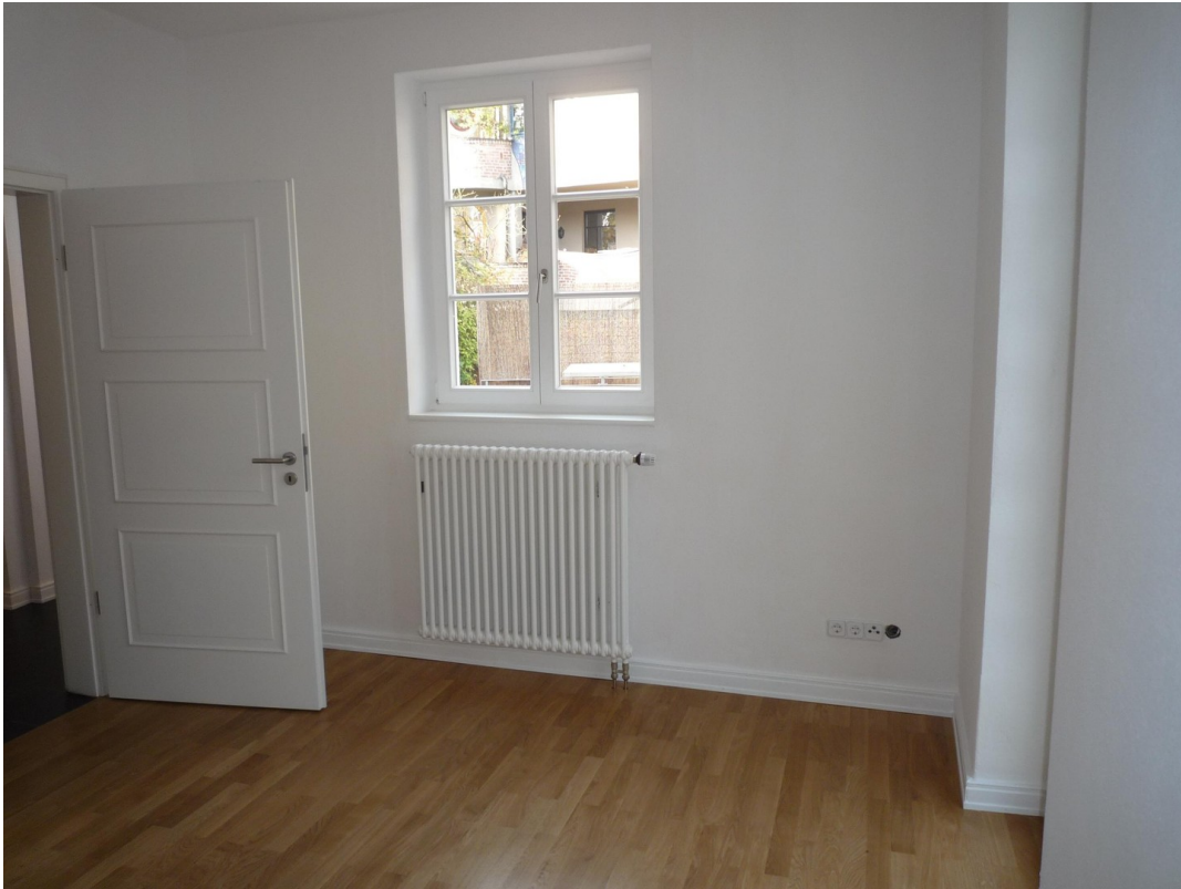
EG - Arbeitszimmer