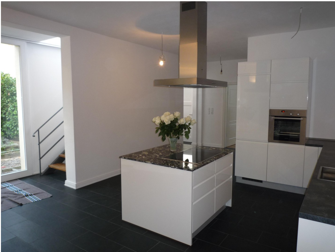
EG - Küche