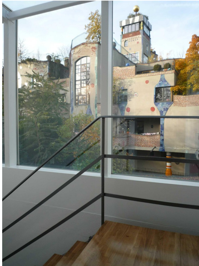
OG - Blick auf Hundertwasserha