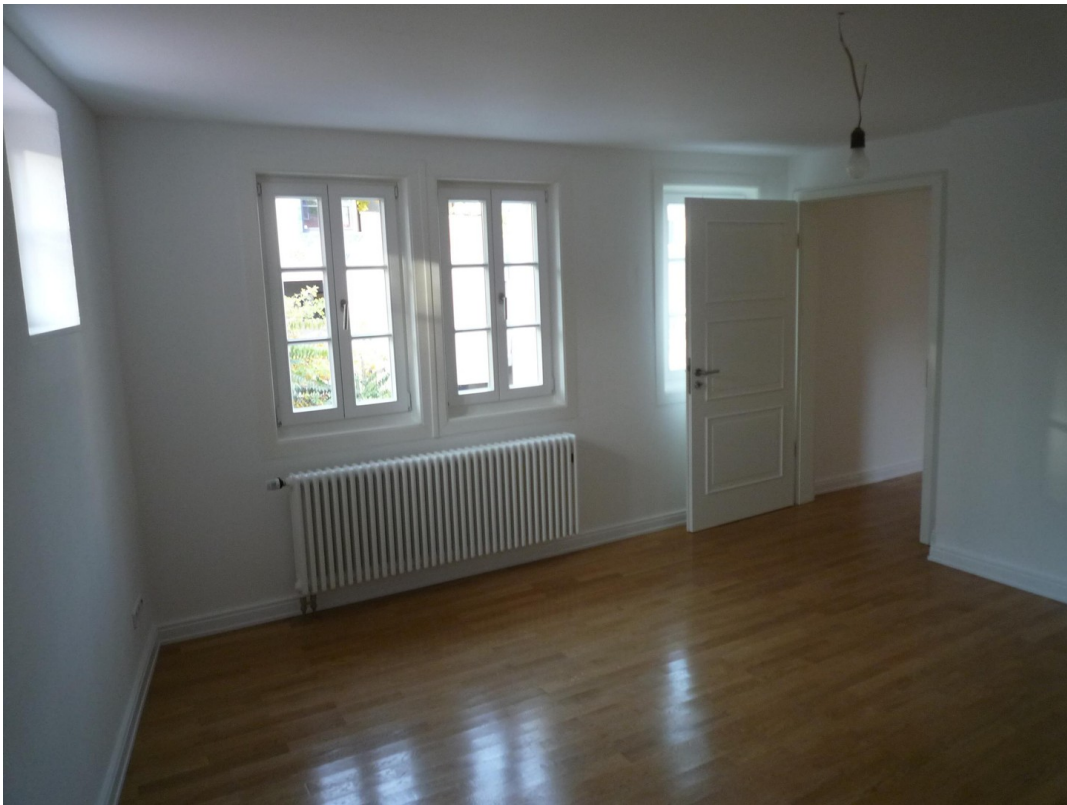
OG - Schlafzimmer 2