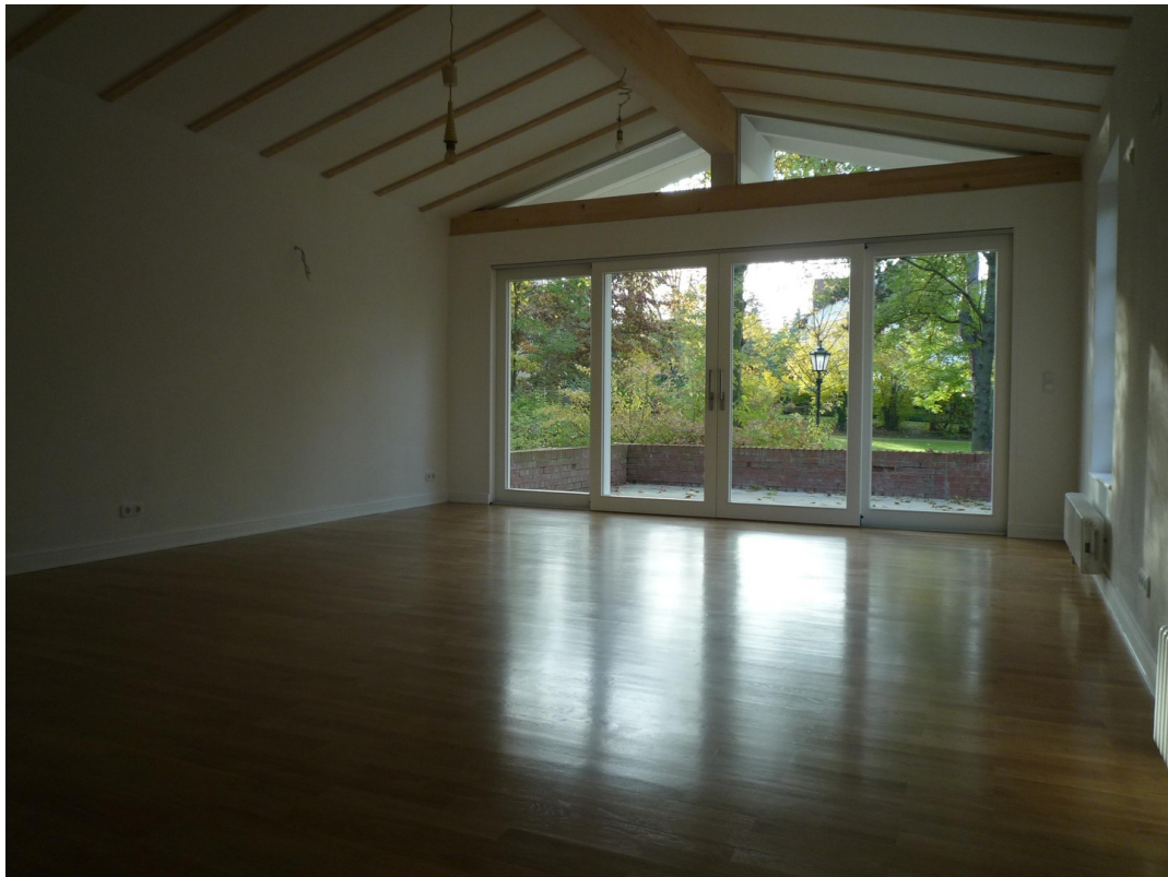
EG - Wohnzimmer mit Terrasezum