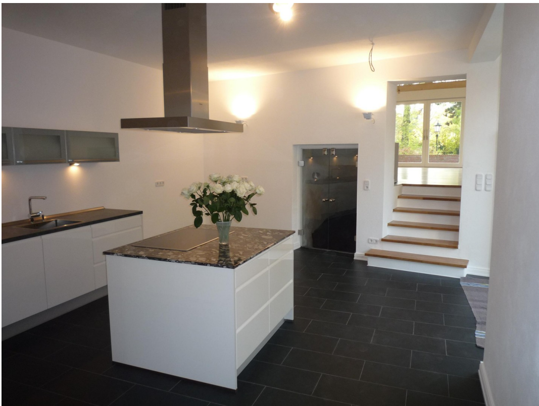
EG - Küche mit Zugang zum Wozi