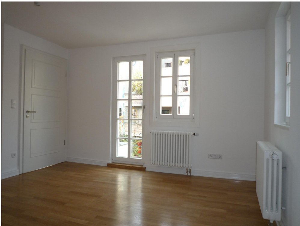
OG - Schlafzimmer 1