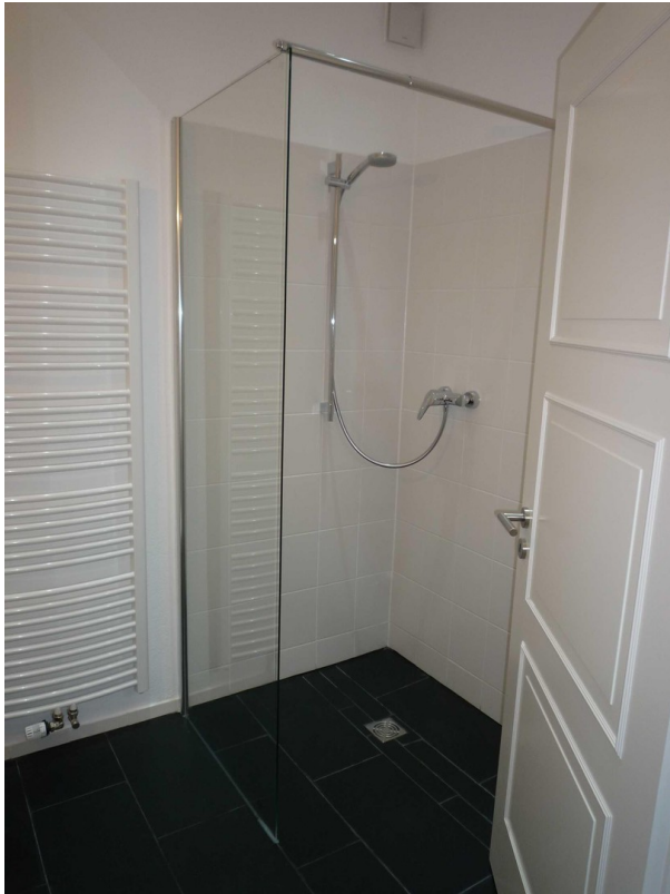
EG - WC mit Dusche