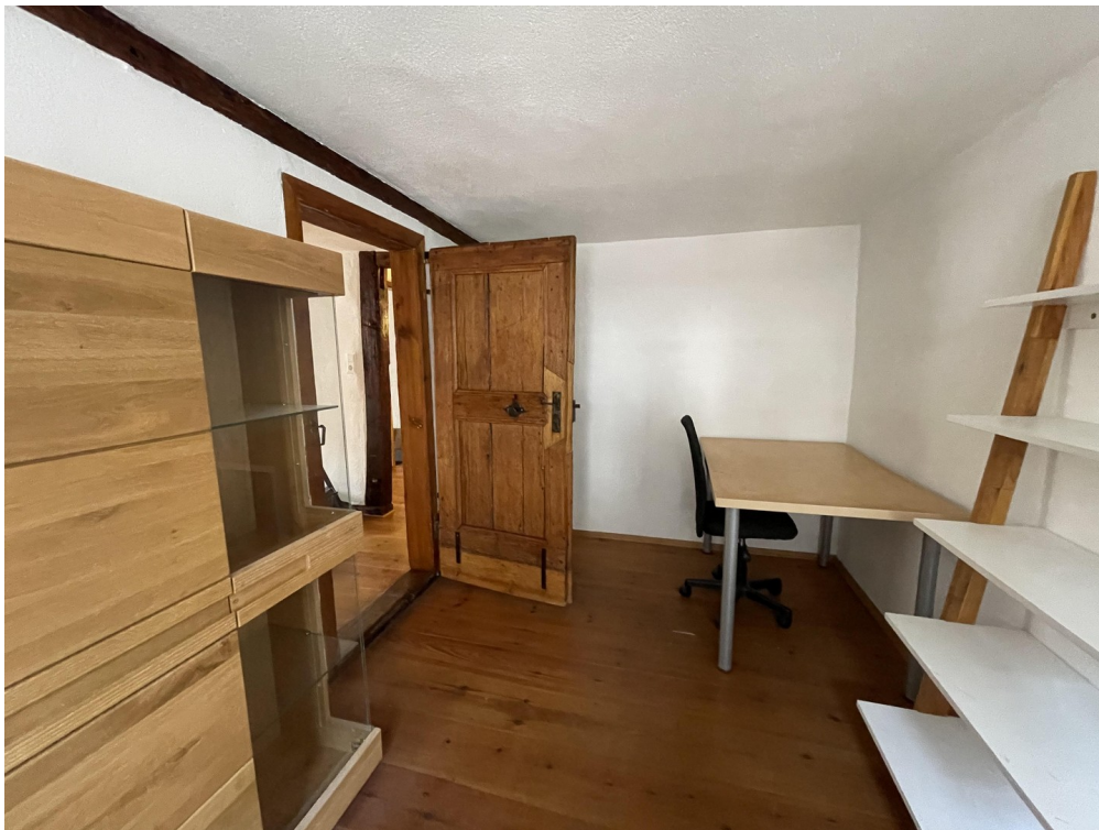
Schlafzimmer 3 2.Obergeschoss