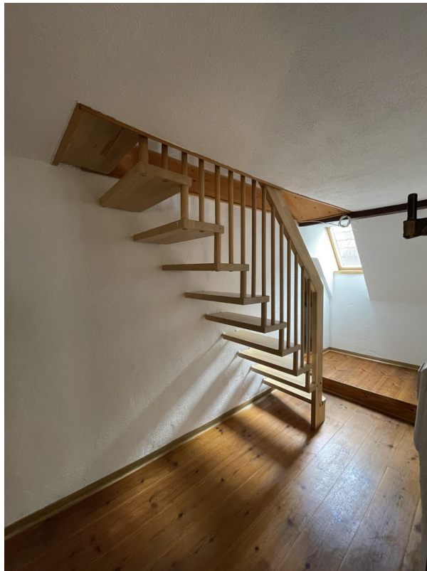
Treppe ins Dachgeschoss