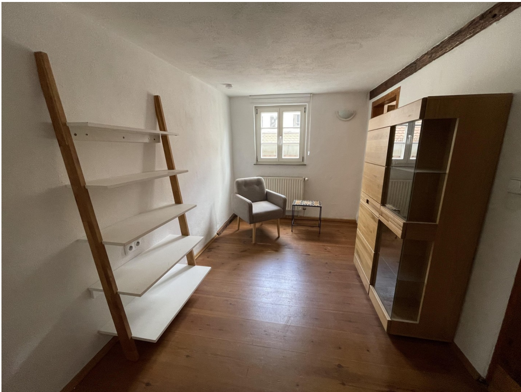
Schlafzimmer 3 2.Obergeschoss