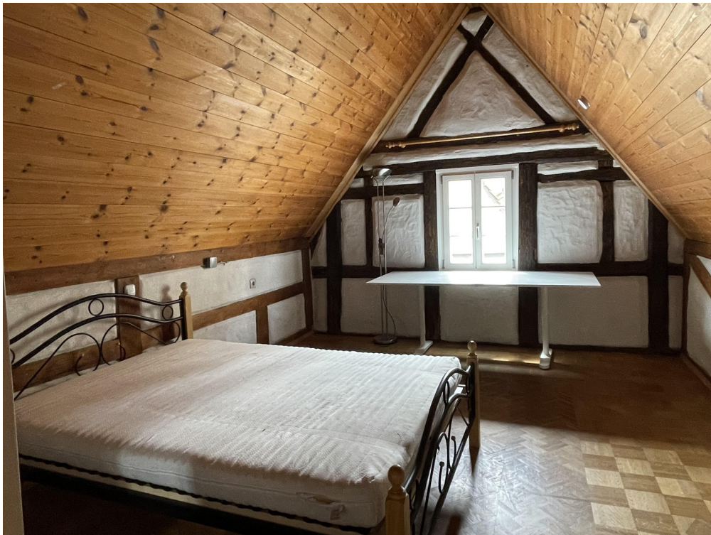
Schlafzimmer 1 Dachgeschoss