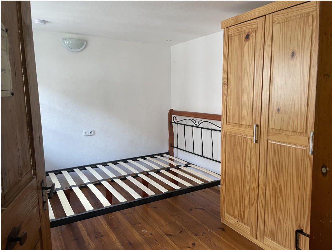
Schlafzimmer 3 2.Obergeschoss