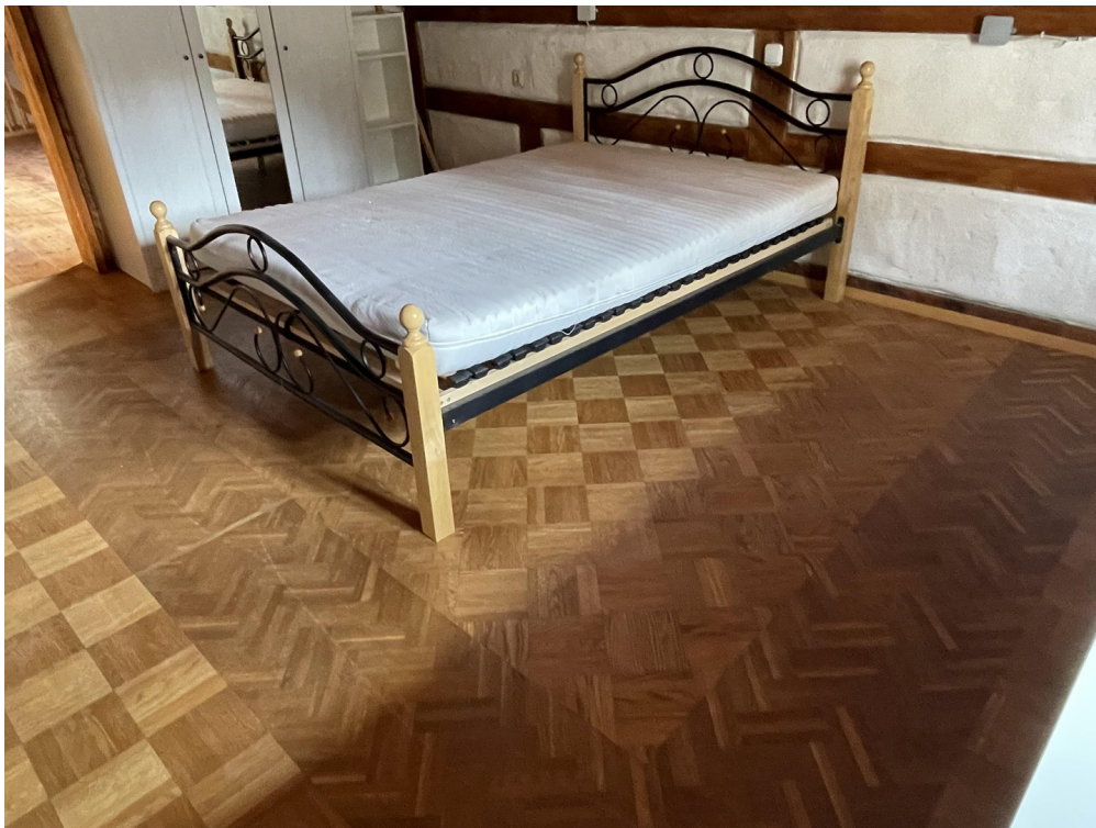
Schlafzimmer 1 Dachgeschoss