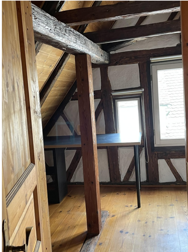
Schlafzimmer 2 Dachgeschoss