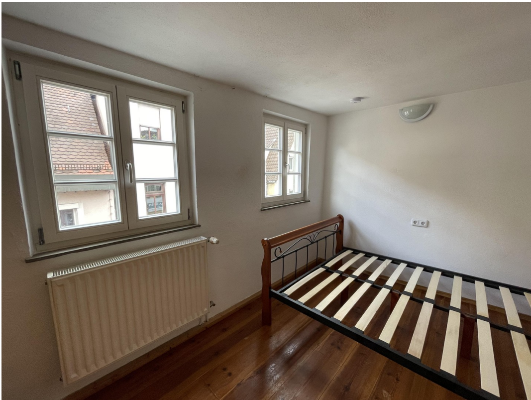
Schlafzimmer 3 2.Obergeschoss