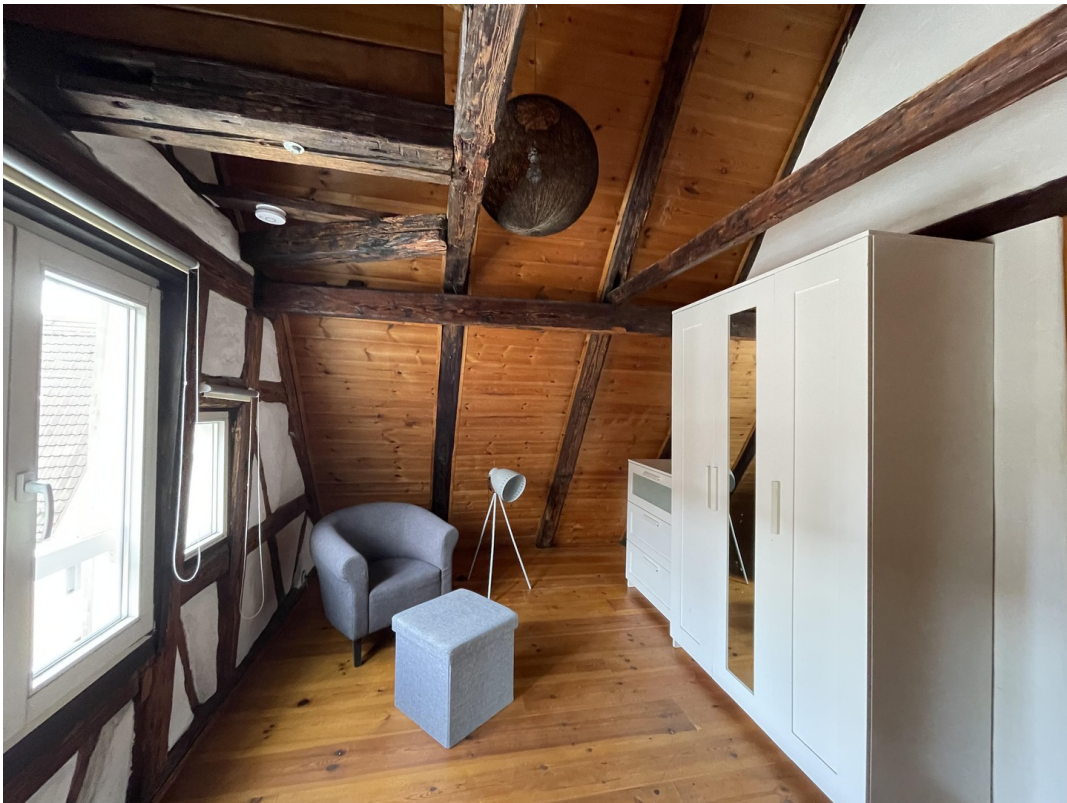
Schlafzimmer 2 Dachgeschoss