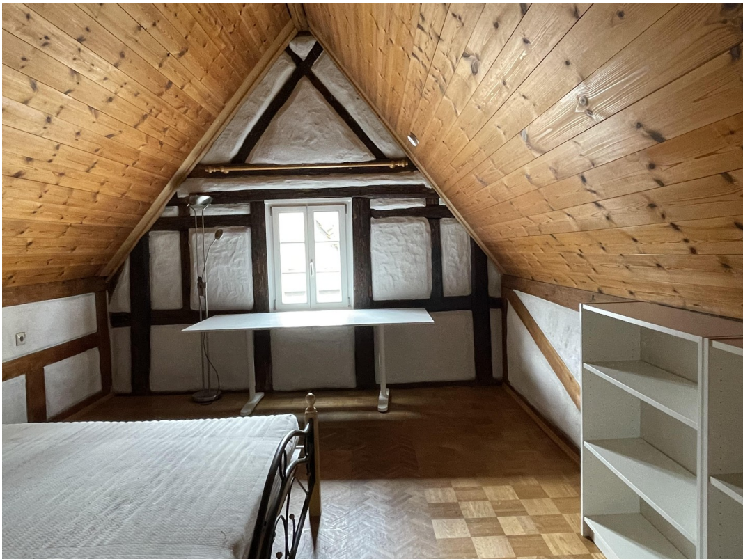
Schlafzimmer 1 Dachgeschoss