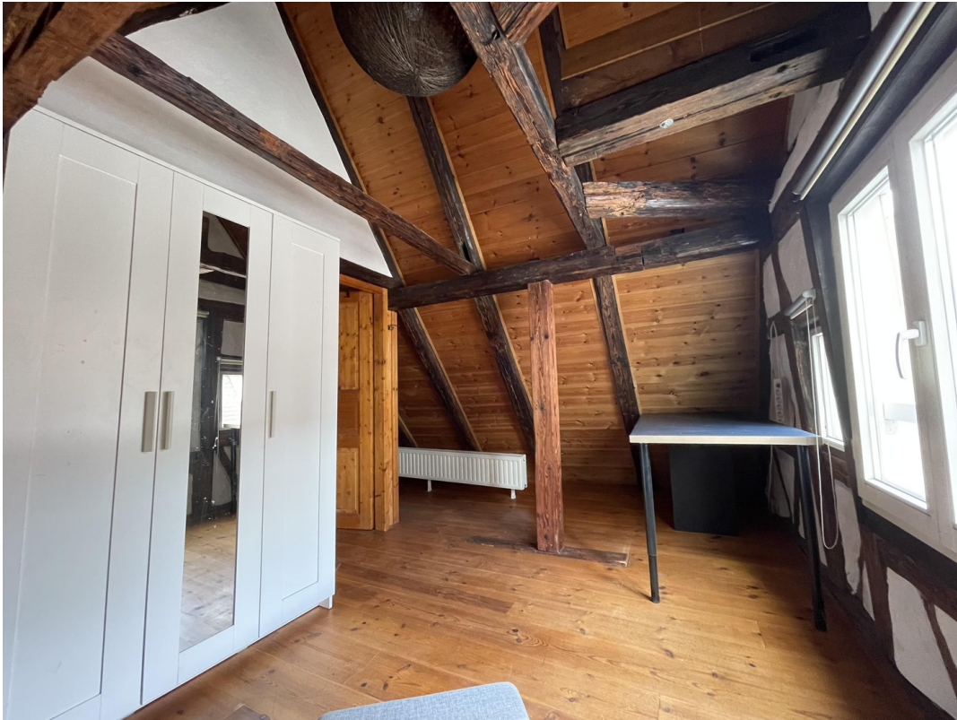
Schlafzimmer 2 Dachgeschoss