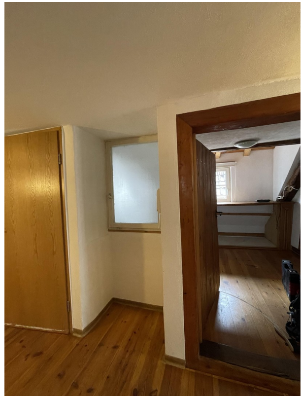
Blick Flur zur Speisekammer