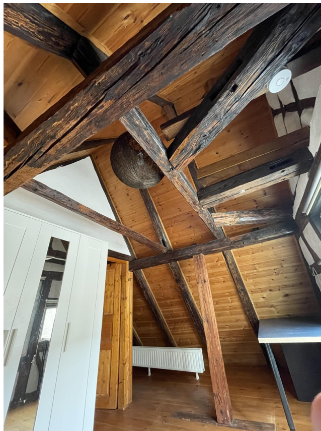
Schlafzimmer 2 Dachgeschoss