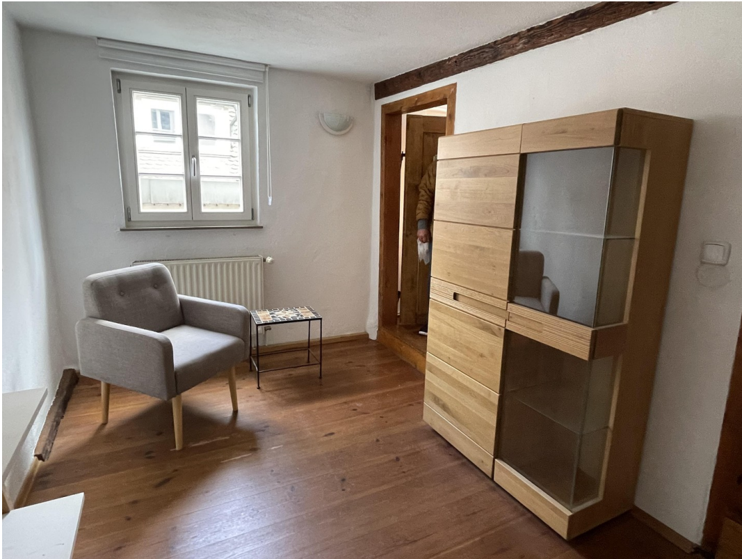
Schlafzimmer 3 2.Obergeschoss