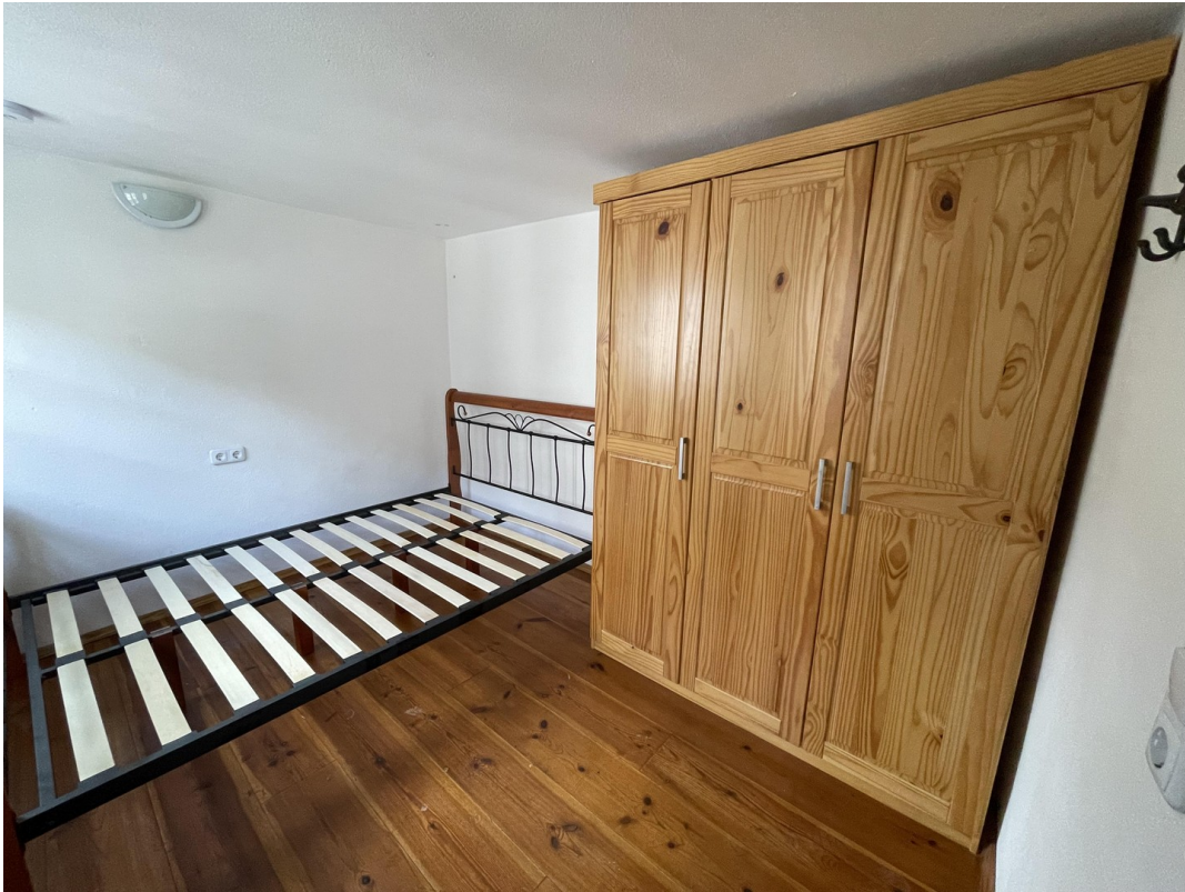
Schlafzimmer 3 2.Obergeschoss