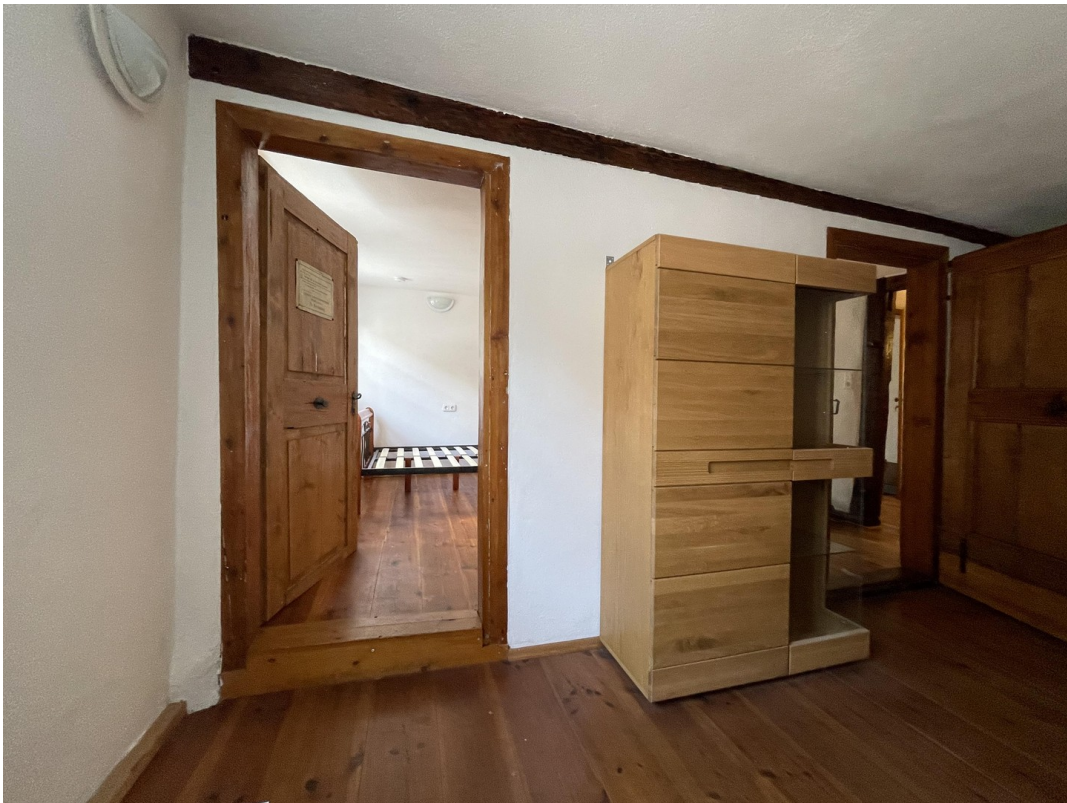
Schlafzimmer 3 2.Obergeschoss