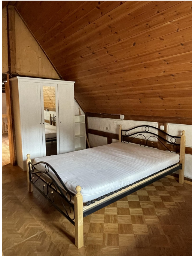
Schlafzimmer 1 Dachgeschoss