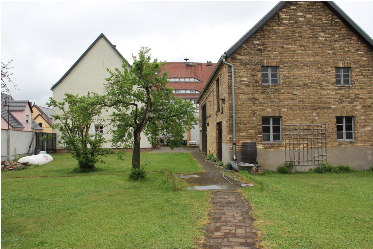
Sicht aus dem Garten