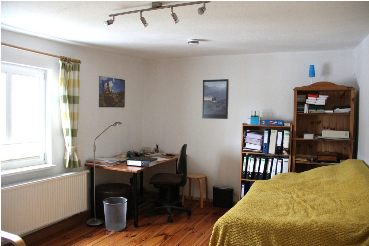
Arbeits-/ Gäste-/ Kinderz.oben