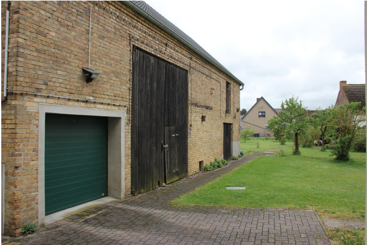
Nebengebäude mit Garage