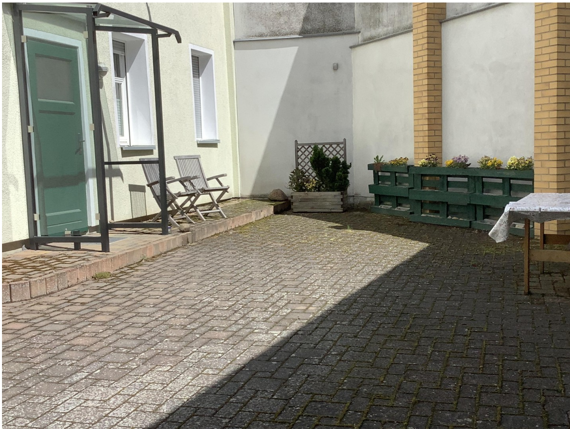
Ausgang zum Hof mit Sitzplatz