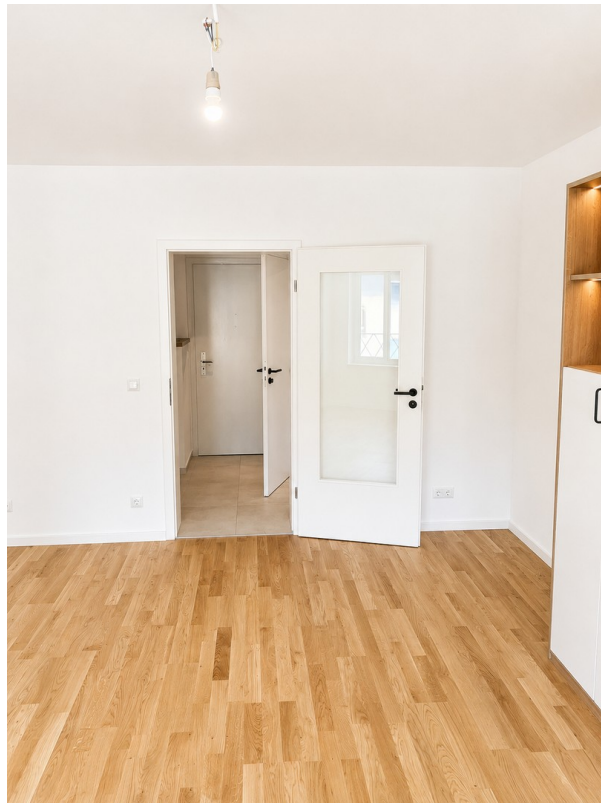
Wohnraum mit Blick zum Flur