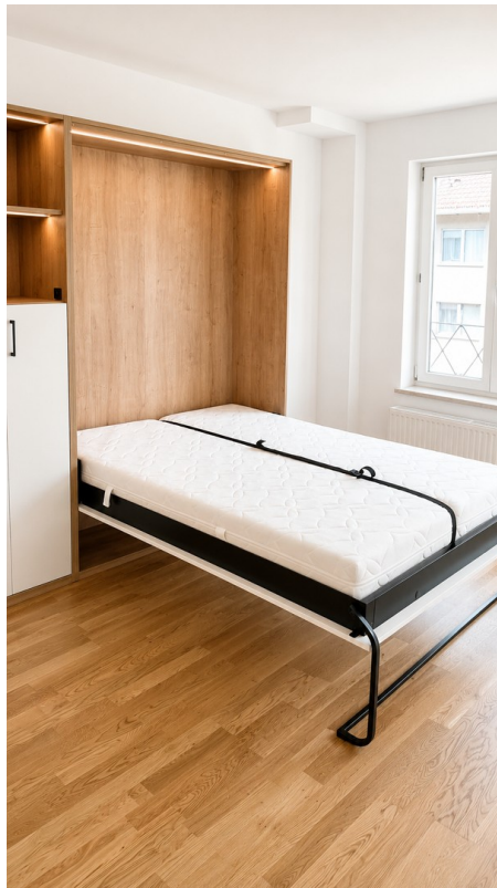
Einbaumöbel mit Bett