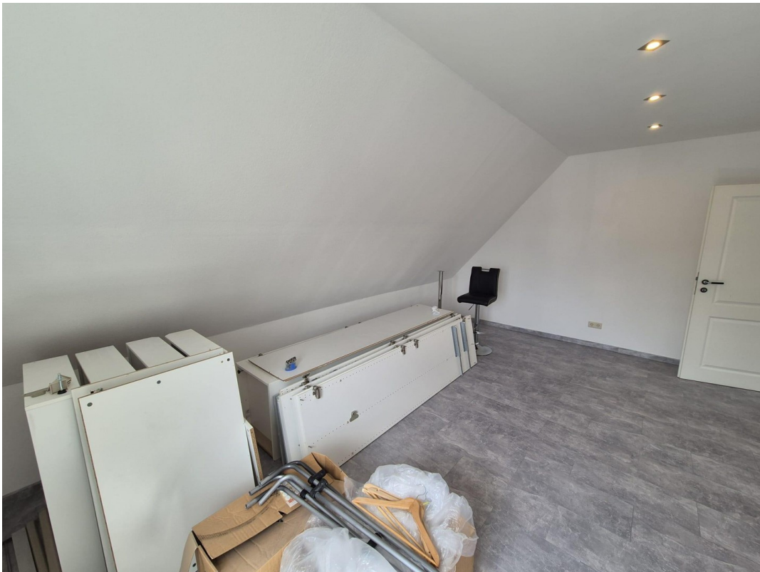
Arbeits- / Kinderzimmer 1