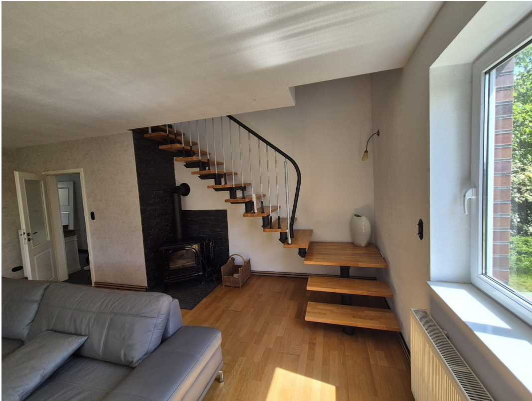
Wohnzimmer Treppe 1