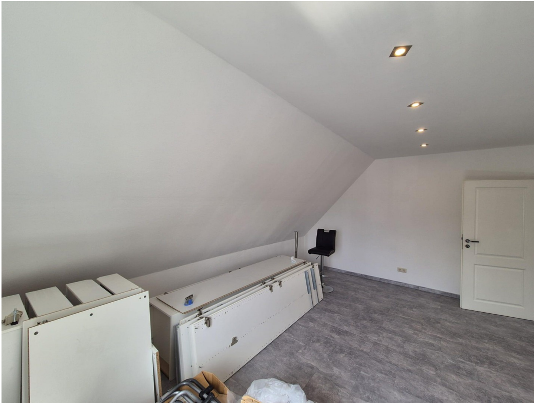
Arbeits- / Kinderzimmer