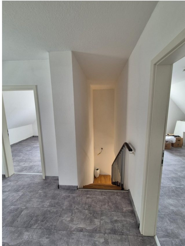
Flur oben 2