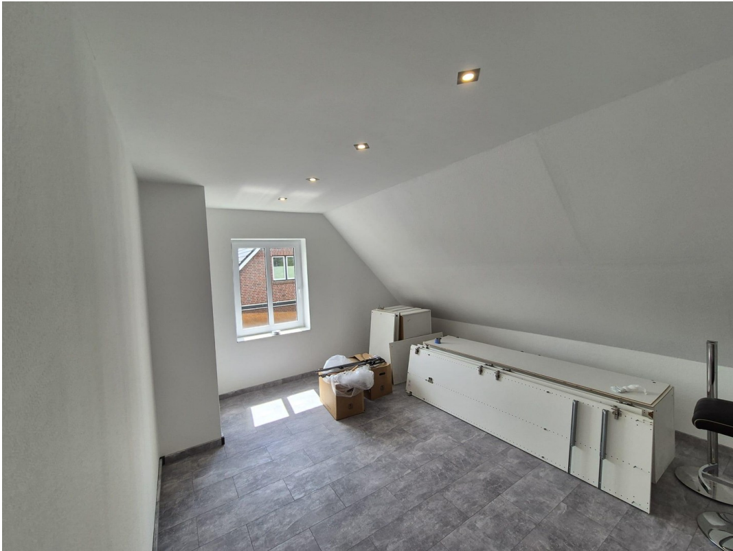
Arbeits- / Kinderzimmer 1