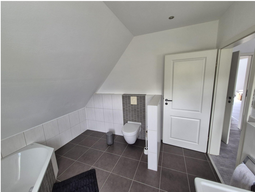
Arbeits- / Kinderzimmer 2