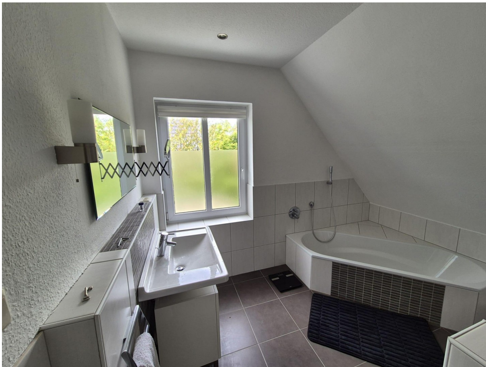
Bad oben 1