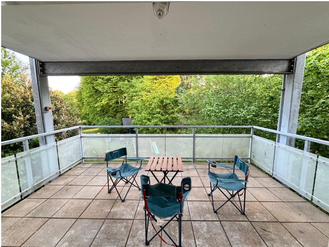
Großer Balkon ins Grüne