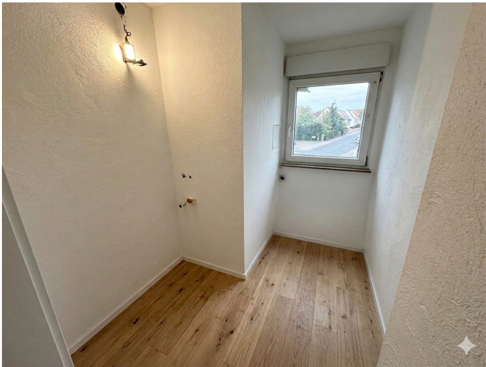
KI Beispiel HWR