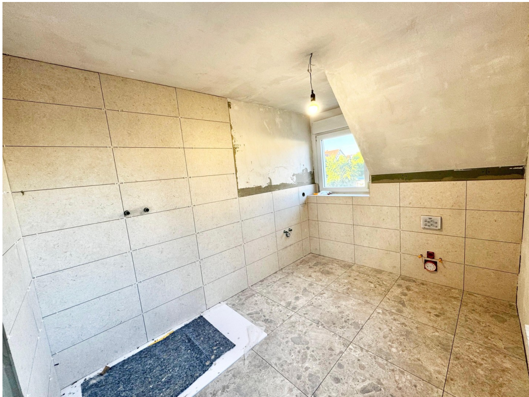
Badezimmer 2/ Eltern