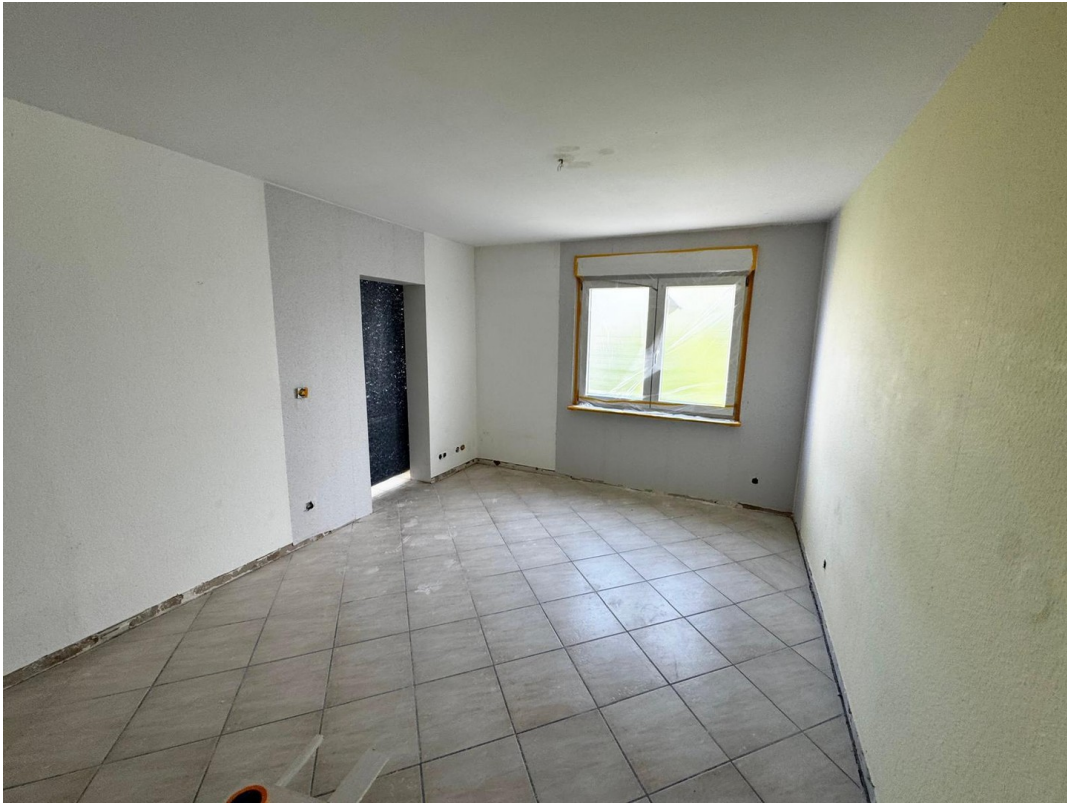
Elternschlafzimmer mit Bad