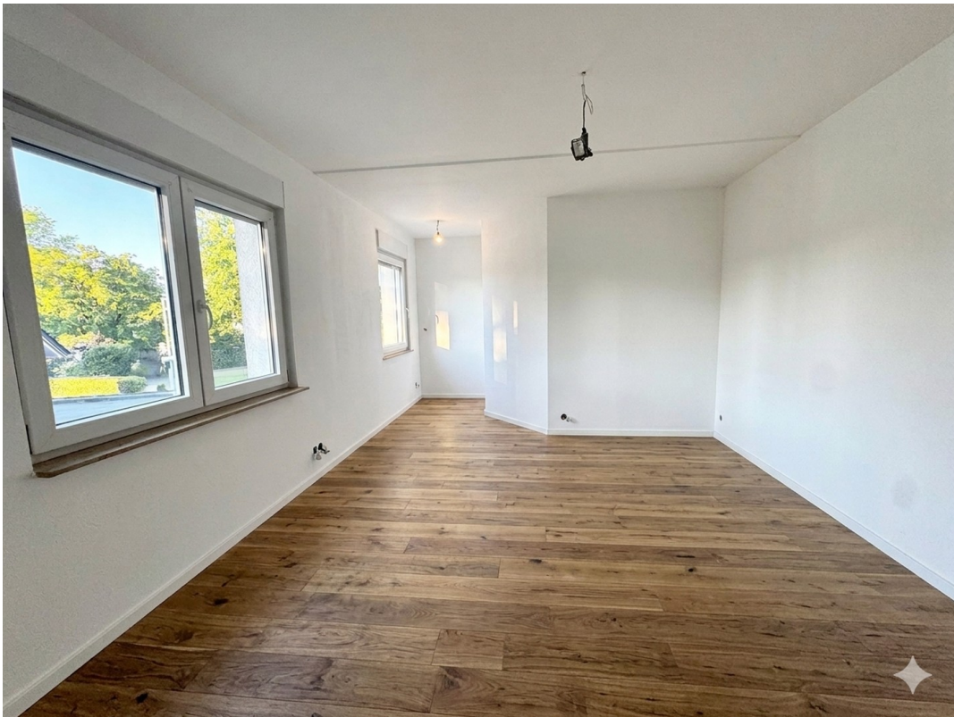
KI Beispiel Kinderzimmer 2