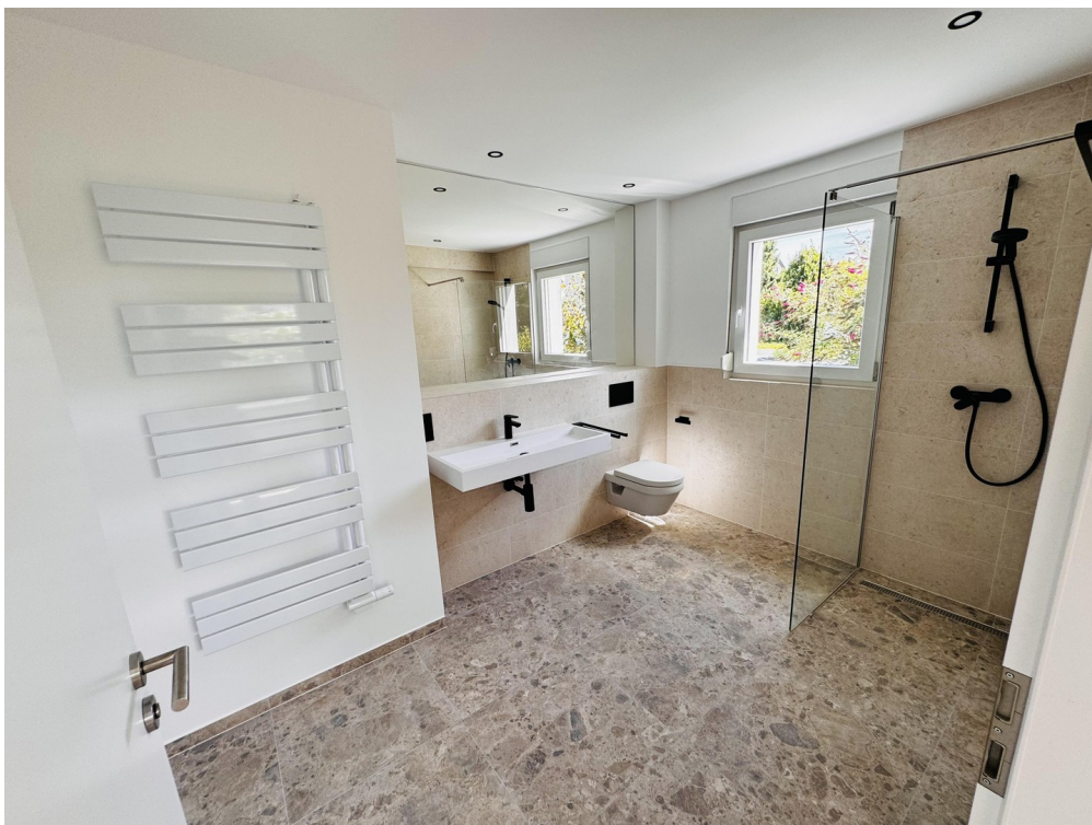
Beispiel - fertiges Bad EG