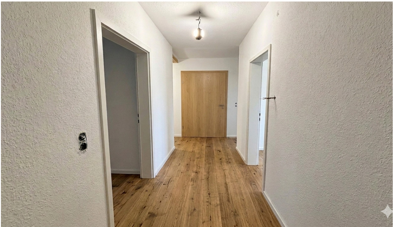
KI Beispiel Flur