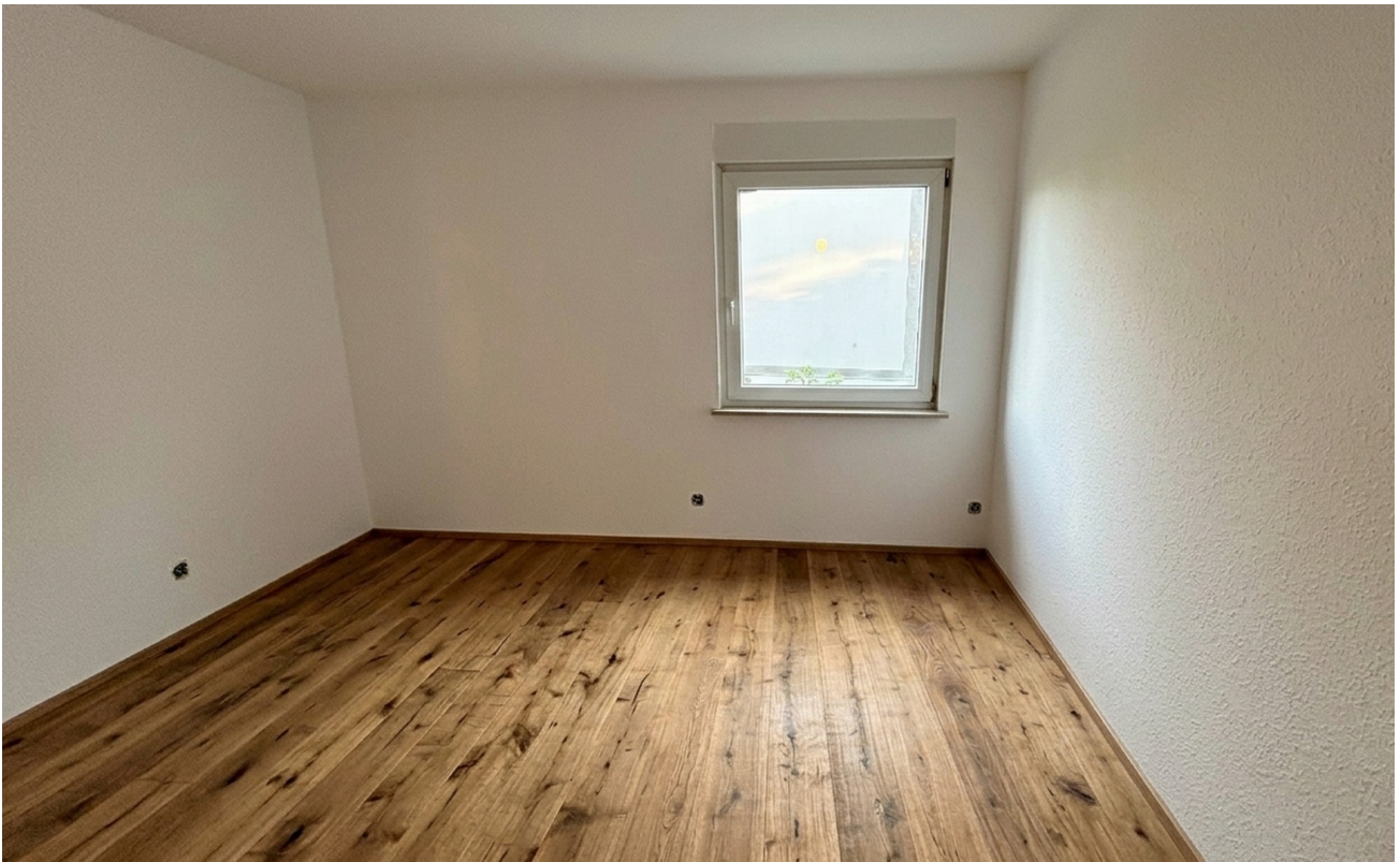
KI Beispiel Büro/ KZ 3