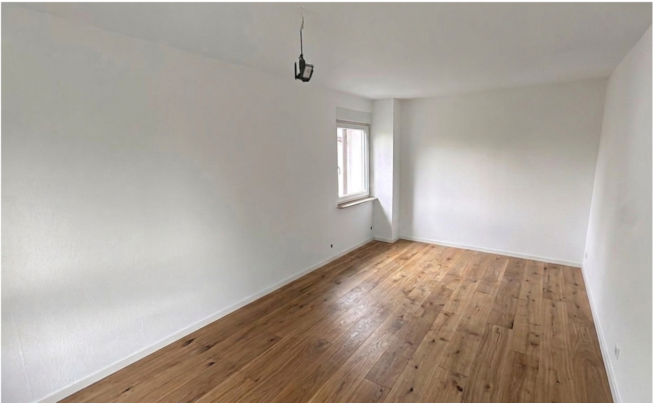
KI Beispiel Kinderzimmer 1