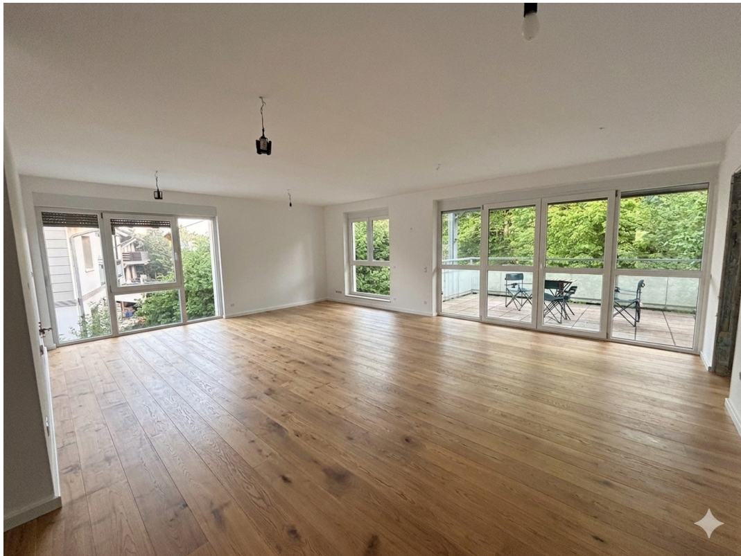
KI Beispiel Wohn-Esszimmer