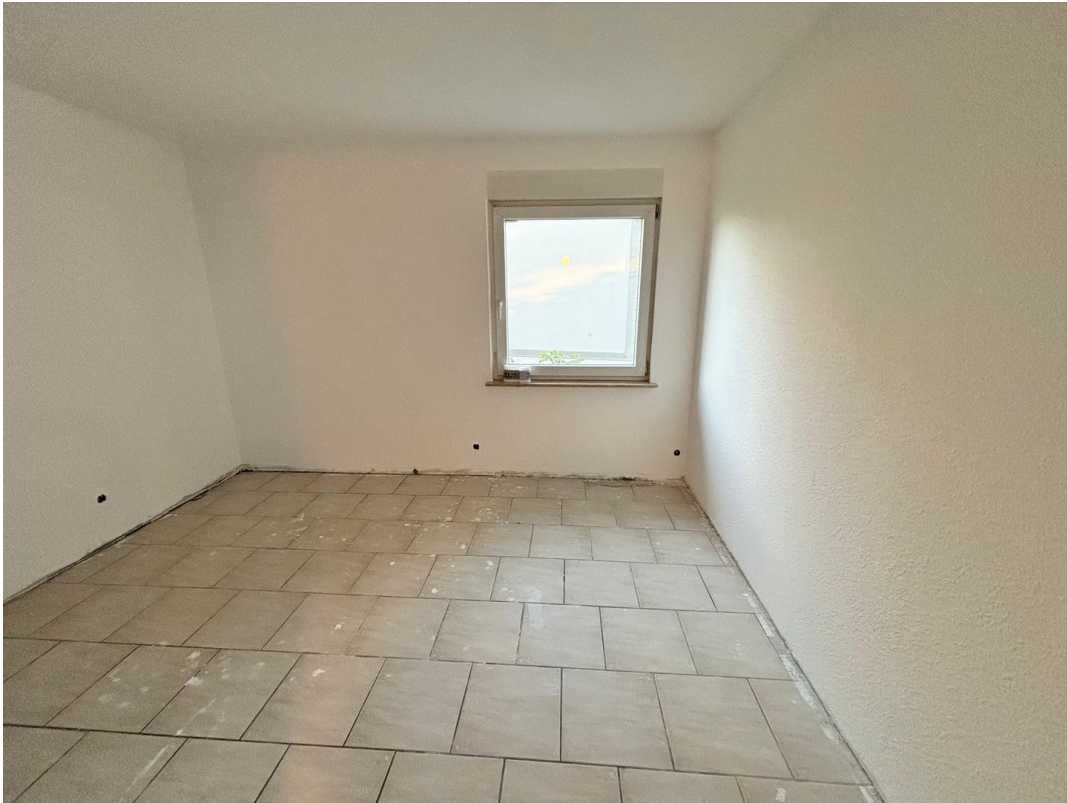
Büro/ Kinderzimmer 3