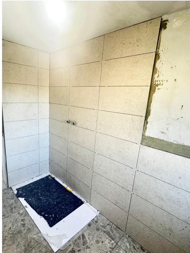
Große Dusche 140x80cm