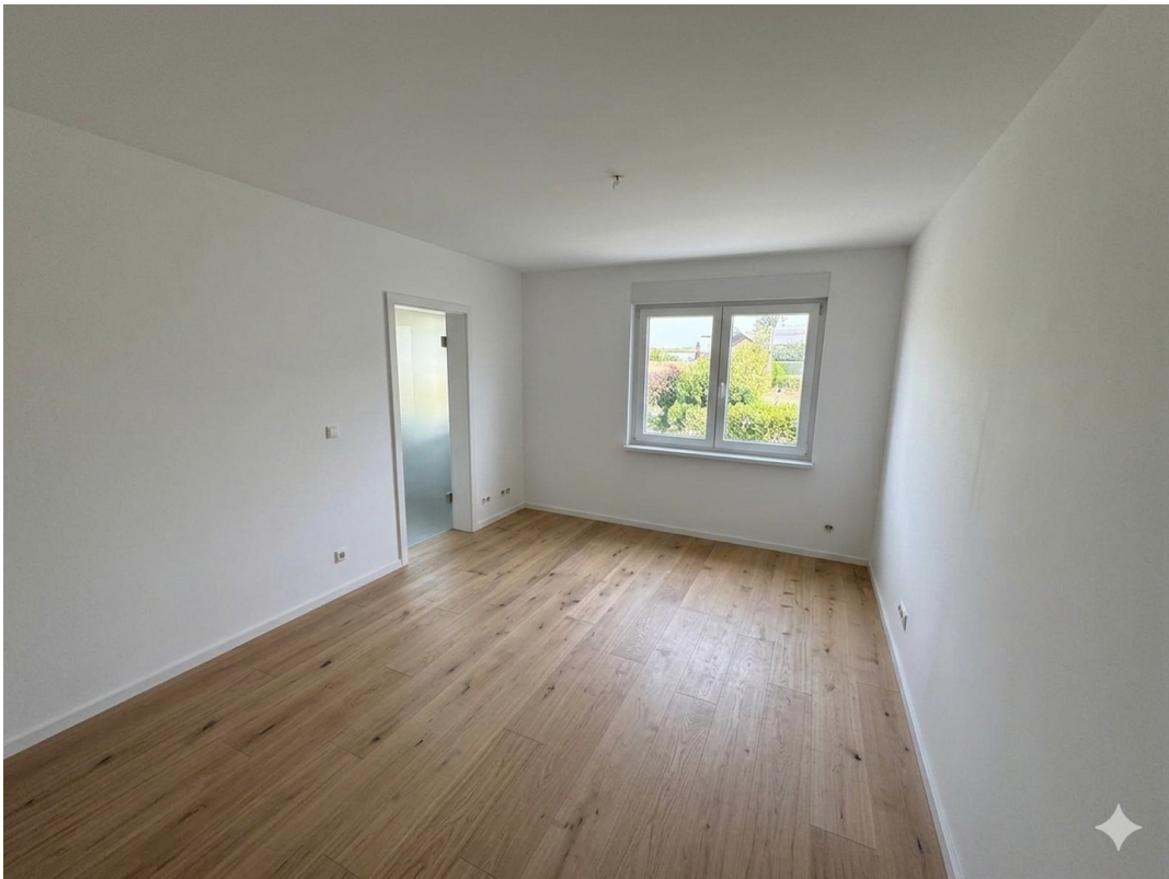
KI Beispiel Elternschlafzimmer