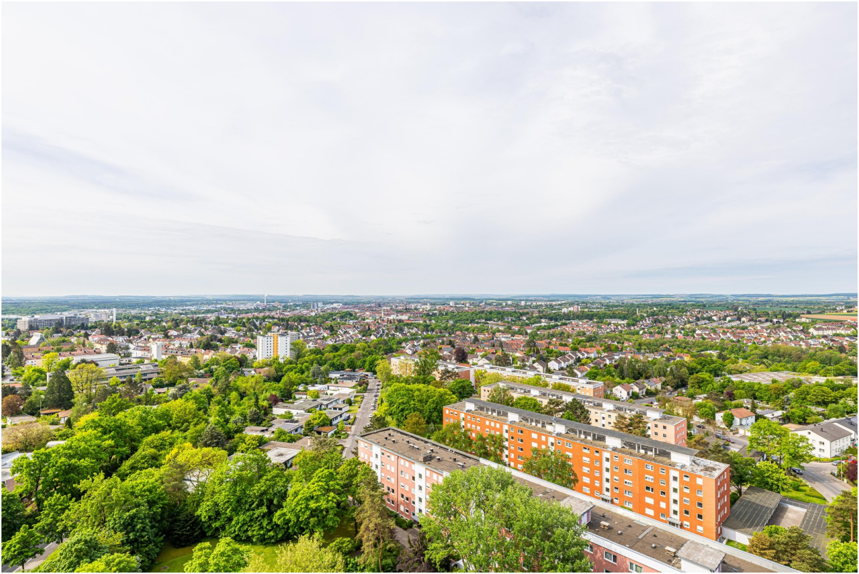
Ausblick auf die Stadt