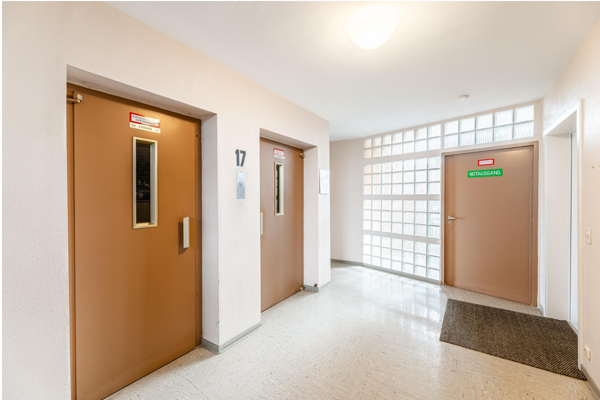
Aufzüge. Barrierefreier Zugang