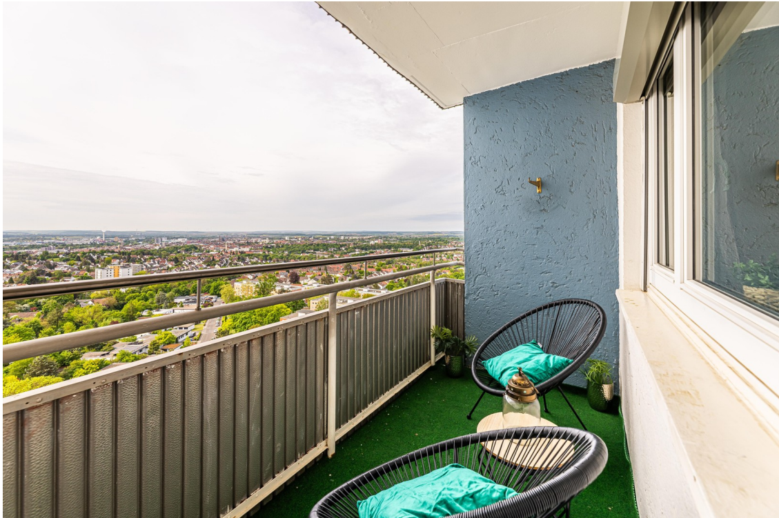
Süd-Balkon mit Weitblick