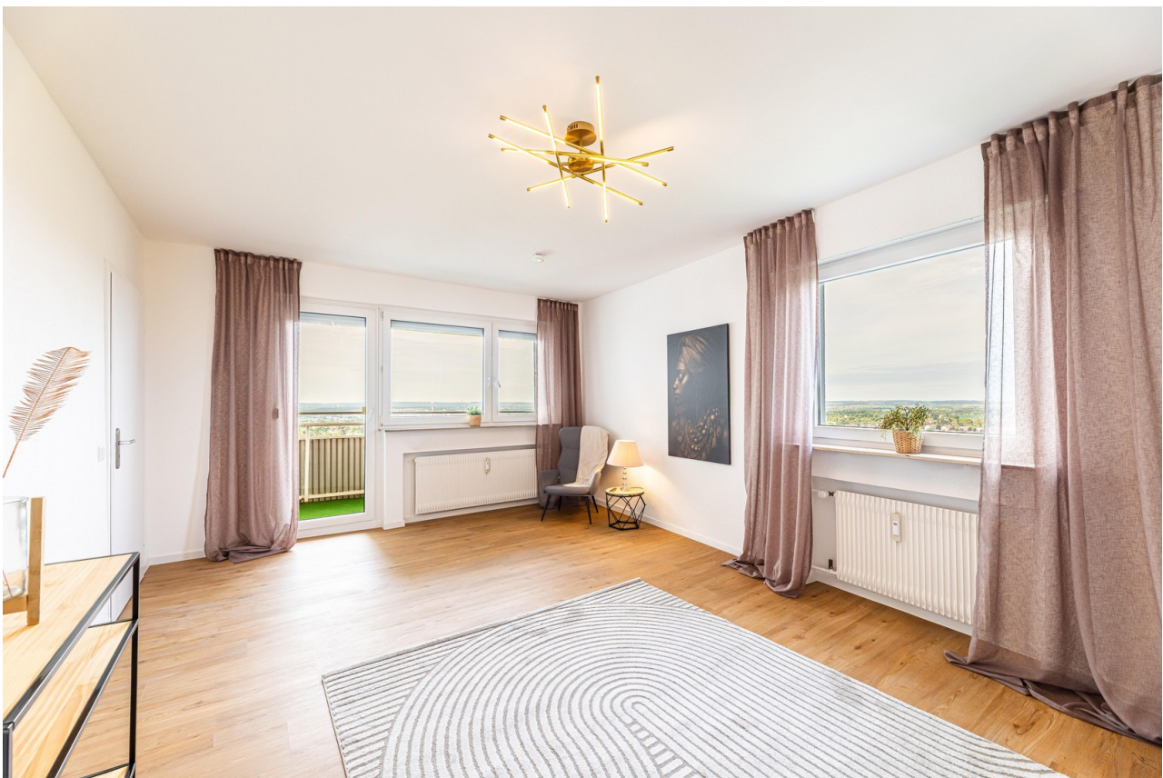
Helles Wohnzimmer mit Balkon