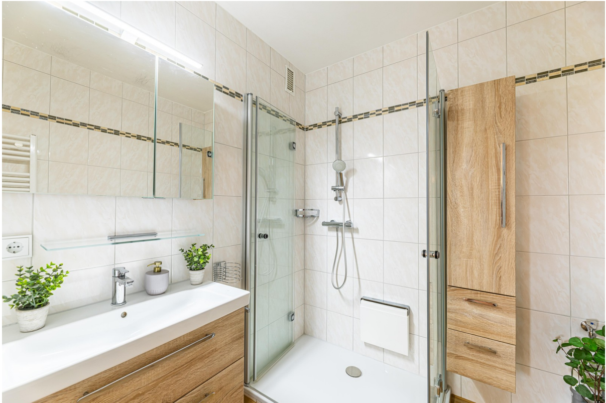
Bad mit Dusche und WM