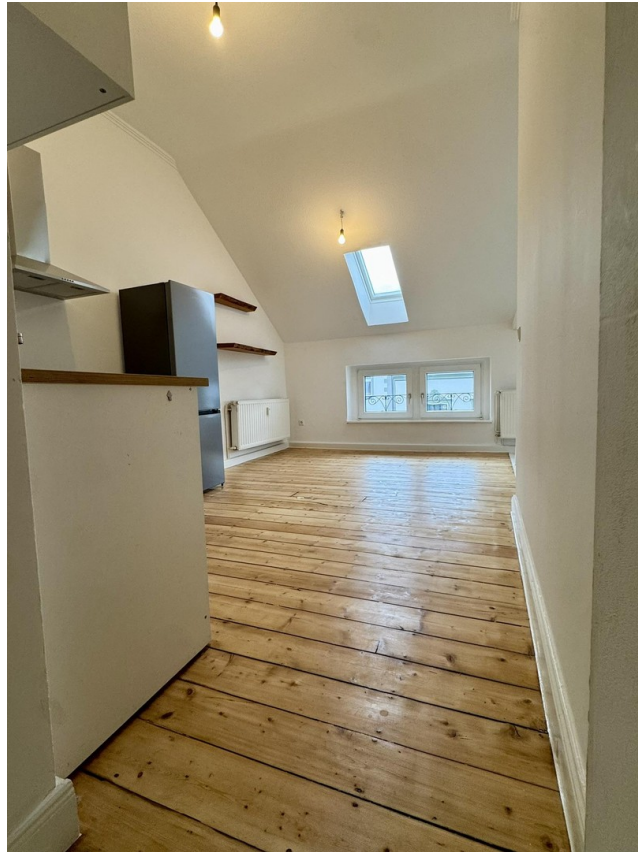
Zugang zum Wohn-Ess-Bereich