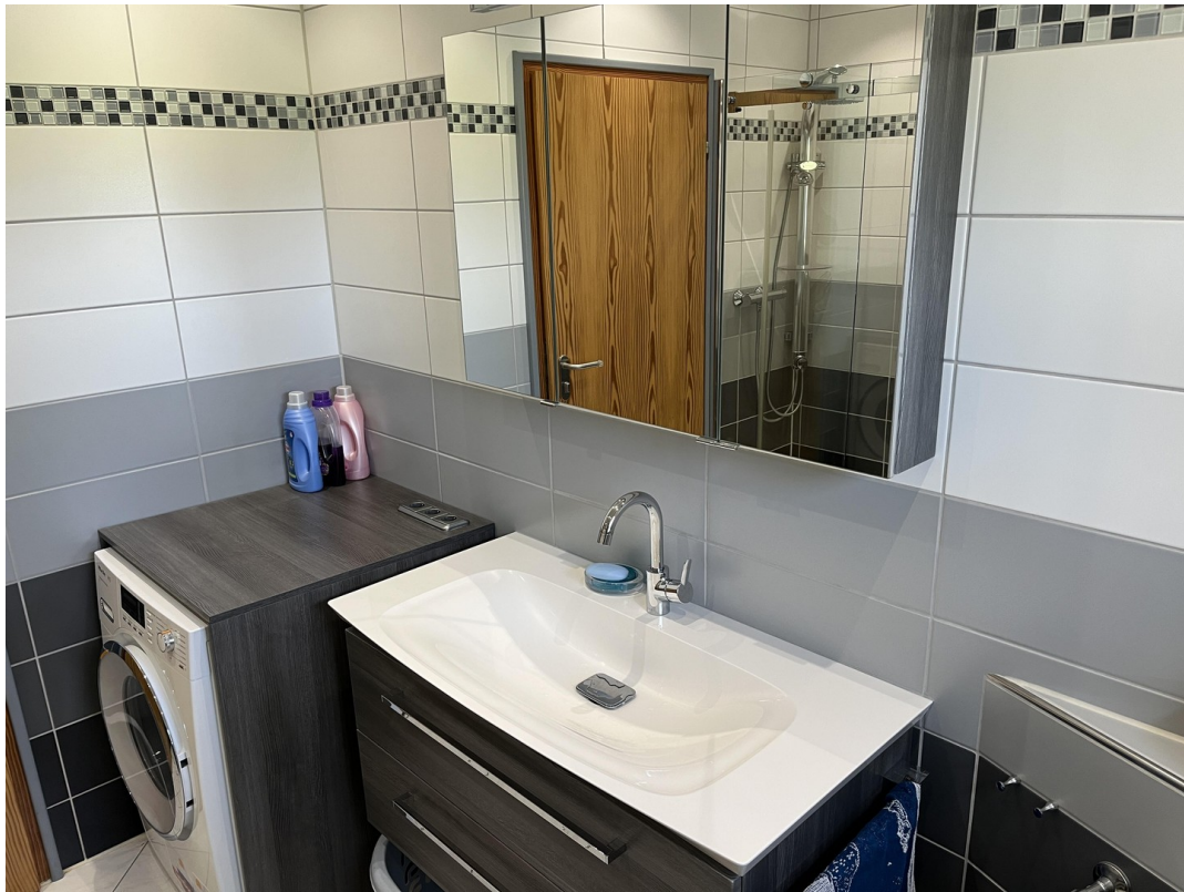
Bad EG Bild 1