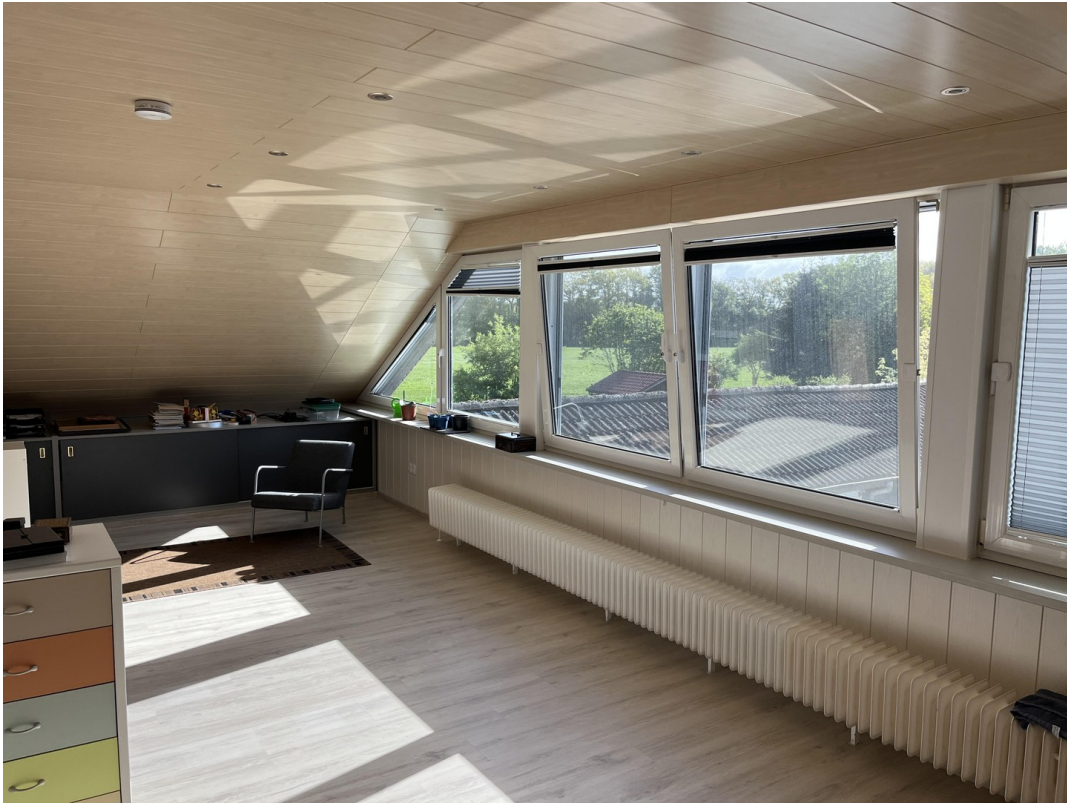
Schlafzimmer 3 Bild 2