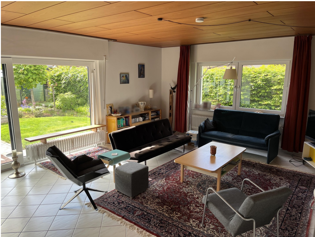
Wohnzimmer Bild 1