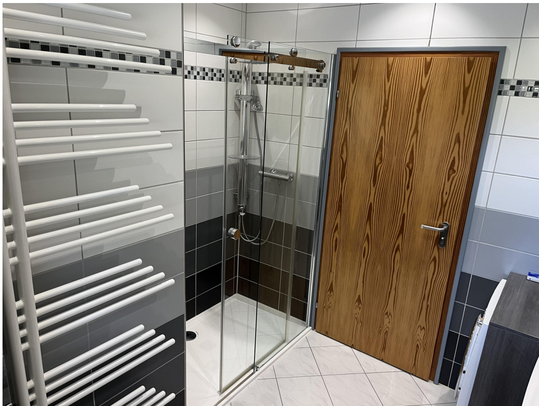
Bad EG Bild 2