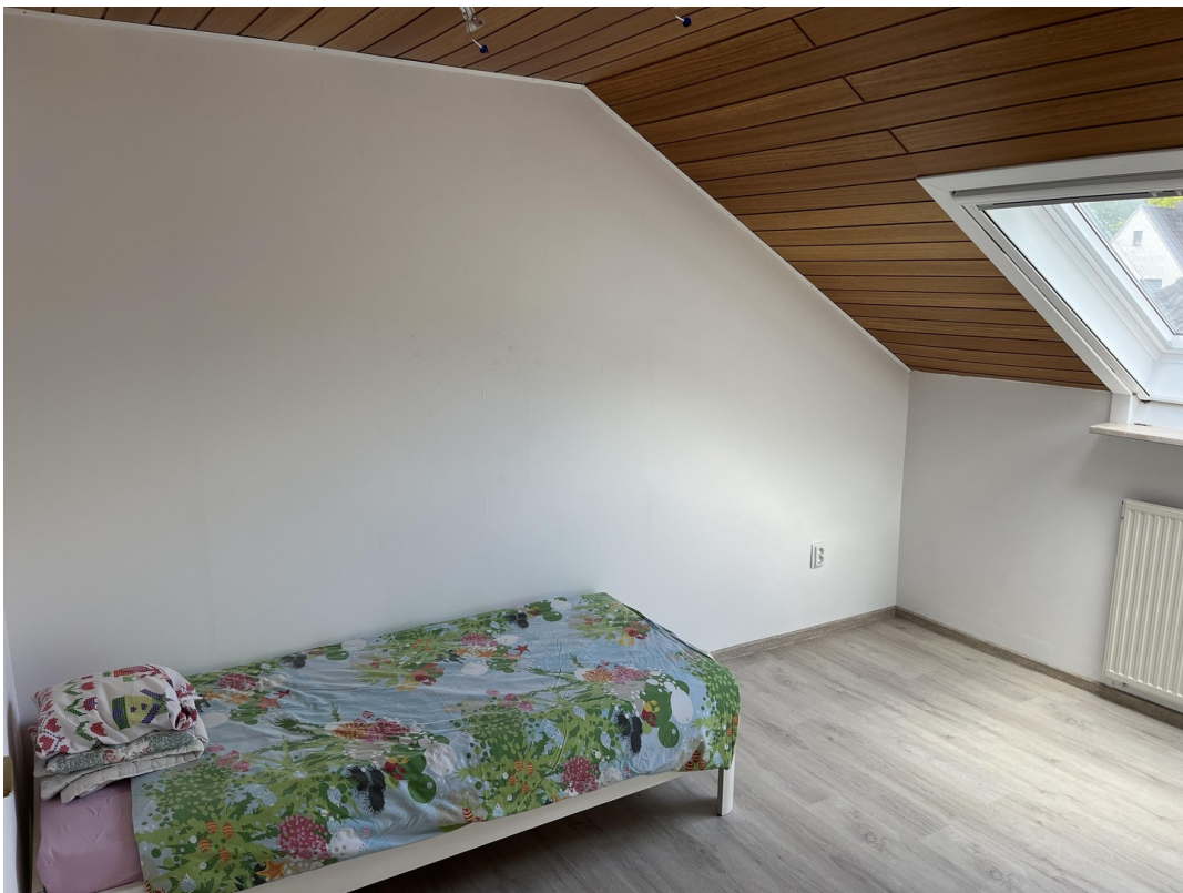
Schlafzimmer 2 Bild 1