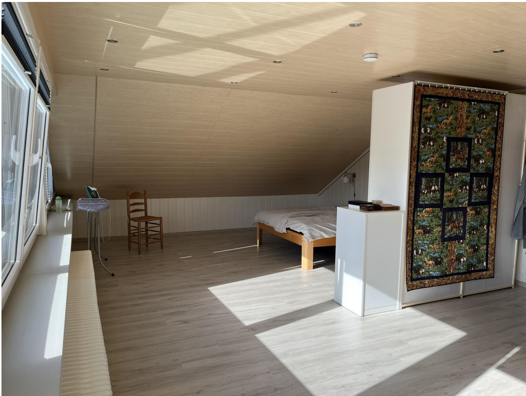
Schlafzimmer 3 Bild 1