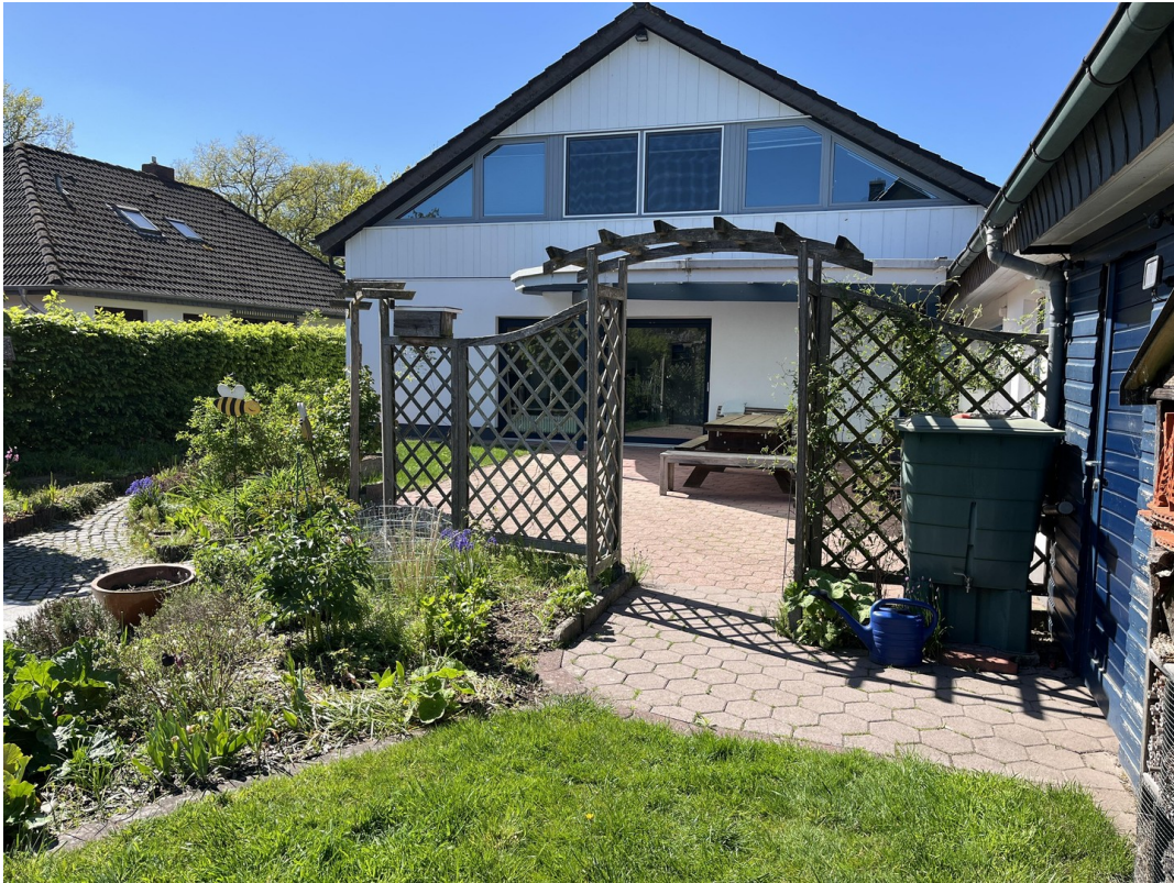
Gartenansicht Bild 2