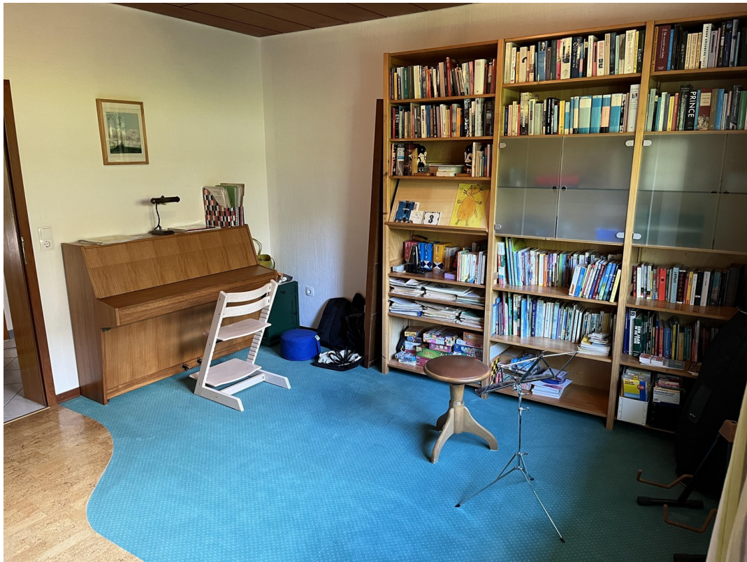
Gäste/Hobby Zimmer EG