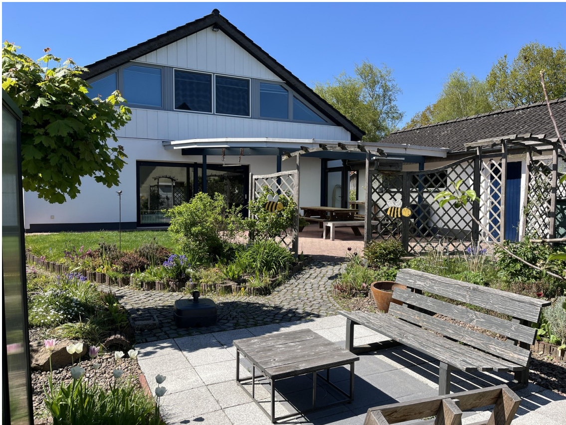
Gartenansicht Bild 1