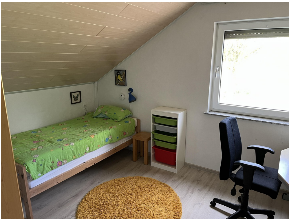
Schlafzimmer 1 Bild 1