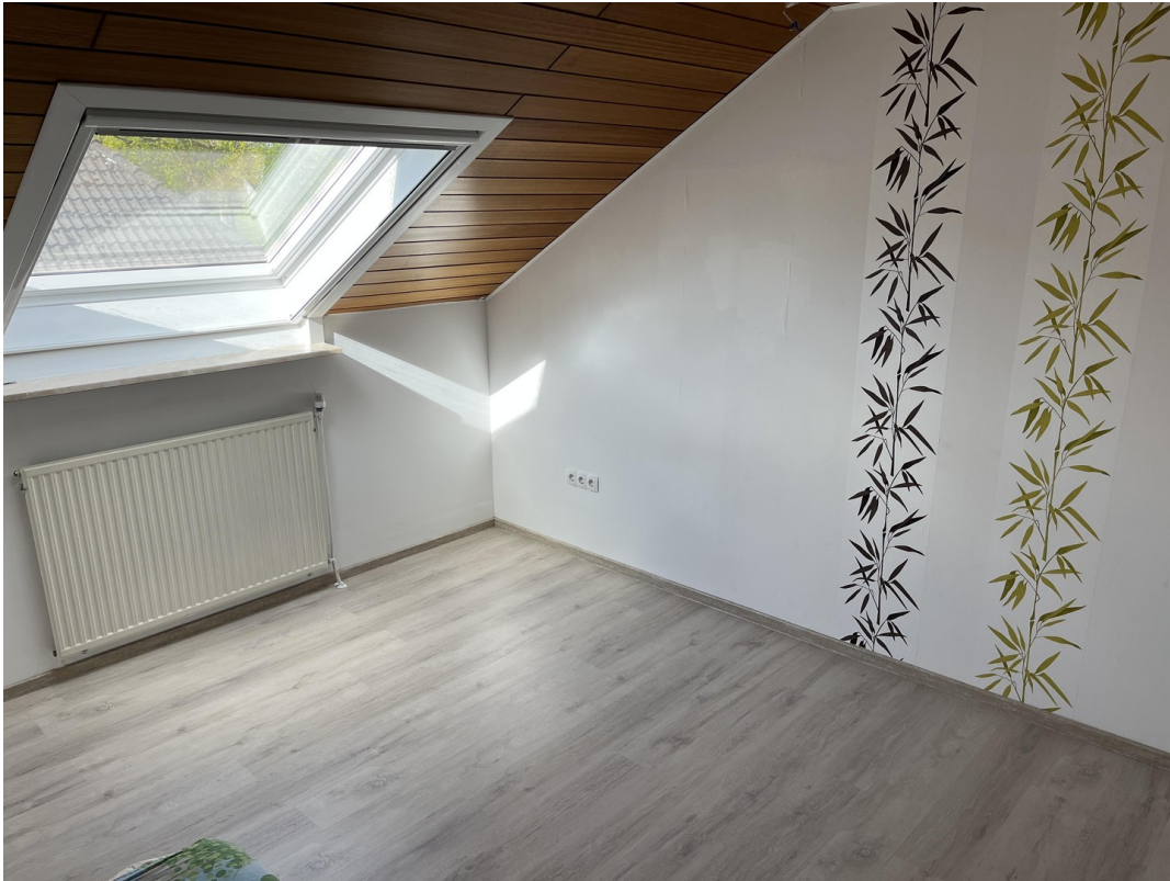
Schlafzimmer 2 Bild 2