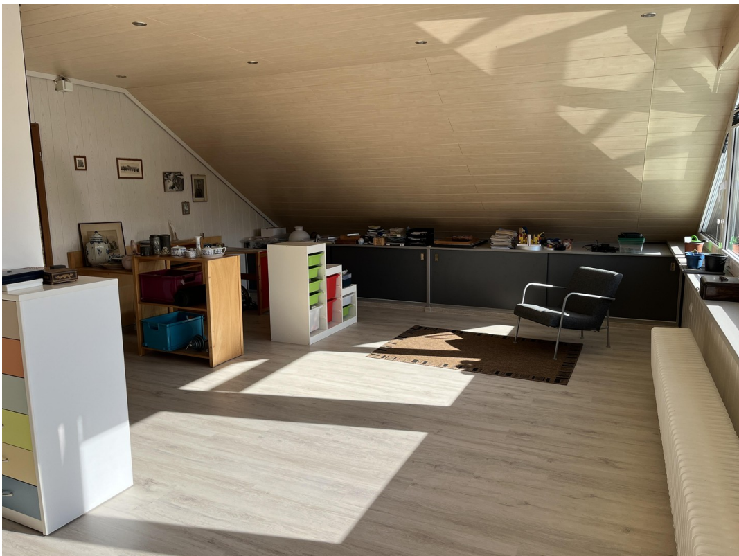
schlafzimmer 3 Bild 3