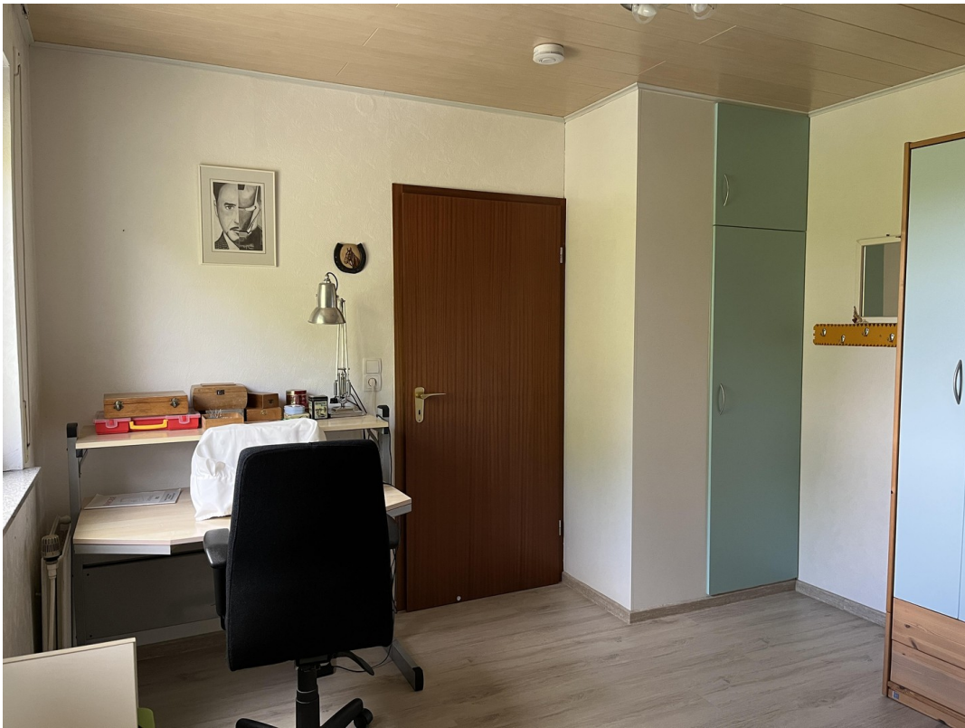
Schlafzimmer 1 Bild 2