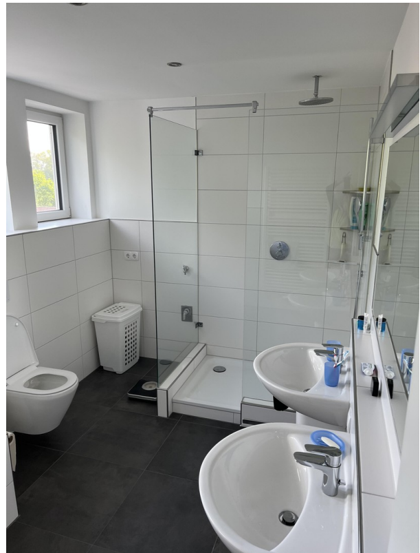
Bad OG Bild 1