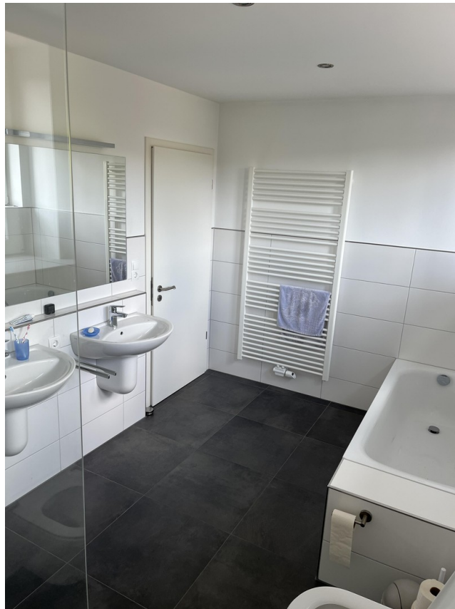
Bad OG Bild 2