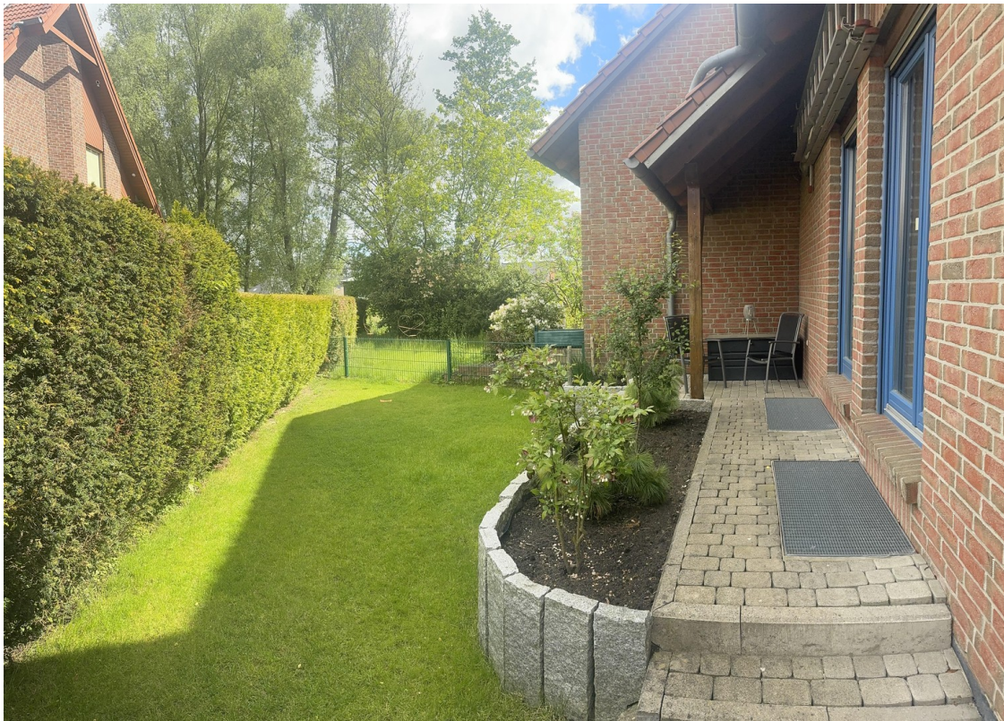
Garten mit zweiter Terasse