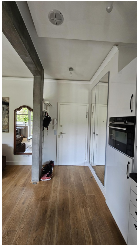
Blick zur Eingangstür