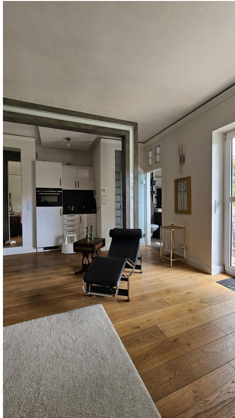
Blick auf die Küchenzeile