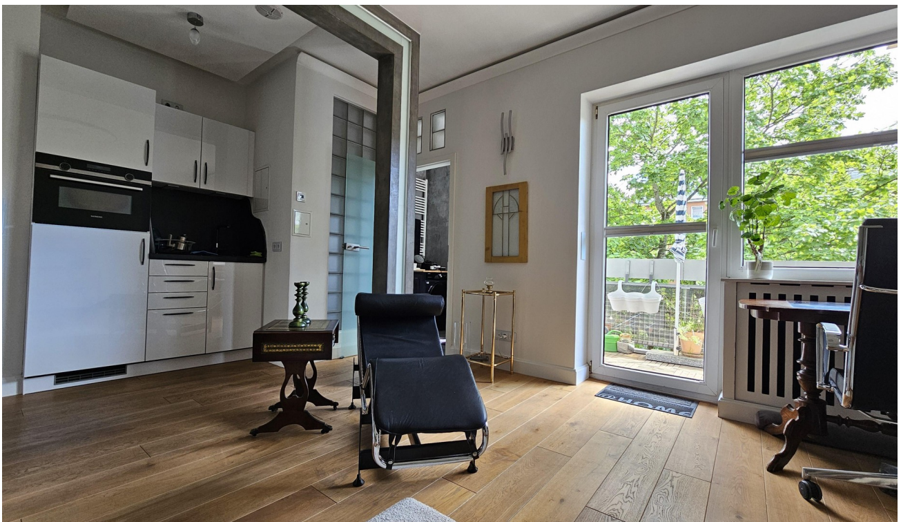
Blick zum Badezimmer