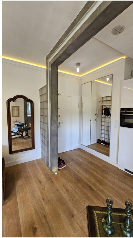
Blick zum Spiegelfrontschrank