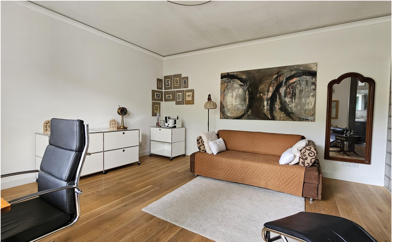
Kaffee und Frühstücksecke