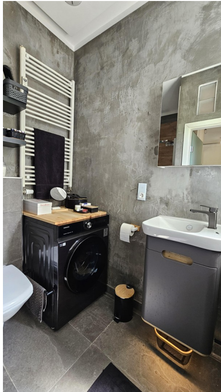
Waschmaschine im Bad