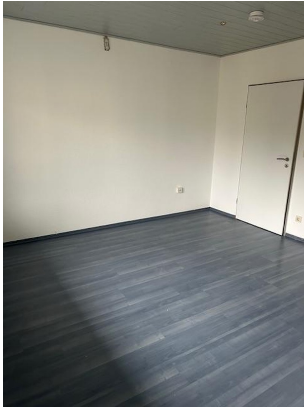
Schlafzimmer 1 Sicht 1