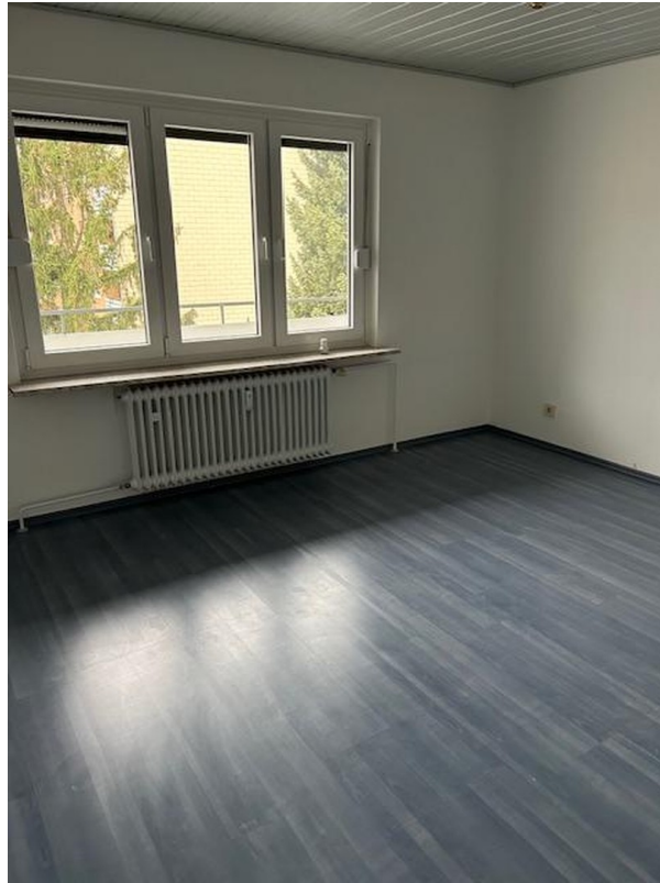
Schlafzimmer 1 Sicht 3