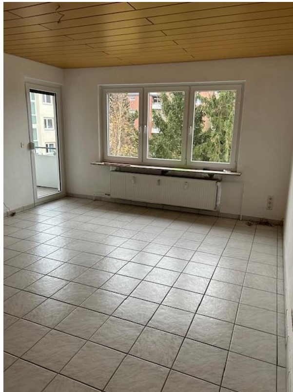
Wohnzimmer Sicht 2