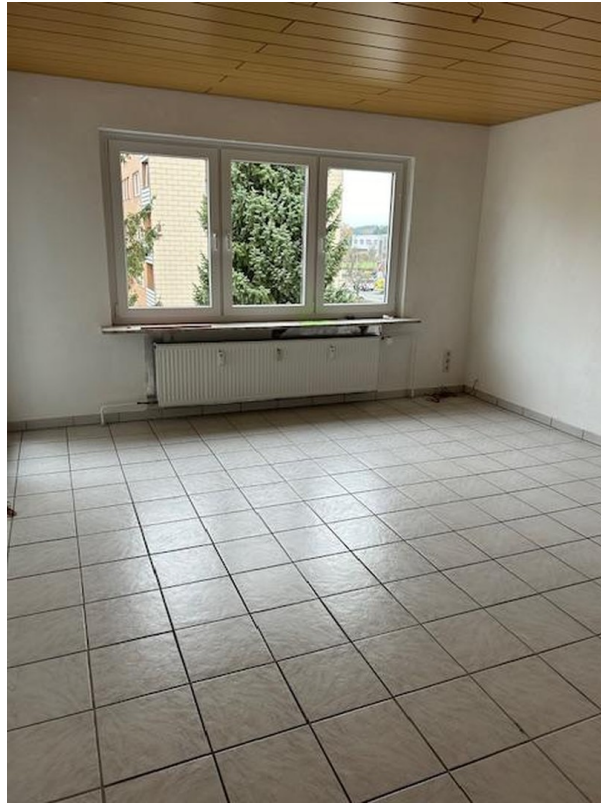
Wohnzimmer Sicht 1