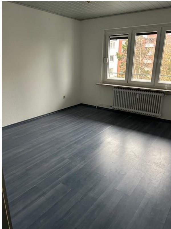
Schlafzimmer 1 Sicht 2