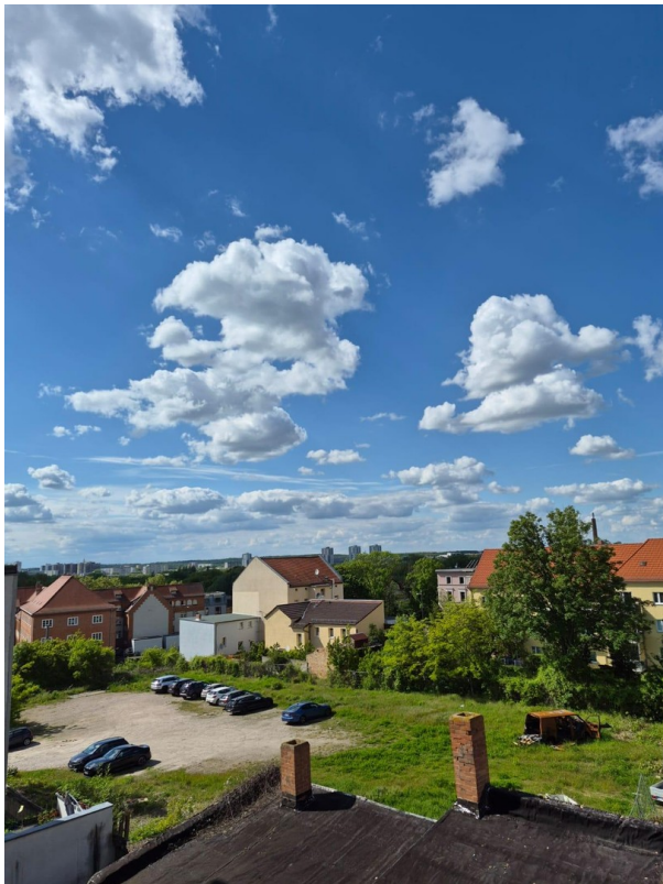
Blick aus Schlafzimmer / Küche