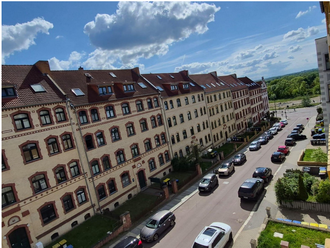
Blick aus dem Wohnzimmer