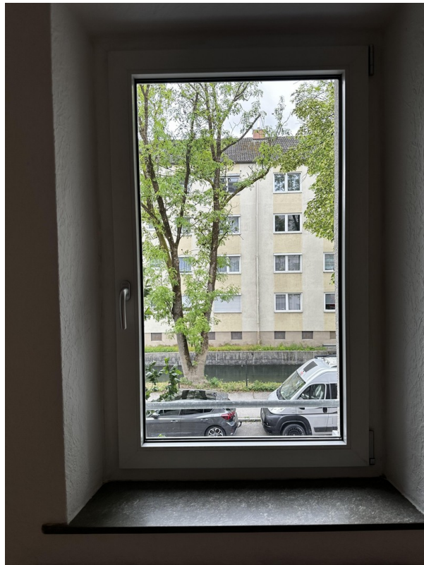
Blick aus dem WZ