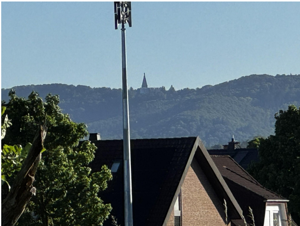
Blick auf den Herkules