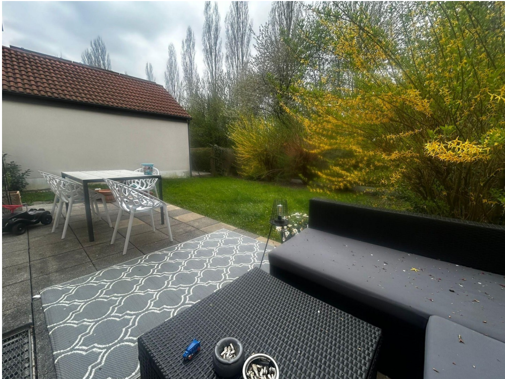
Terrasse mit Garten