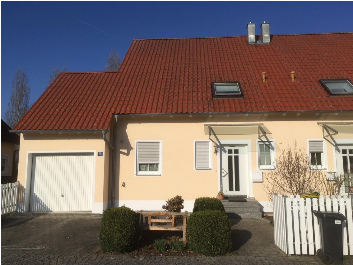
Außenansicht linke Hälfte