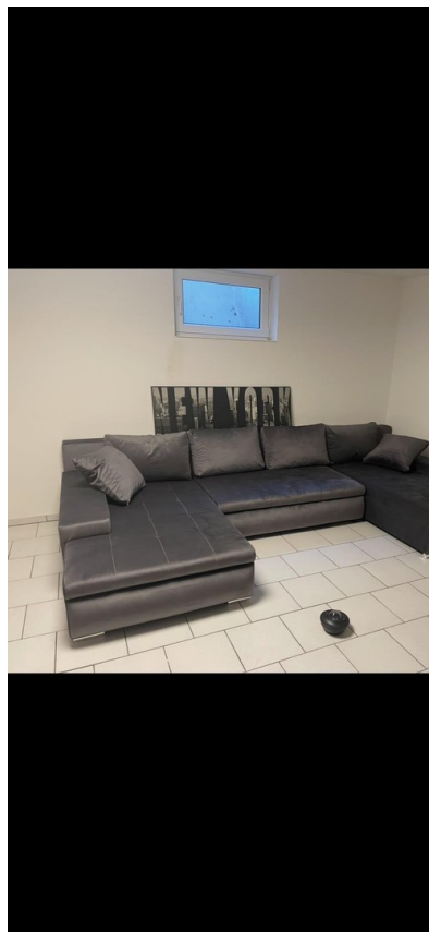
Zimmer im Keller