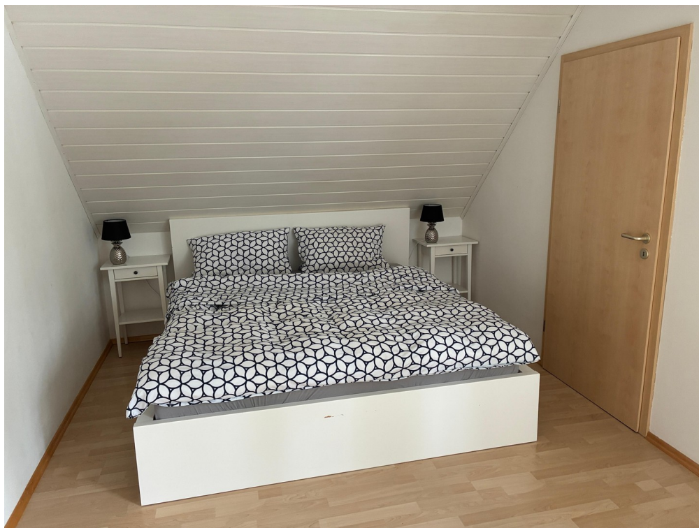
Schlafzimmer Tür zur Ankleide