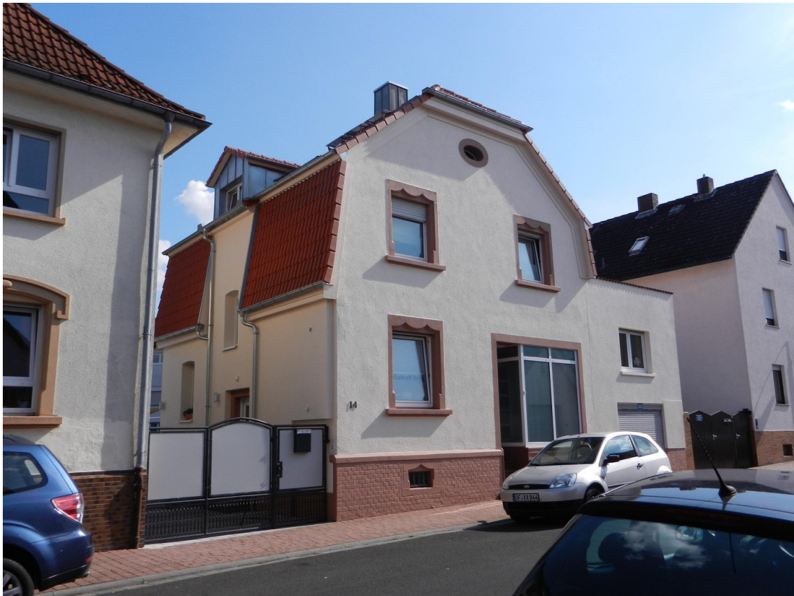
Straßenseite nach Westen