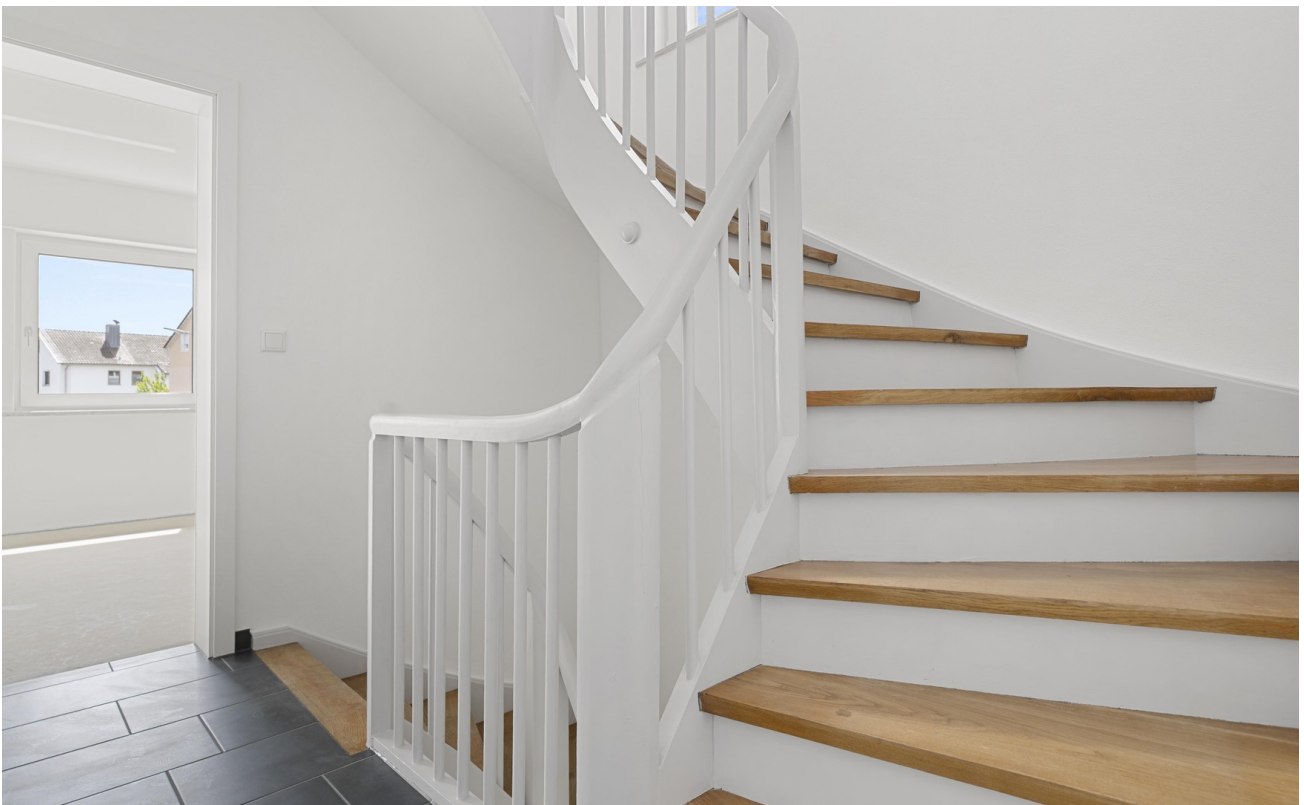
Treppe ins DG