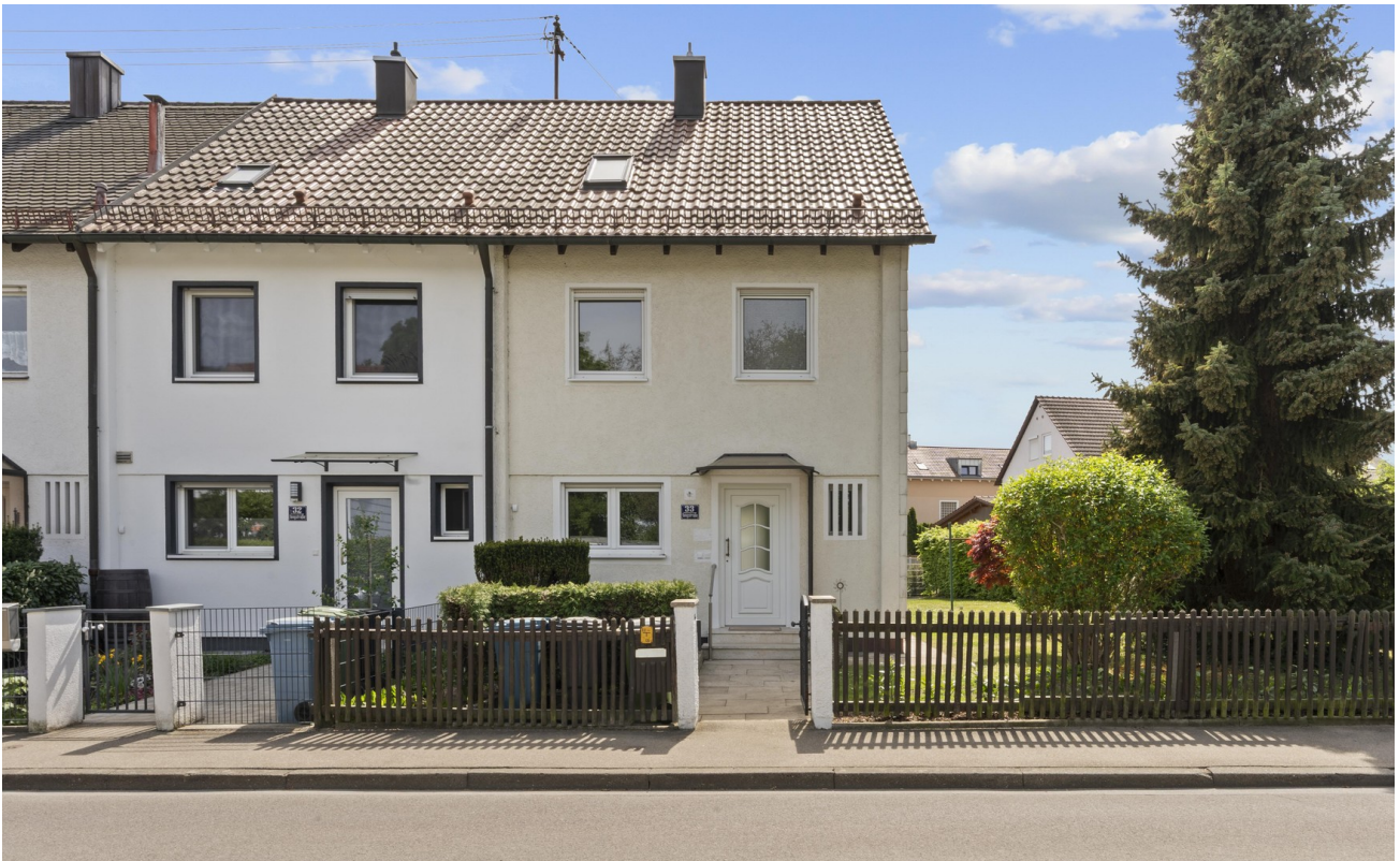
Hausansicht mit Garten