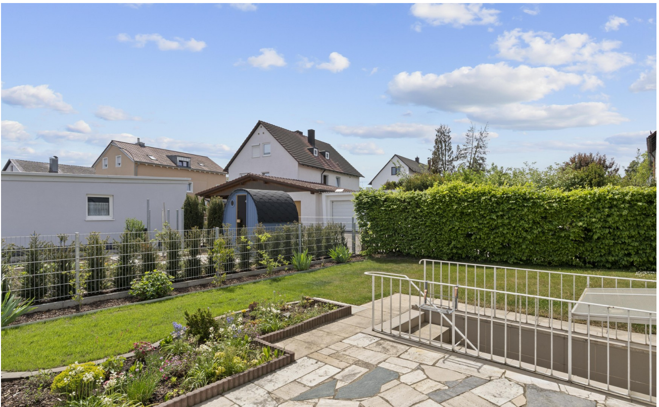
Gartensicht Terrasse / Süden