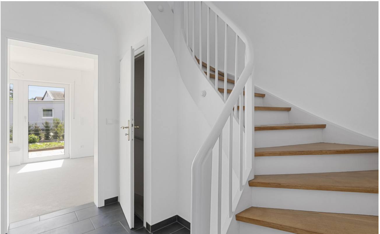
Treppe ins OG