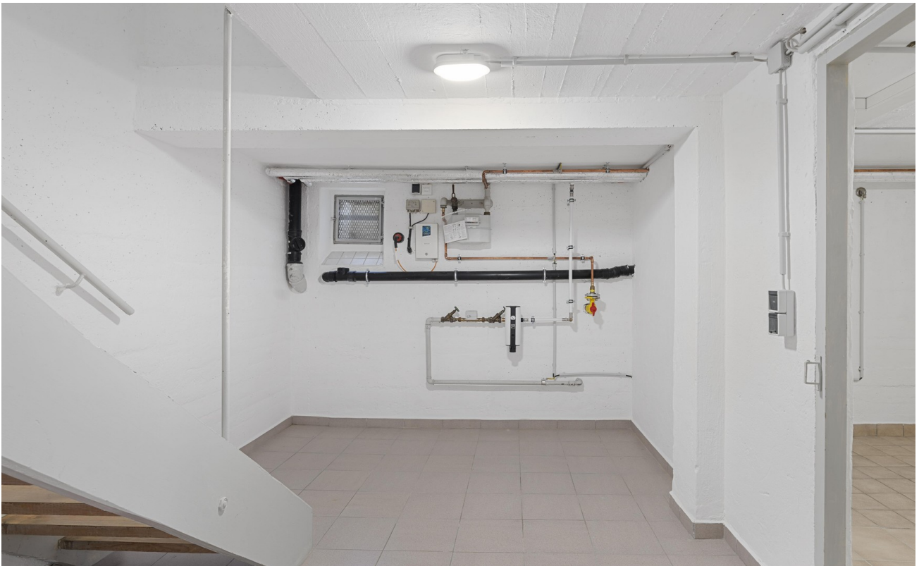
Kellerflur & Waschküche