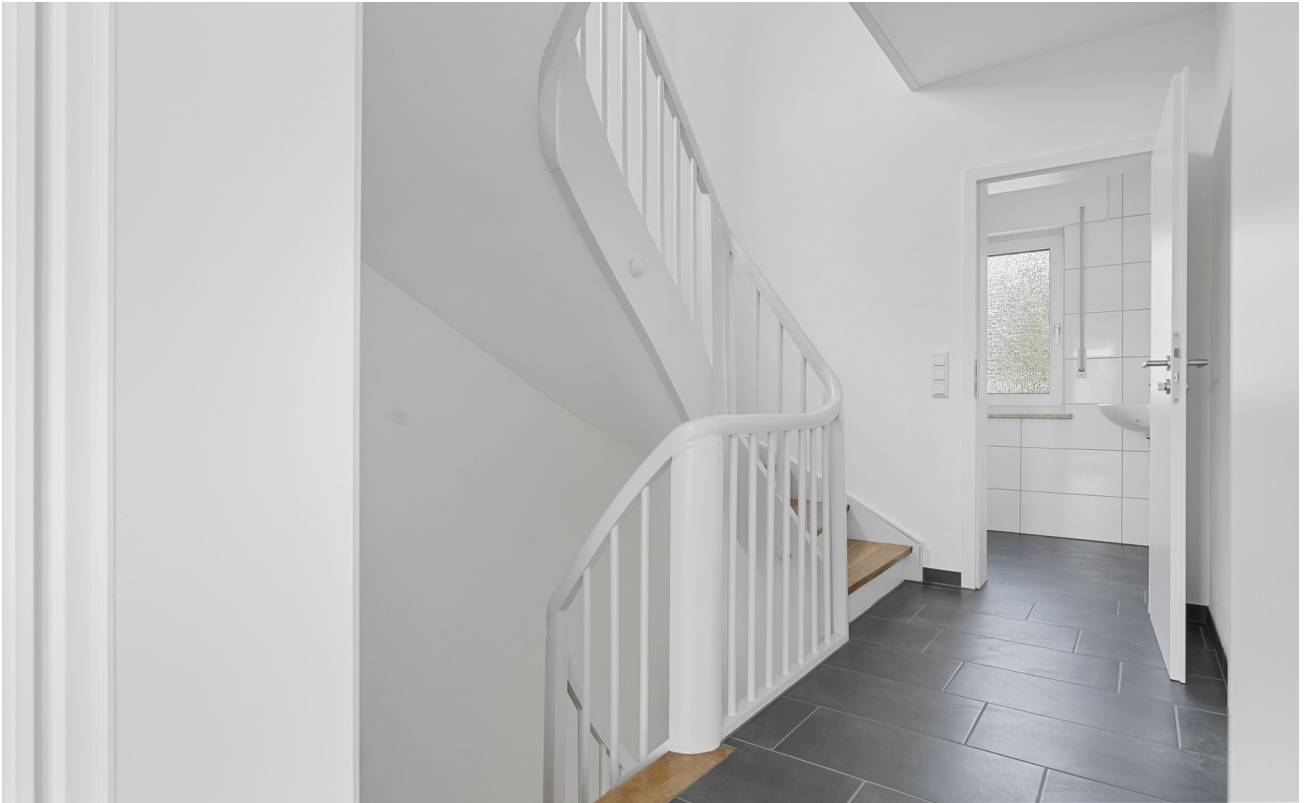
OG Flur mit Blick zum Bad