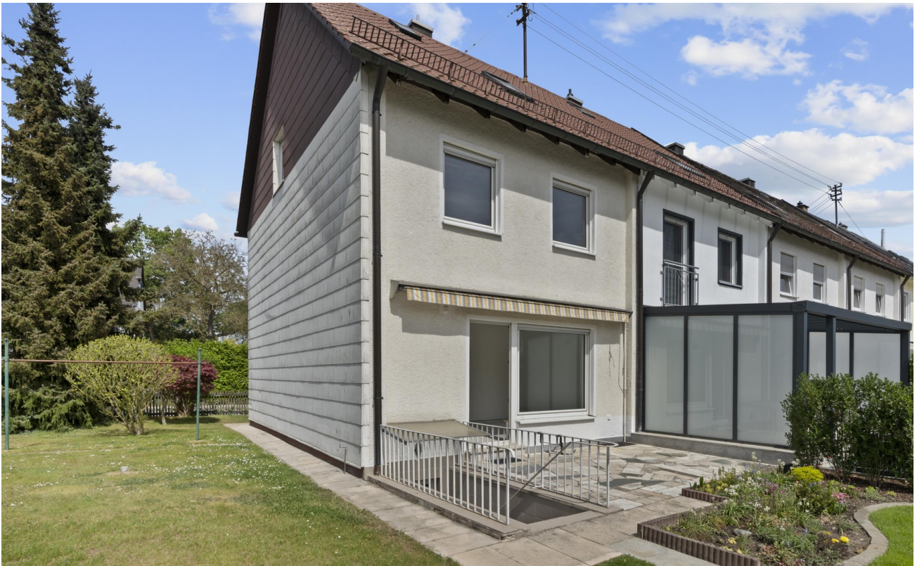
Südseite mit Garten