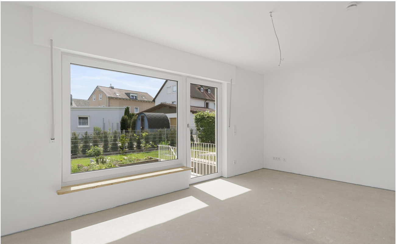
Wohnzimmer mit Gartenblick