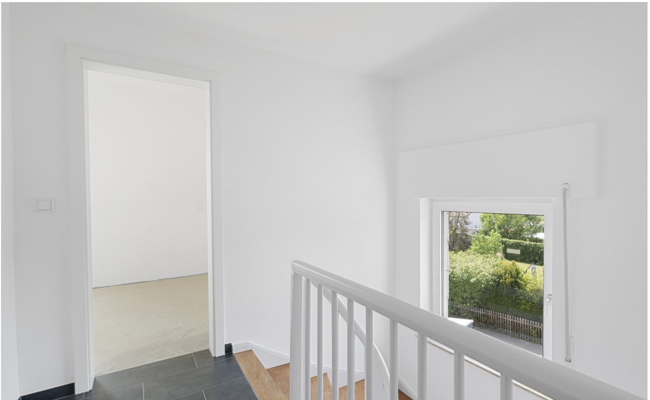
heller DG Flur