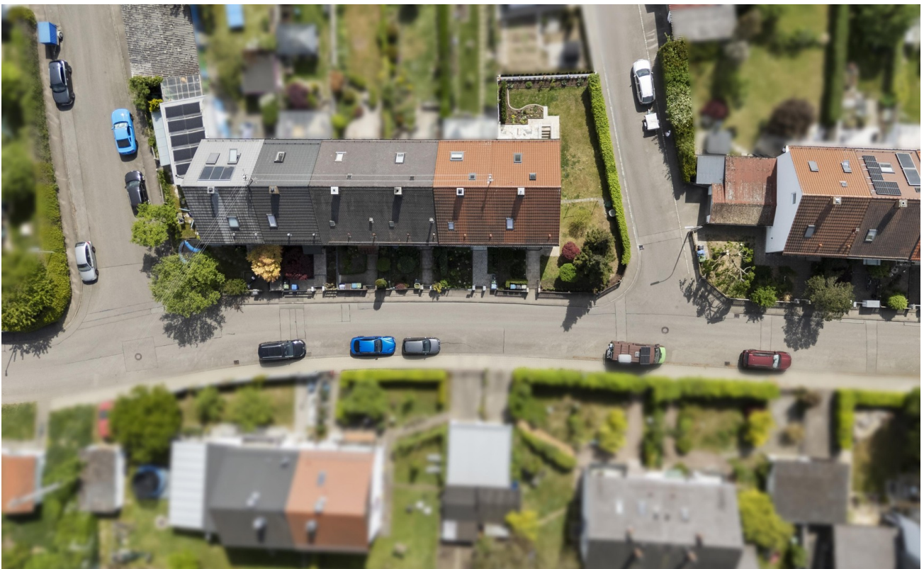
Blick auf das Grundstück