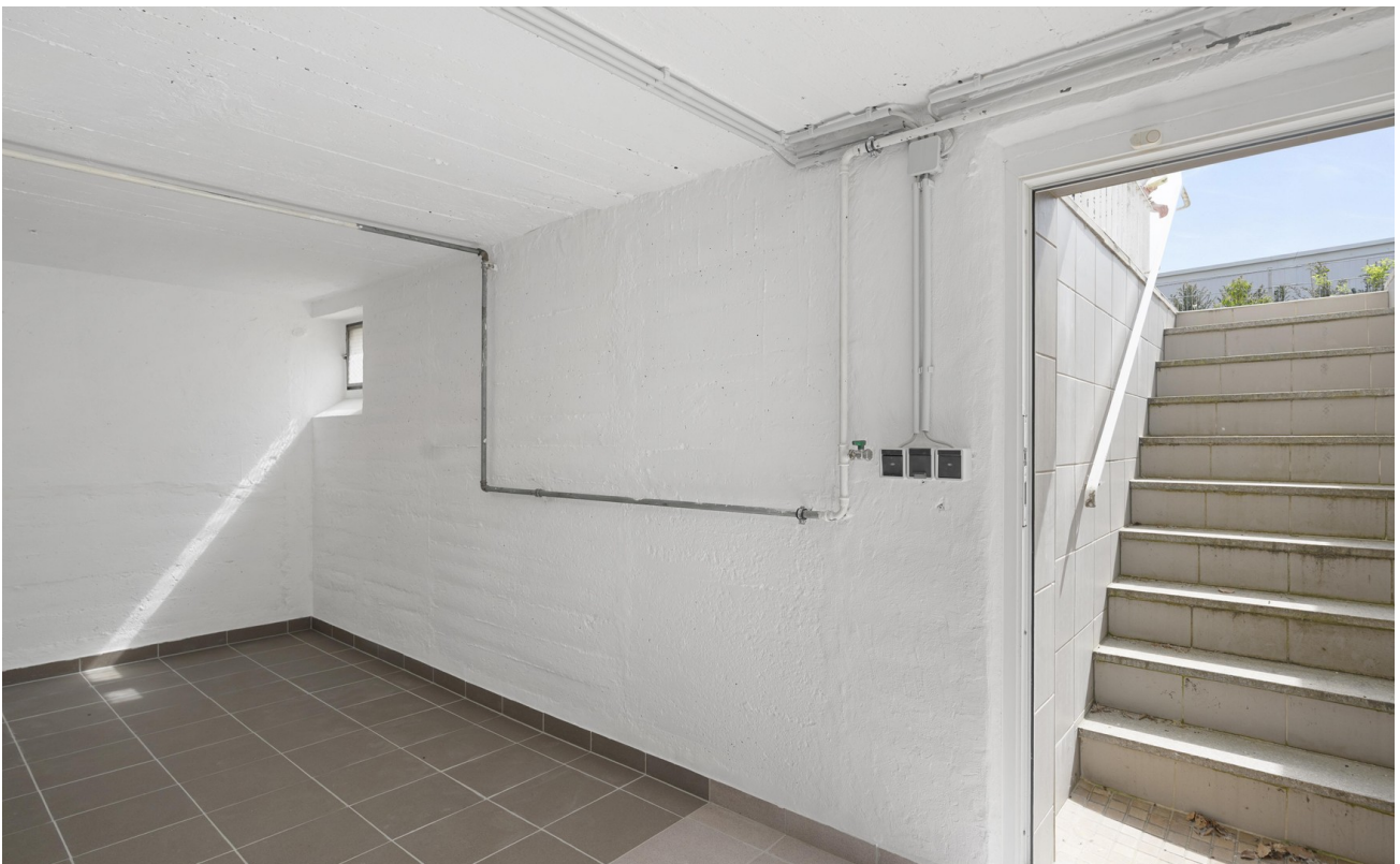
Außentreppe in den Garten