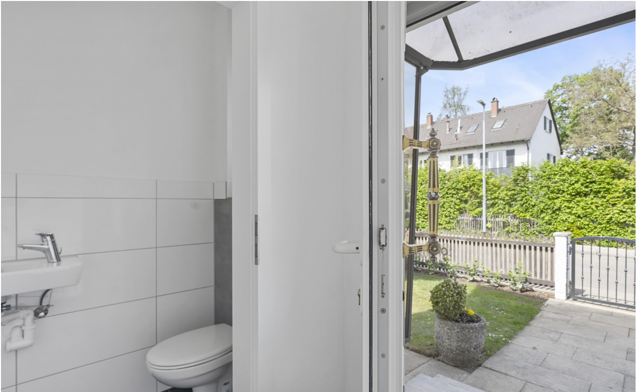
Eingang und Gäste-WC