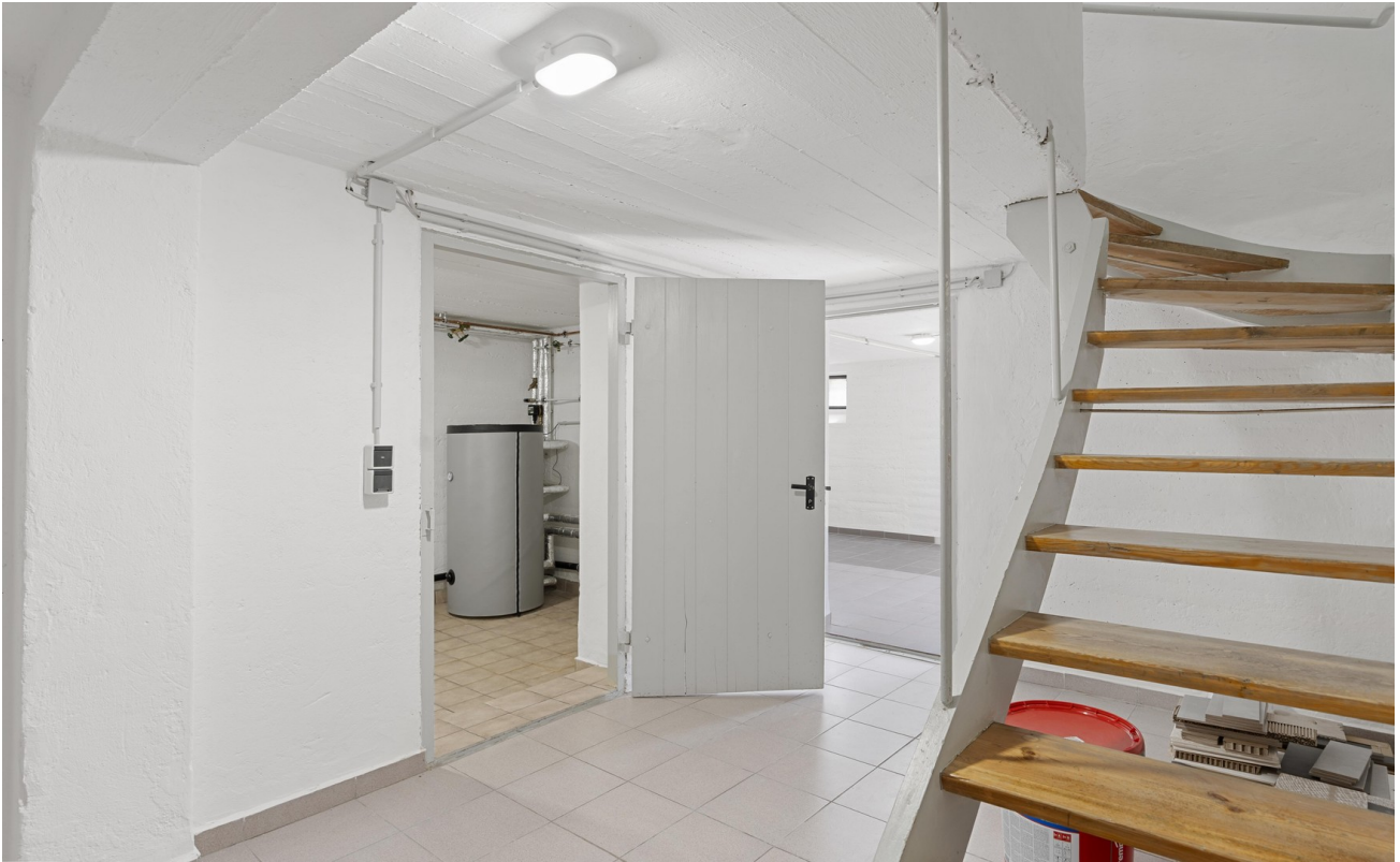
Kellerflur & Waschküche