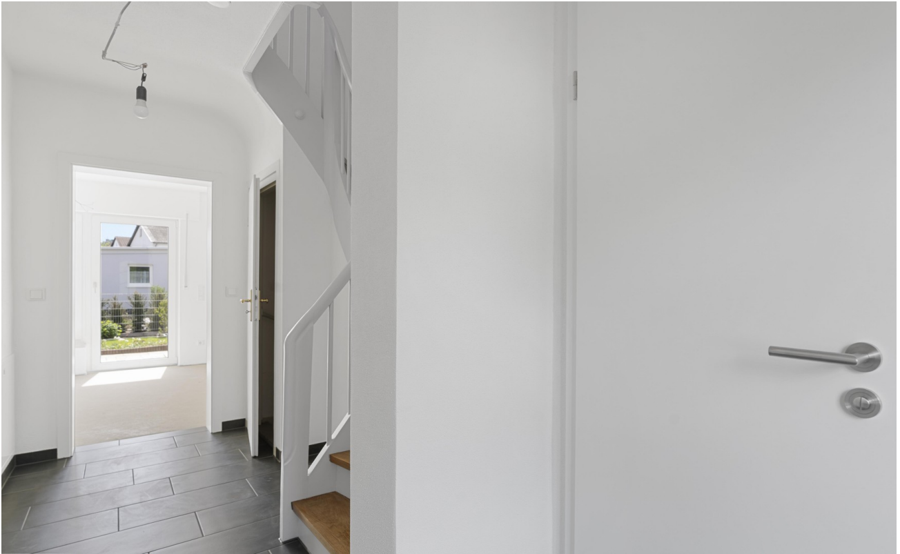
EG Flur - Blick zum WZ