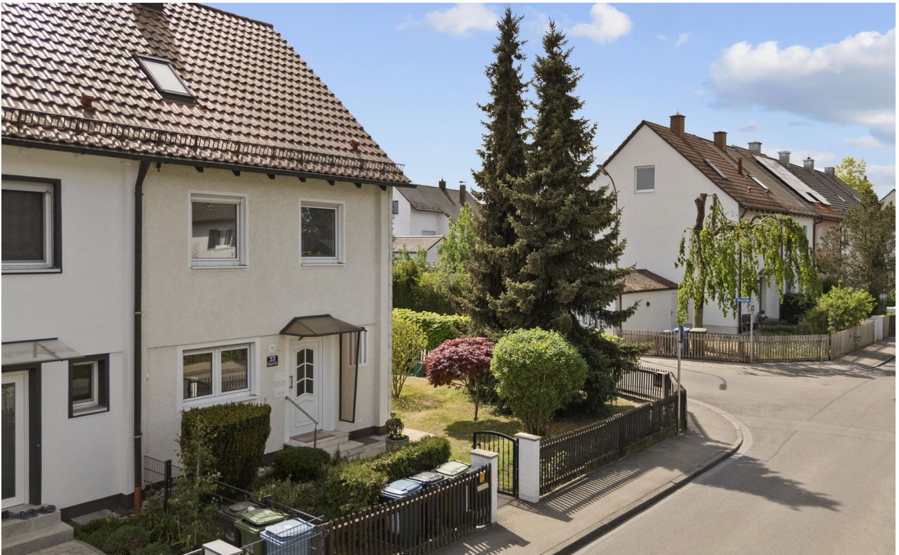
Hausansicht mit Garten