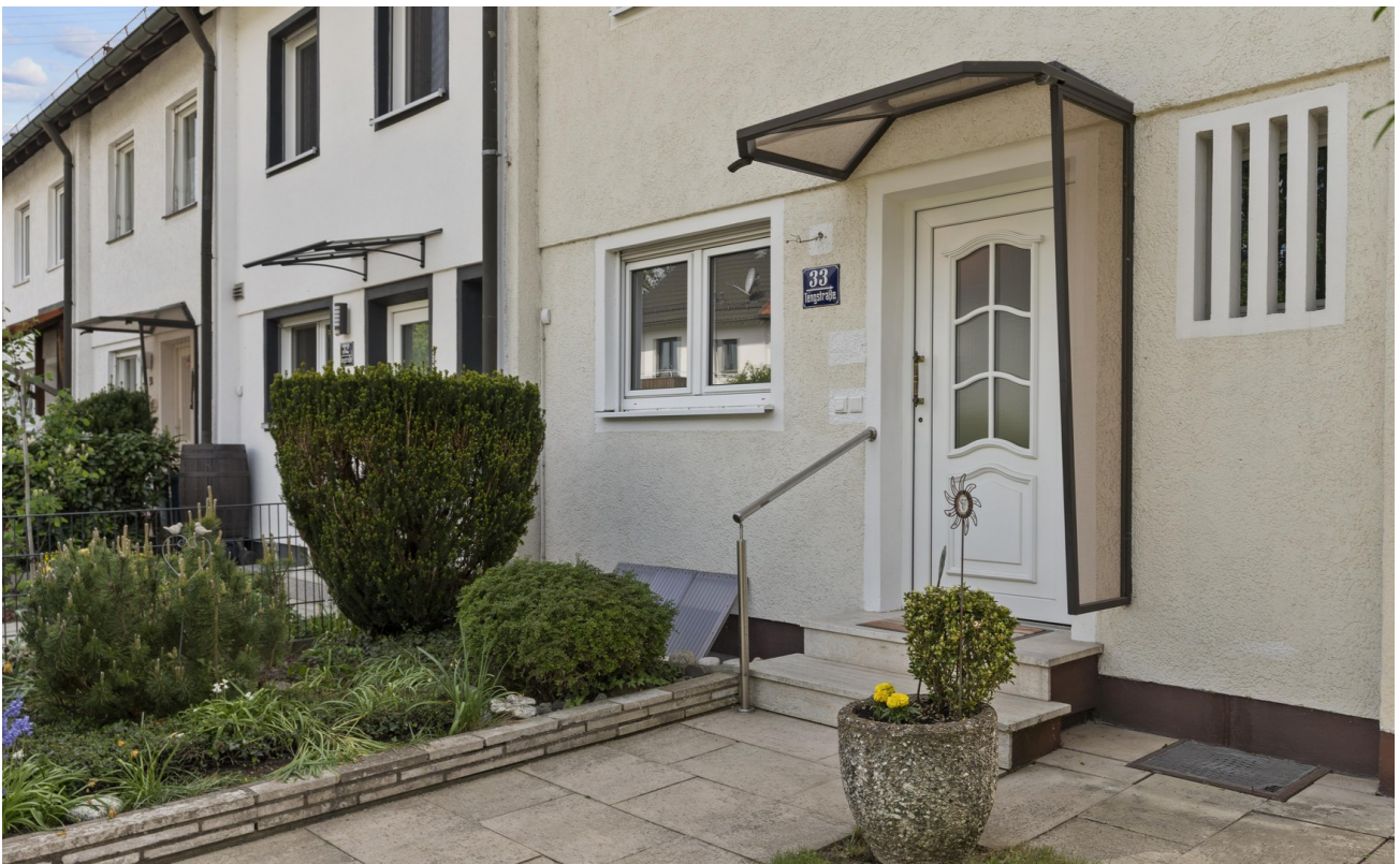
Eingangsbereich mit Vorgarten