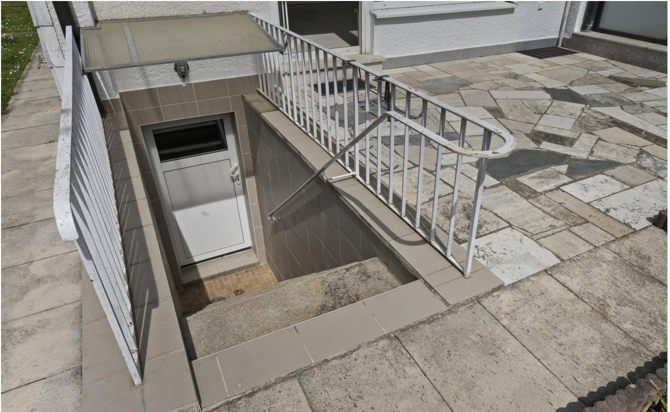
Terrasse mit Kellertreppe