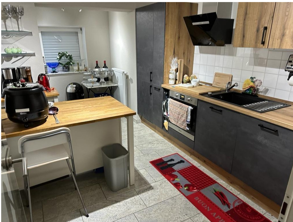
UG 2 Küche rechte Seite