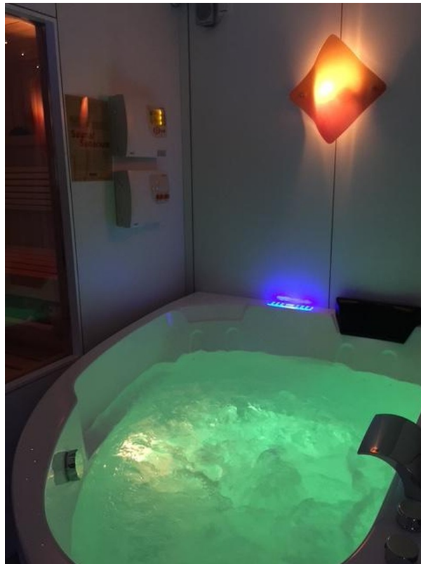
UG 2 Wellness - Whirlpool