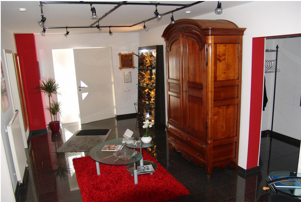
Foyer Eingang UG 1