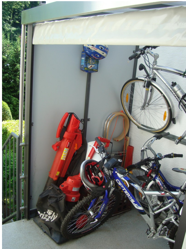
Abstellraum hinter F-Garage