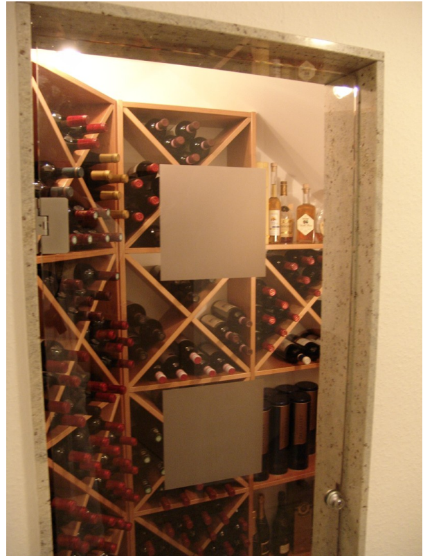
UG 2 Weinregal