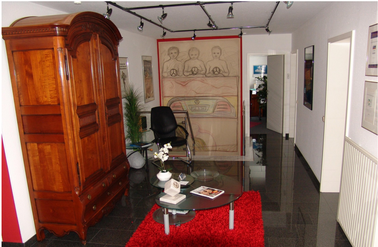
Foyer Eingang UG 1