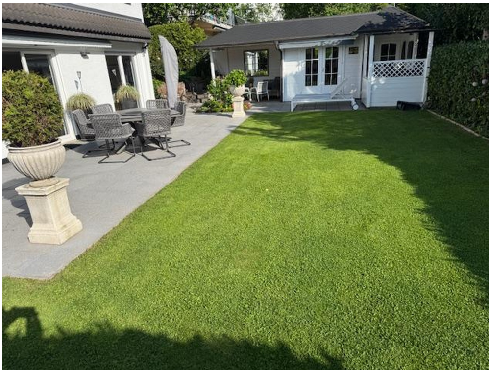
UG 2 Gartenterrasse