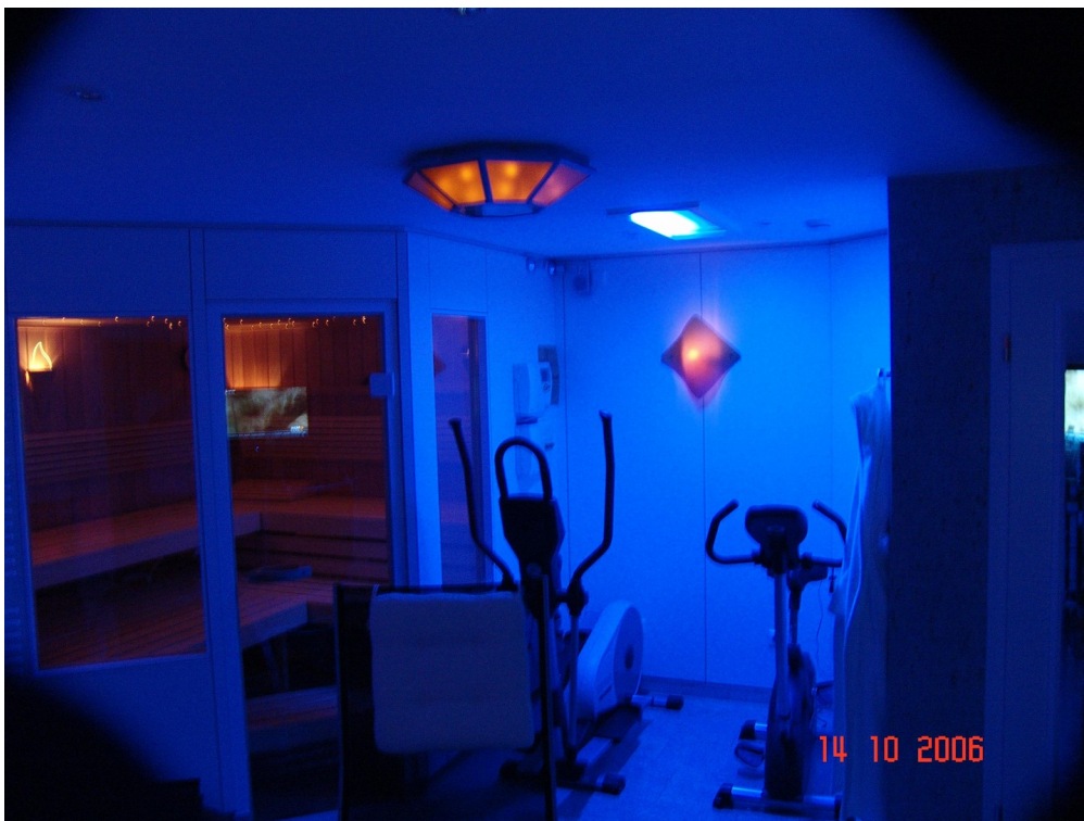
UG 2 Wellnessraum