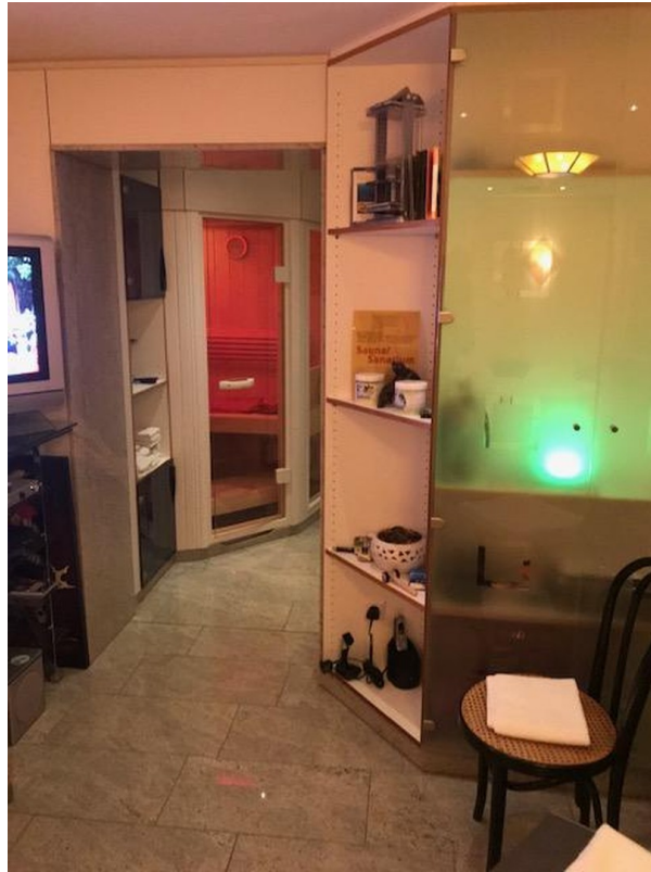
UG 2 Wellnessraum