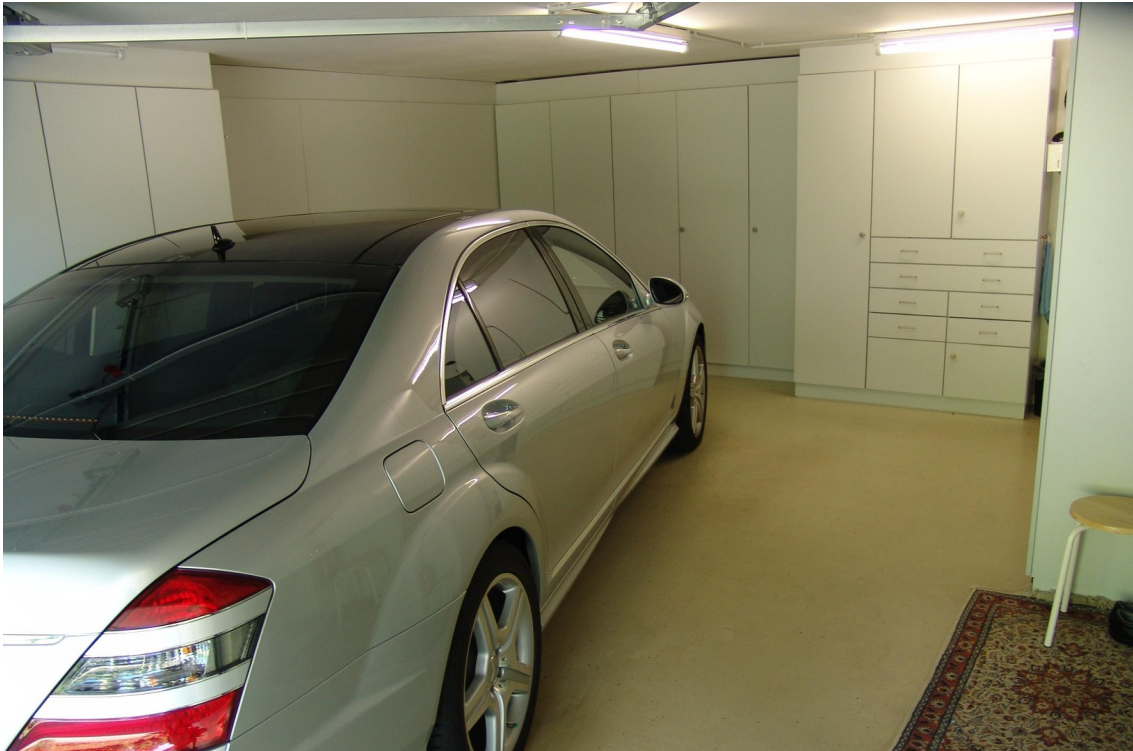
Garage im Haus