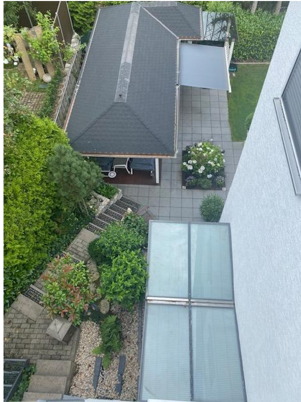
Gartentreppe zur Fertiggara