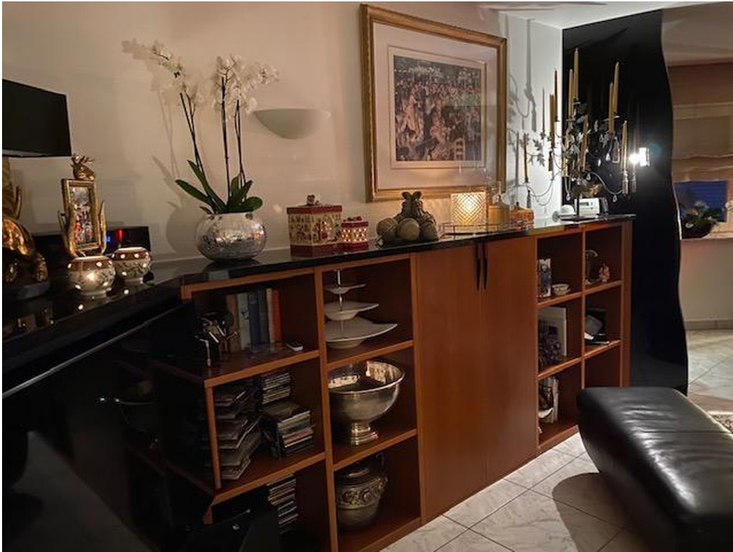
EG - Wohnz. Sideboard