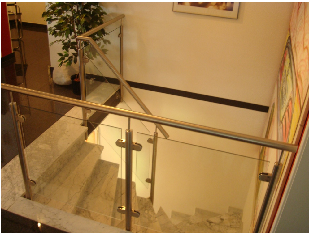
UG 1 Treppe zum UG 2