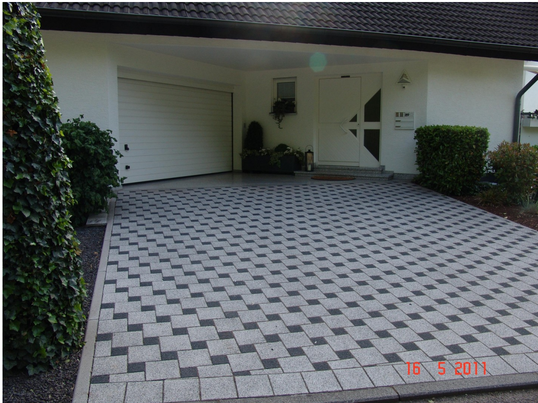
EG Einfahrt u. Eingang