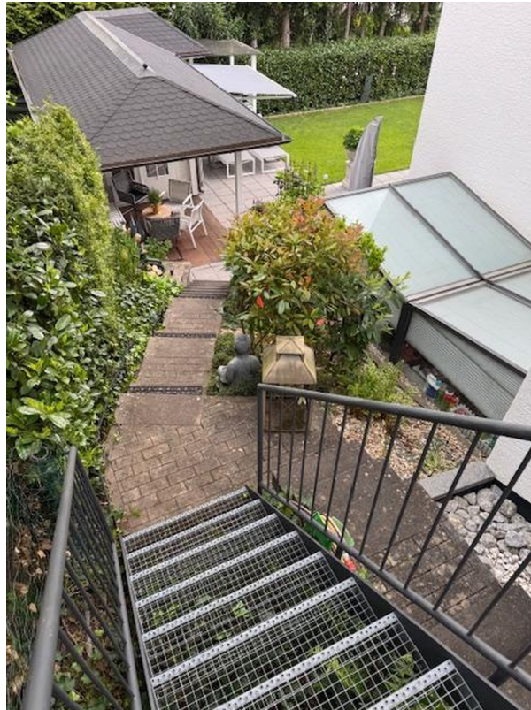
Treppe v. Fertiggarage