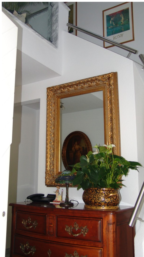
Treppe zum DG