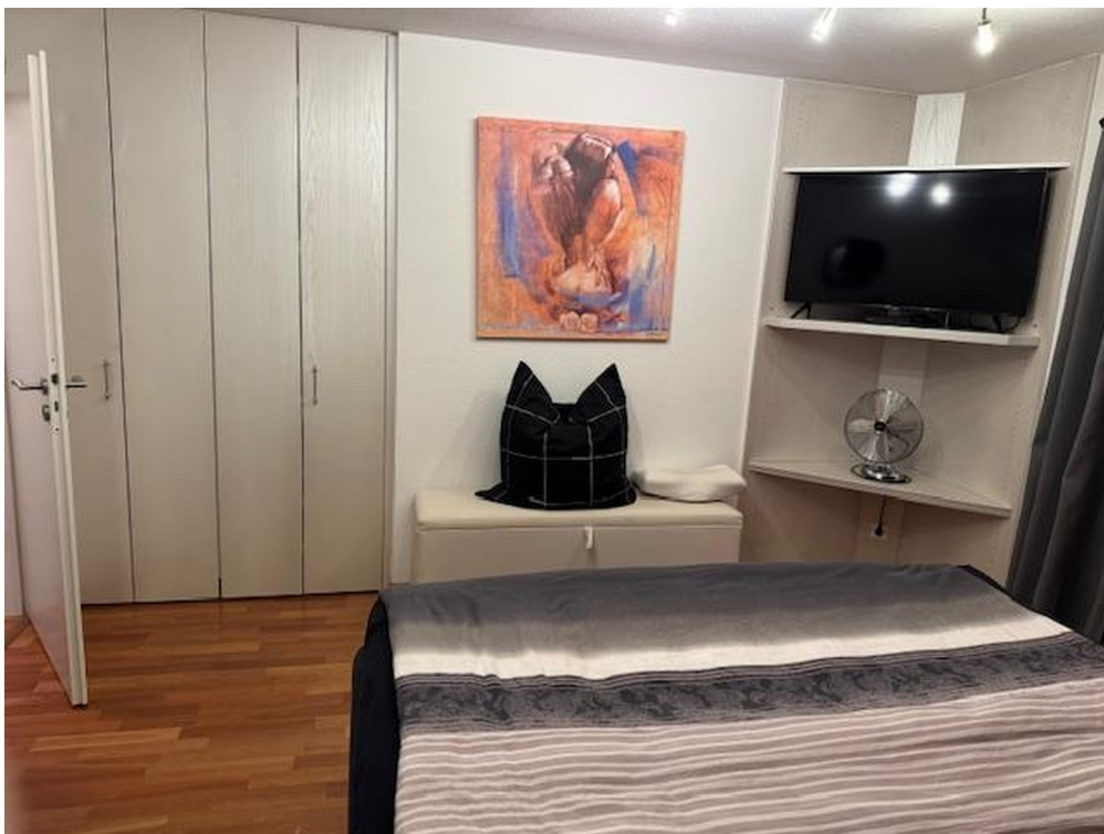
DG- Gästezimmer Wohn. № 2