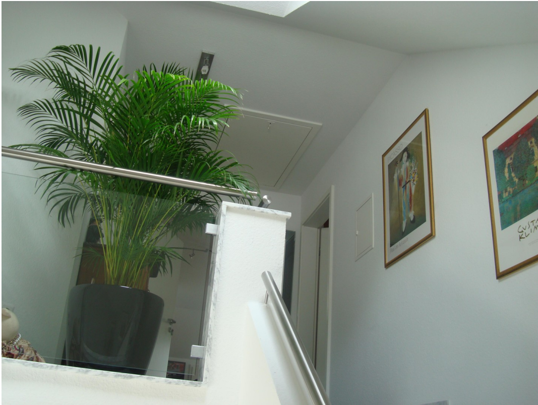
EG Aufgang zum DG