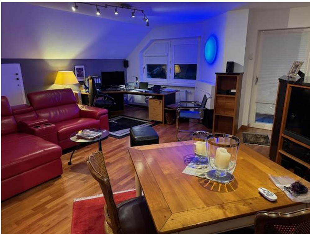
DG - Studio