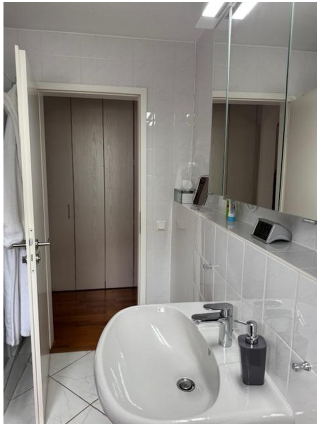
DG- Bad/WC +Dusche