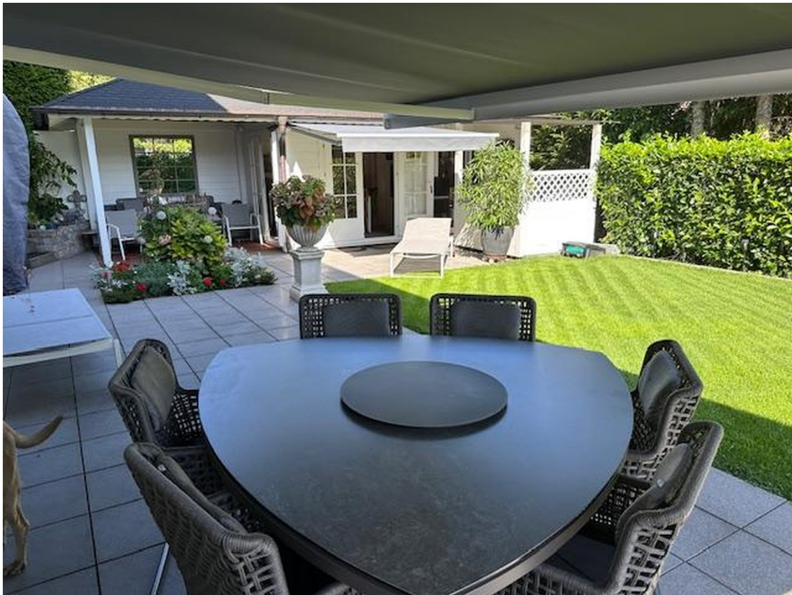
Garten UG 2