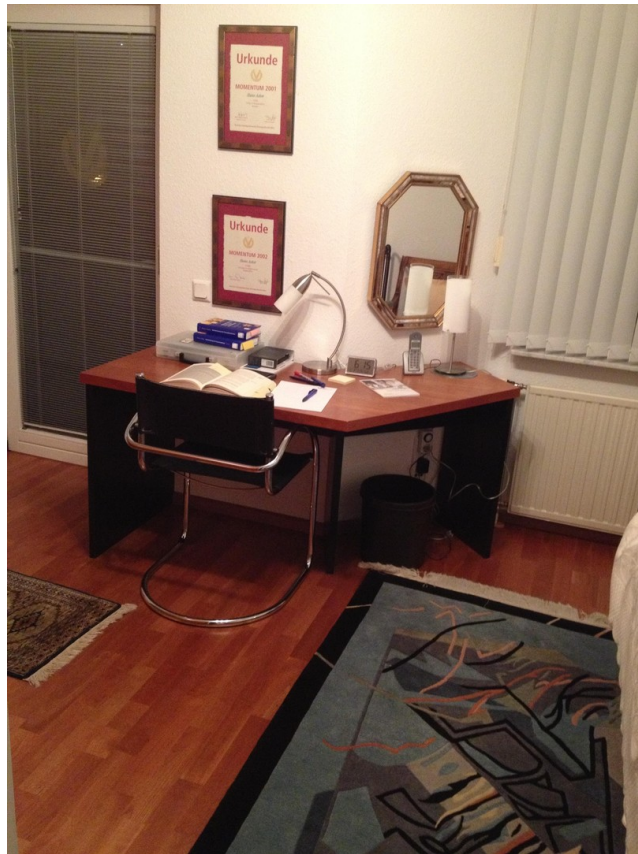
DG- Gästezimmer Wohn. № 3