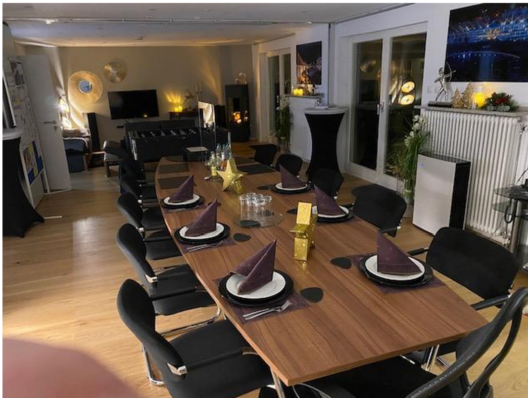
UG 2 Großer Raum