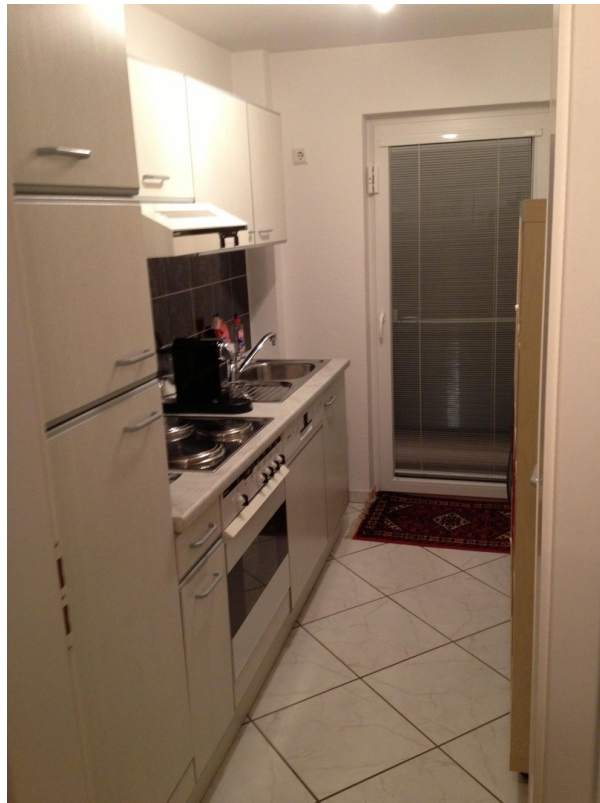
DG- Küche+ Ausg. D-Terrasse