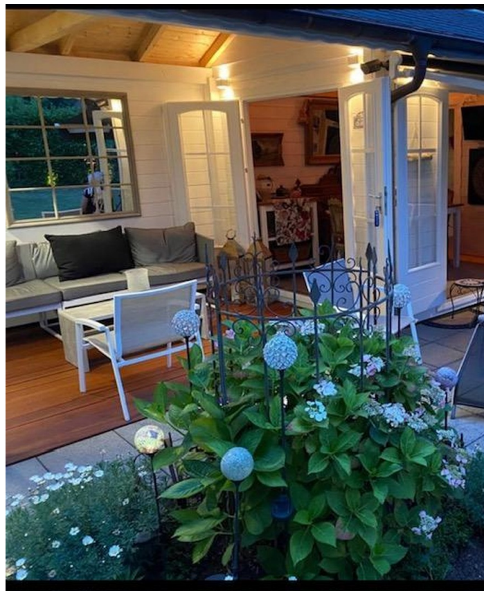
Überdachter Freisitz i. Garten