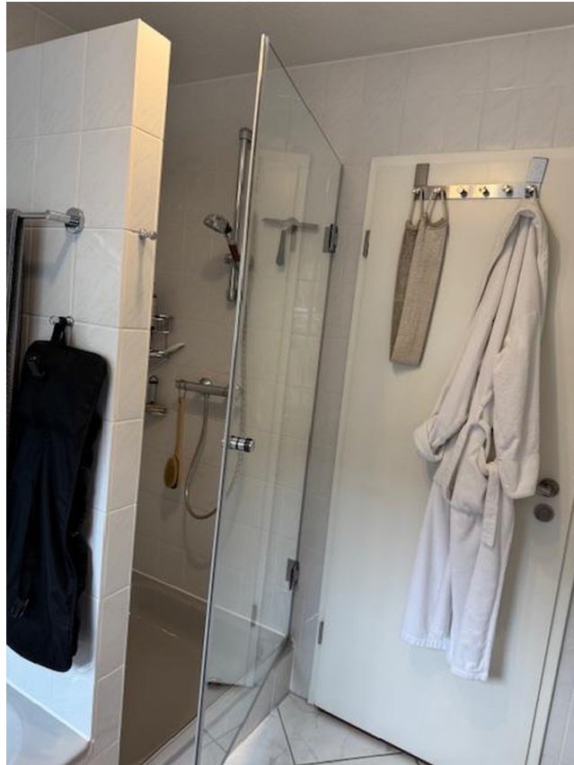
DG- Bad/WC +Dusche