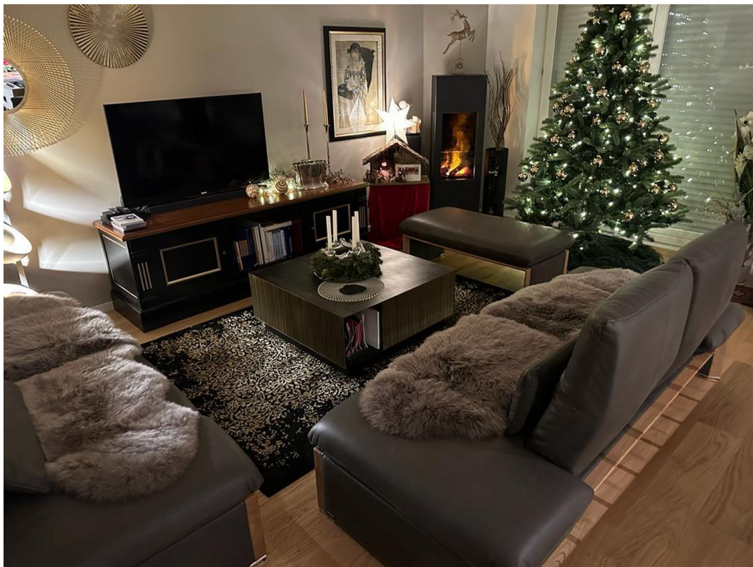
UG 2 Lounge