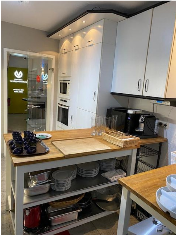
UG 2 Küche linke Seite