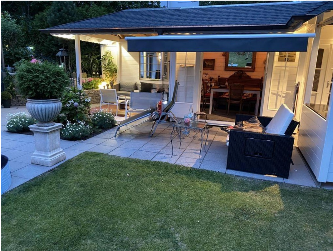
Gartenhaus mit Freisitz