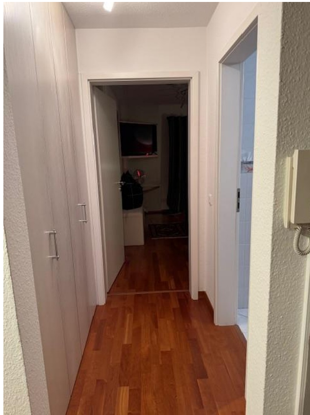
DG- Flur z.um Schlafz. u. Bad