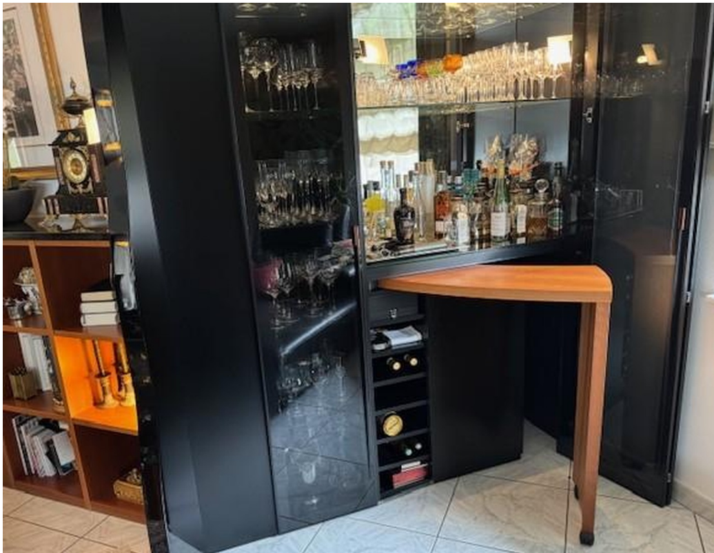
EG - Wohnz. Barschrank