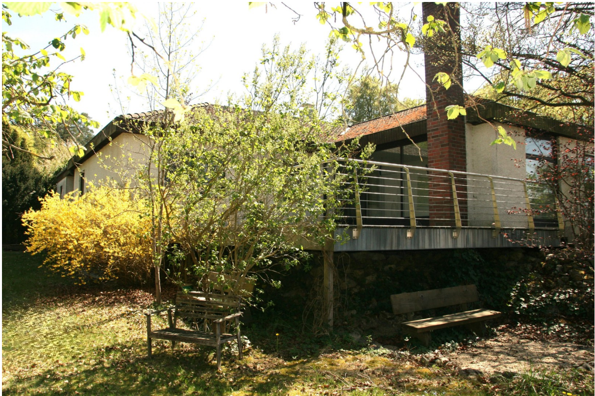
Aussen mit Terrasse