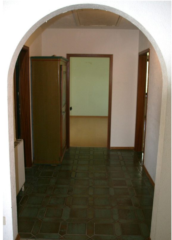
Zugang Zimmer OG