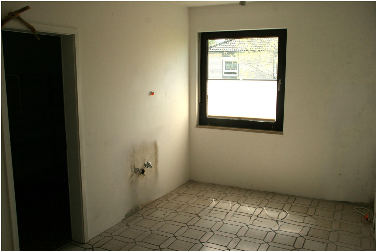
Küche mit Zugang Speis