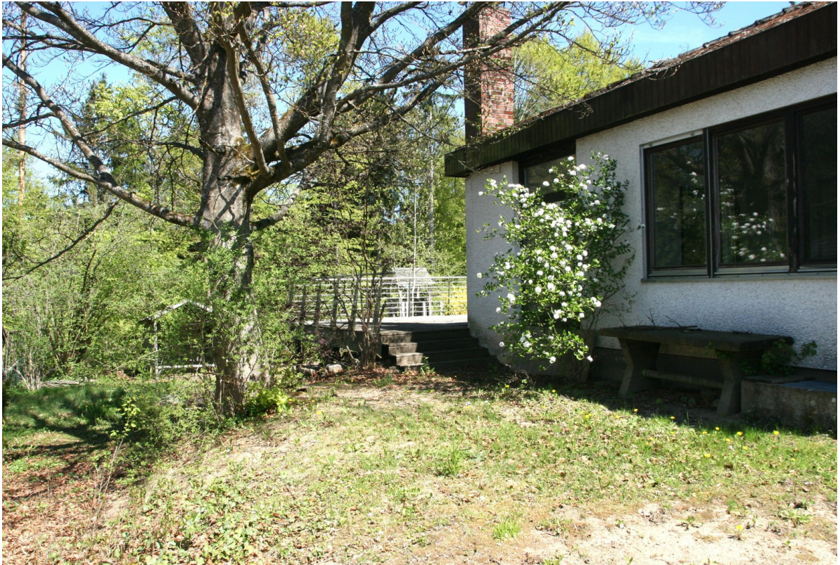
Aussen Zugang Terrasse