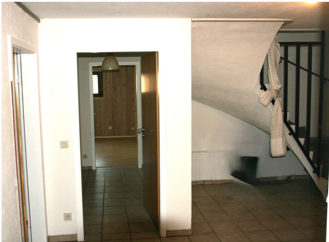
Keller Zugang Zimmer