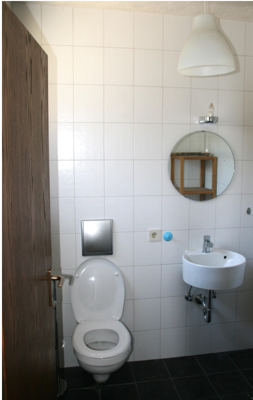
Gäste WC OG