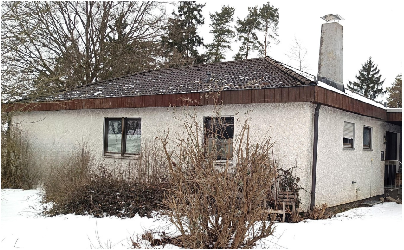
Aussen mit Garage