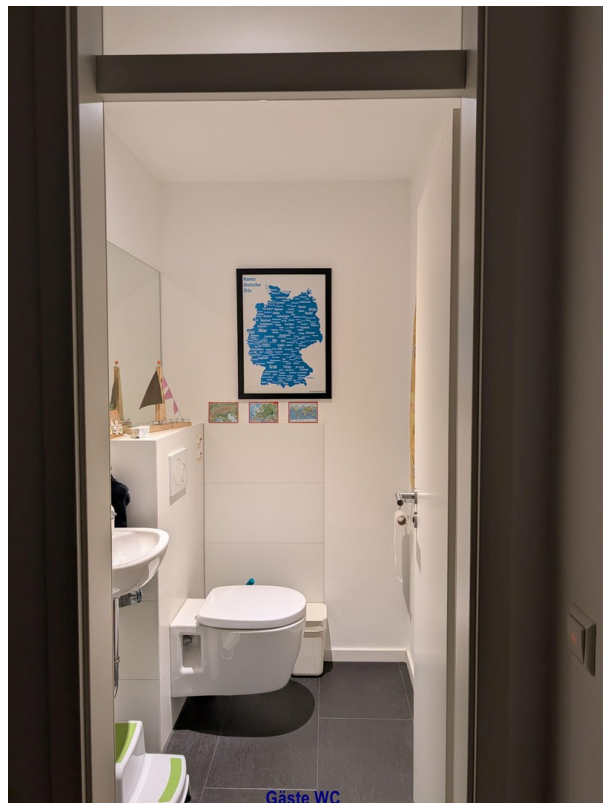
Gäste WC Gäste WC