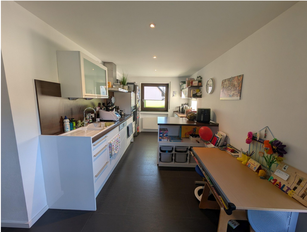
Küche mit Essen