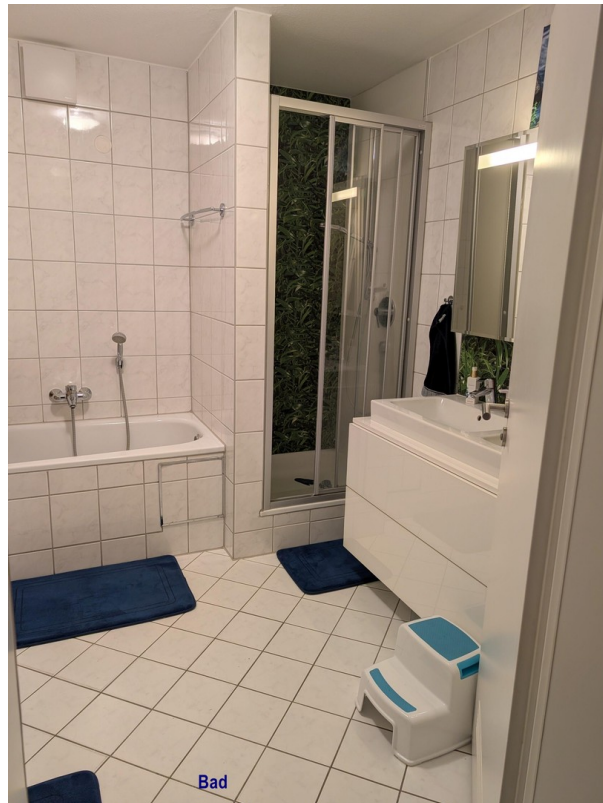
Bad mit Dusche und WC