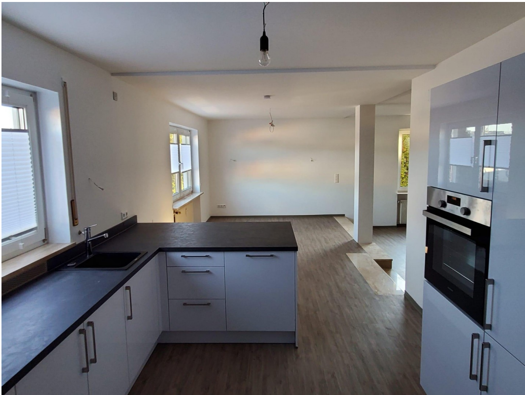
Küche / Essbereich