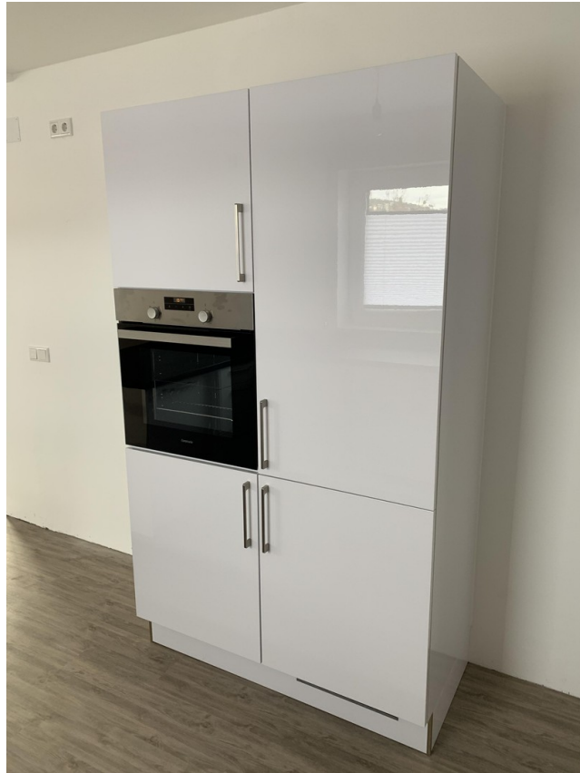
Kühlschrank / Ofen