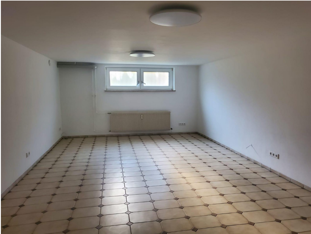
Büroraum separat zugänglich