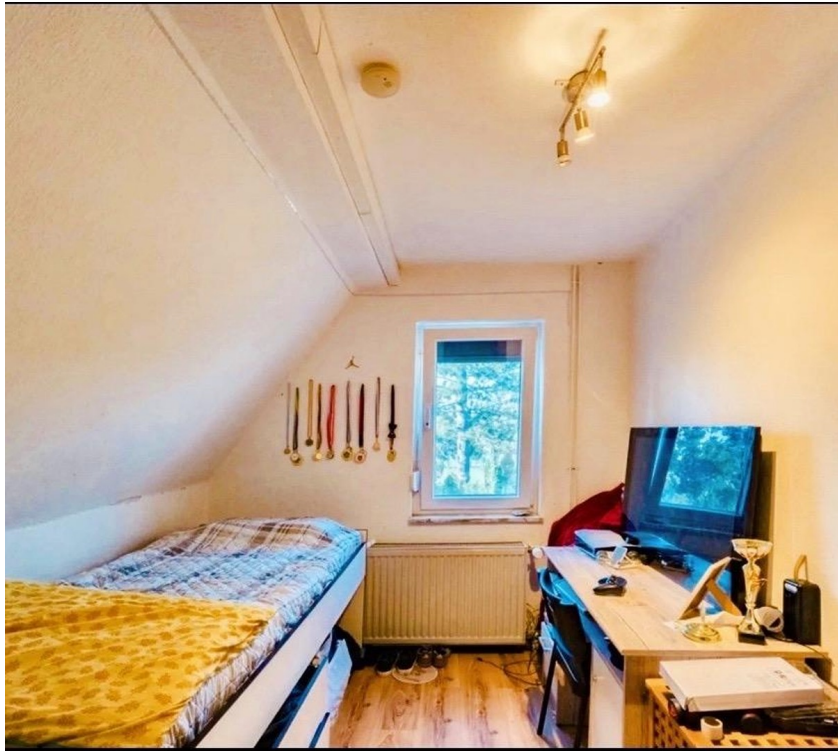
Schlaf- Durchgangszimmer OG