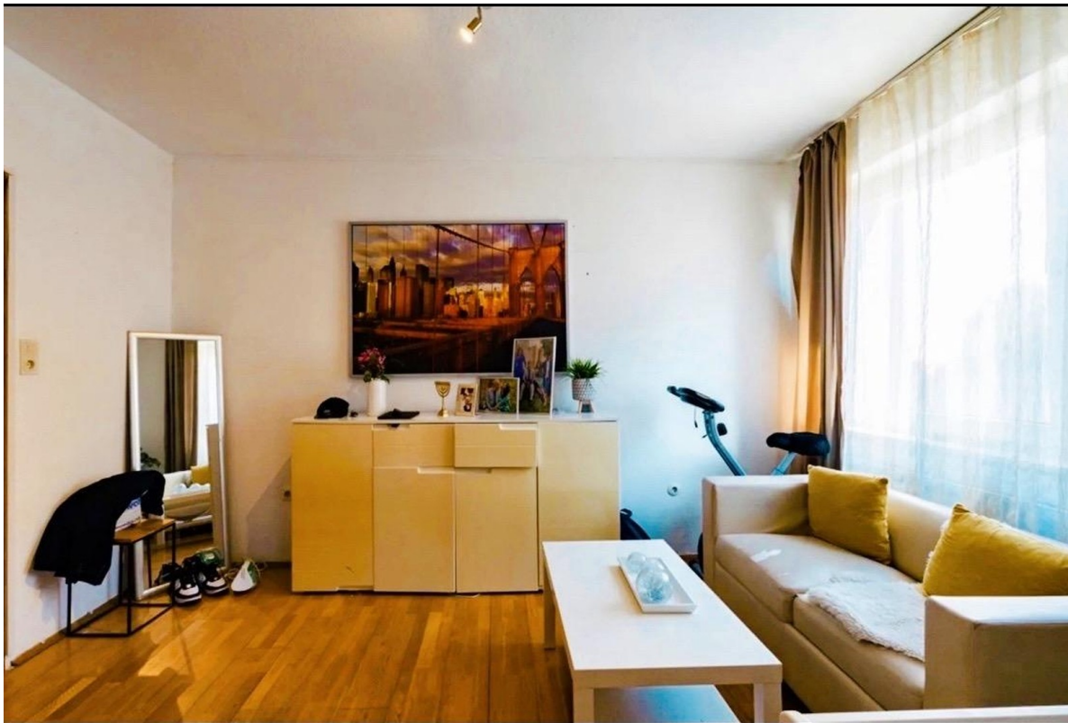
Wohnbereich mit Charakter