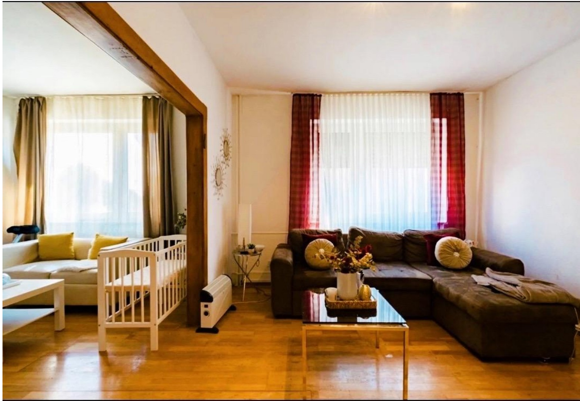
Wohnbereich mit Charakter