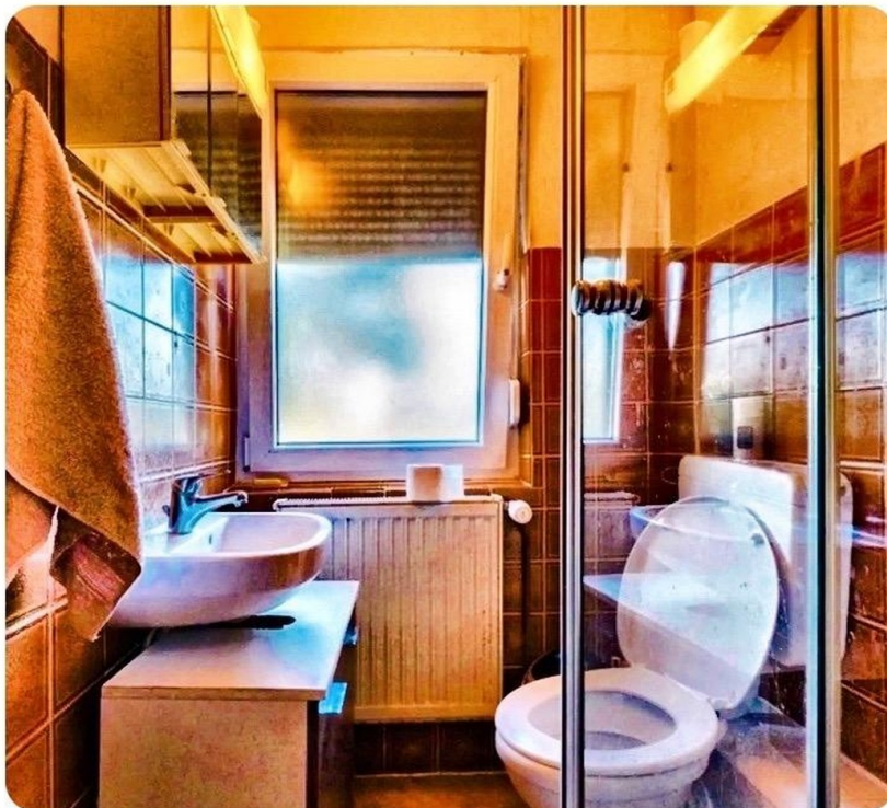
Duschbad im OG