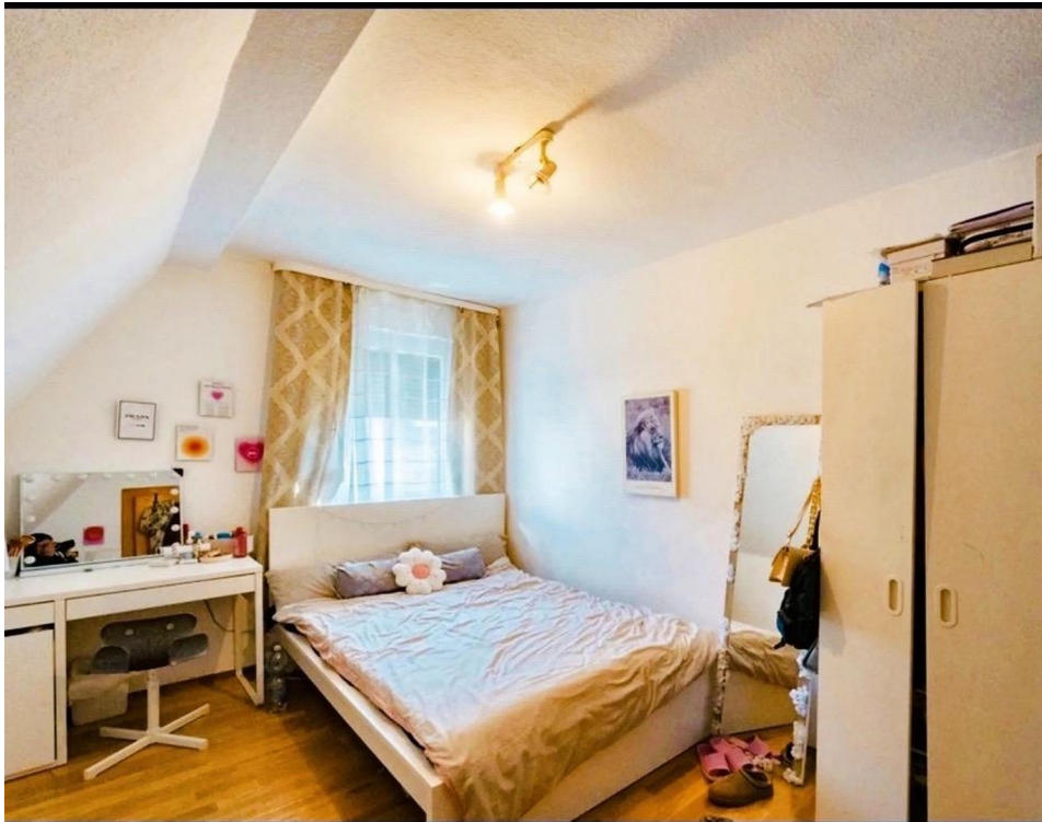
Schlafzimmer 2 Obergeschoss