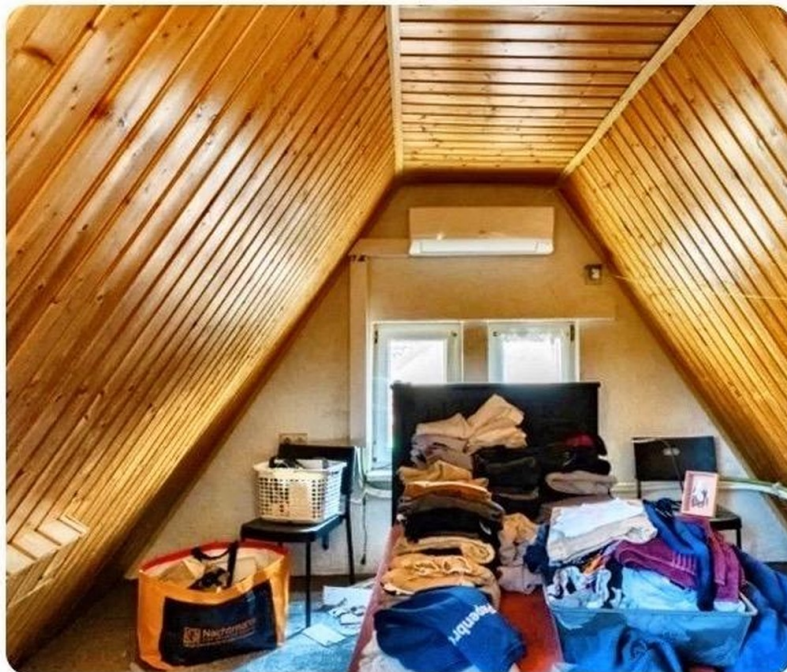
Zusätz m2 im Spitzboden m AC