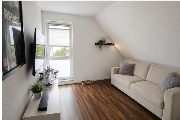
1.OG / Schalfzimmer