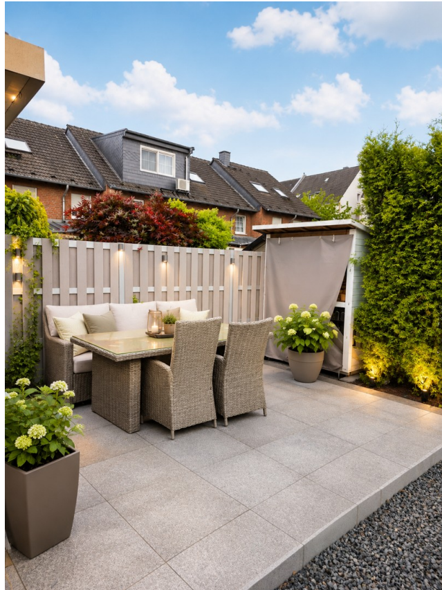
Terrasse neben der Gartenhütte