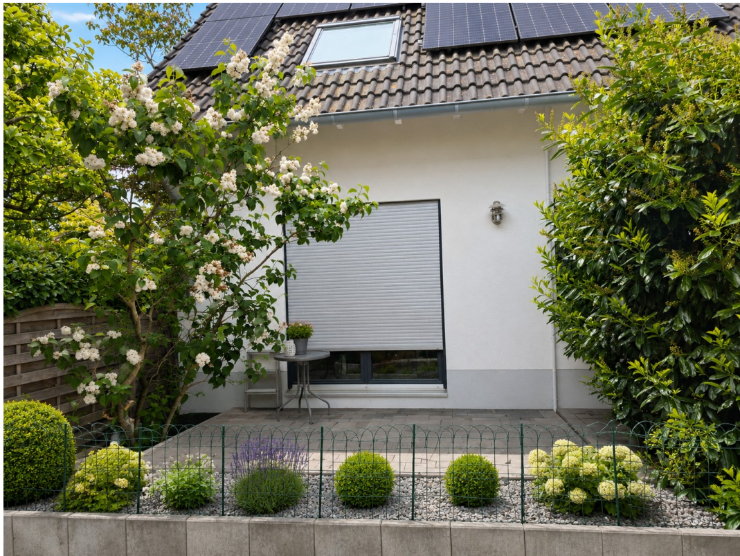
3.Terrasse an der Küche