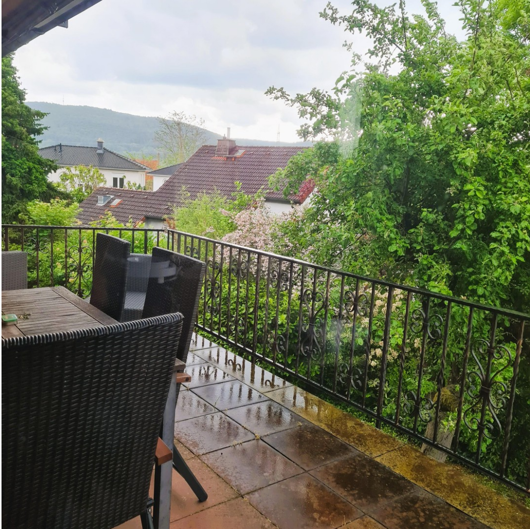
Balkon mit Blick über Alzenau