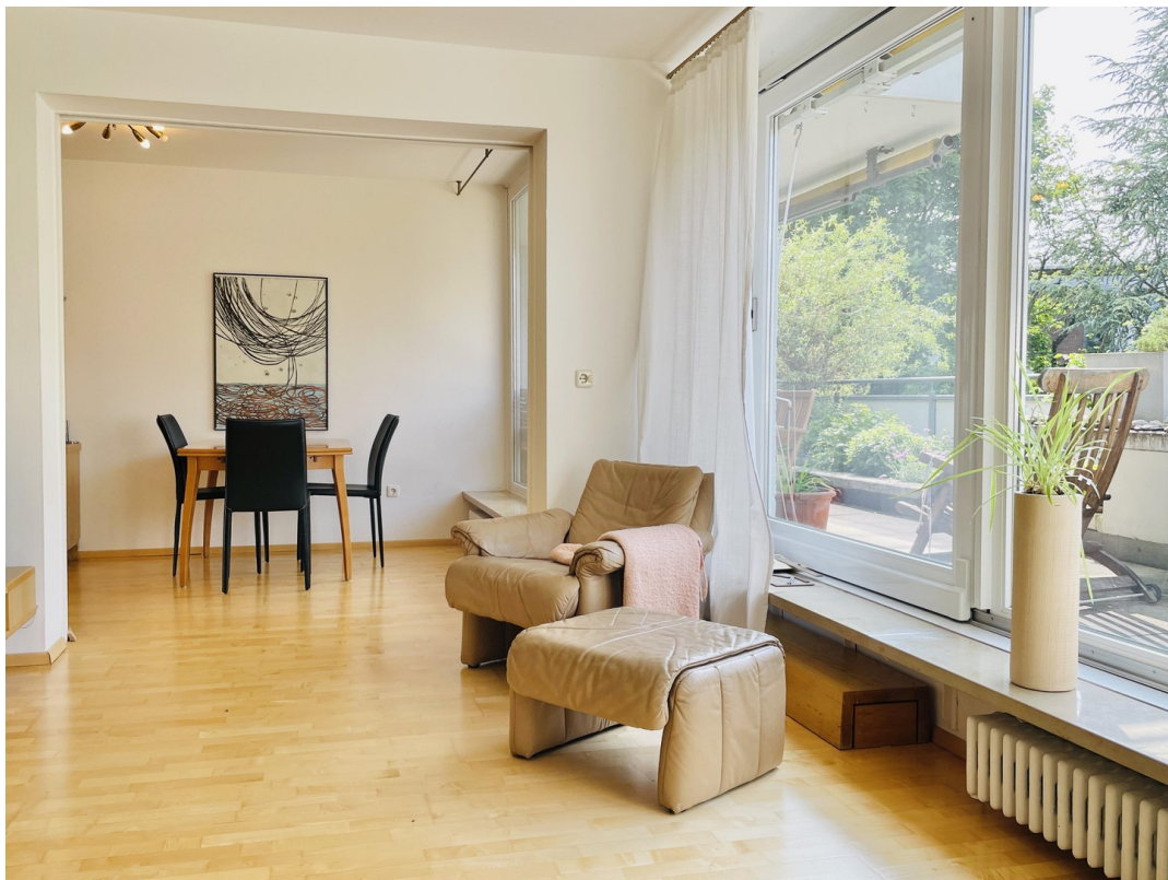
Durchgang zum Esszimmer