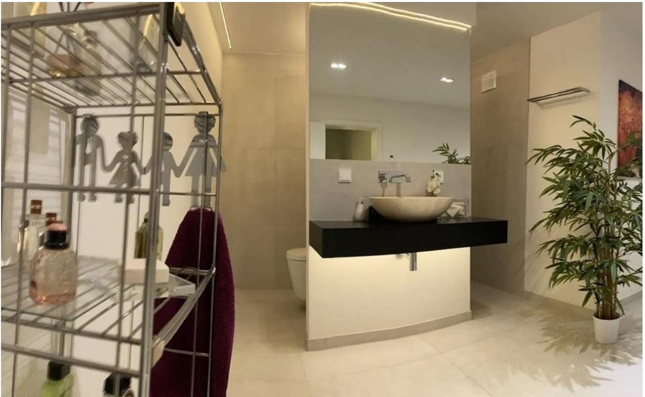
Wellnessbad mit Sauna