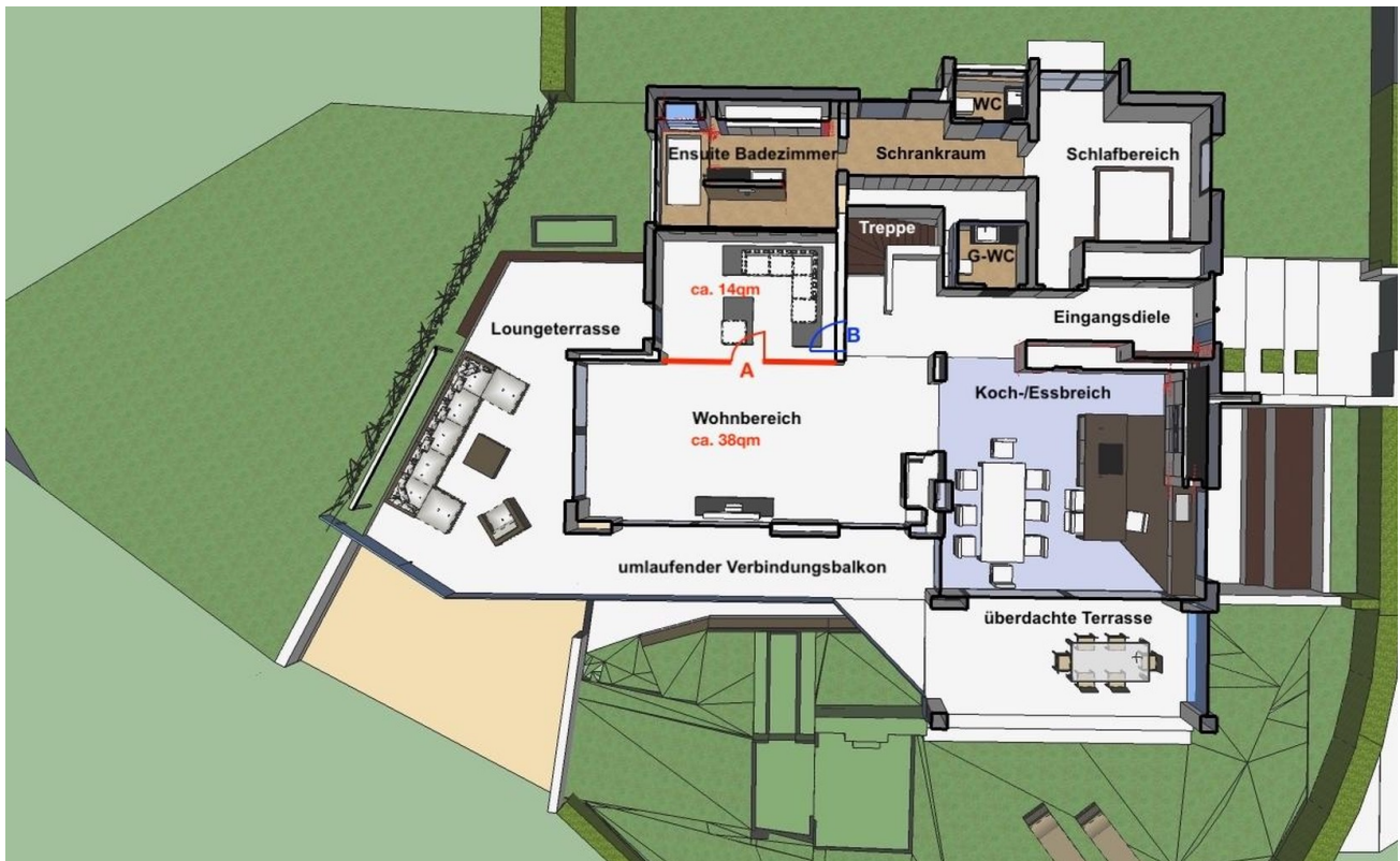
Erdgeschoß + 1 Zimmer möglich