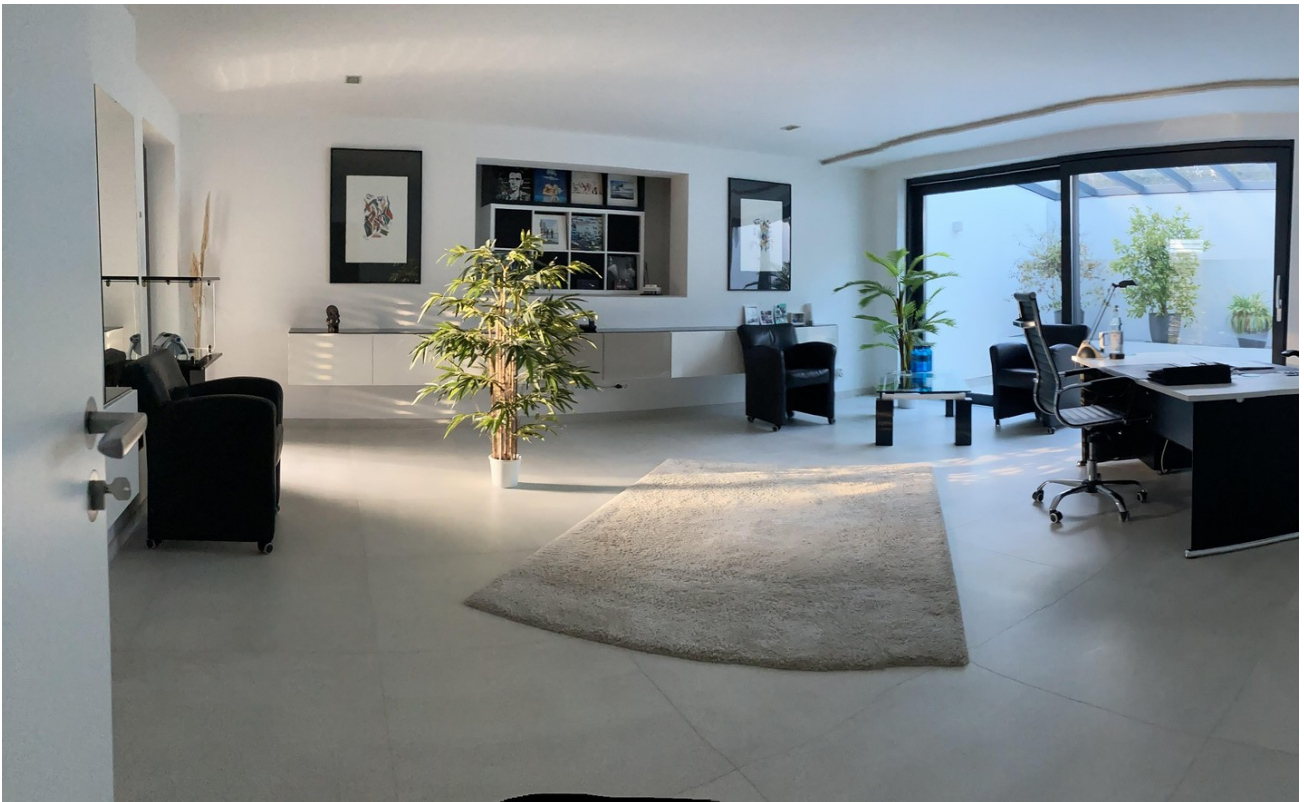
Arbeitszimmer mit Lichthof