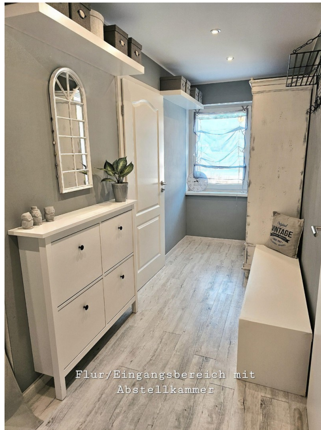
Flur/Eingangsbereich mit Abstellkammer