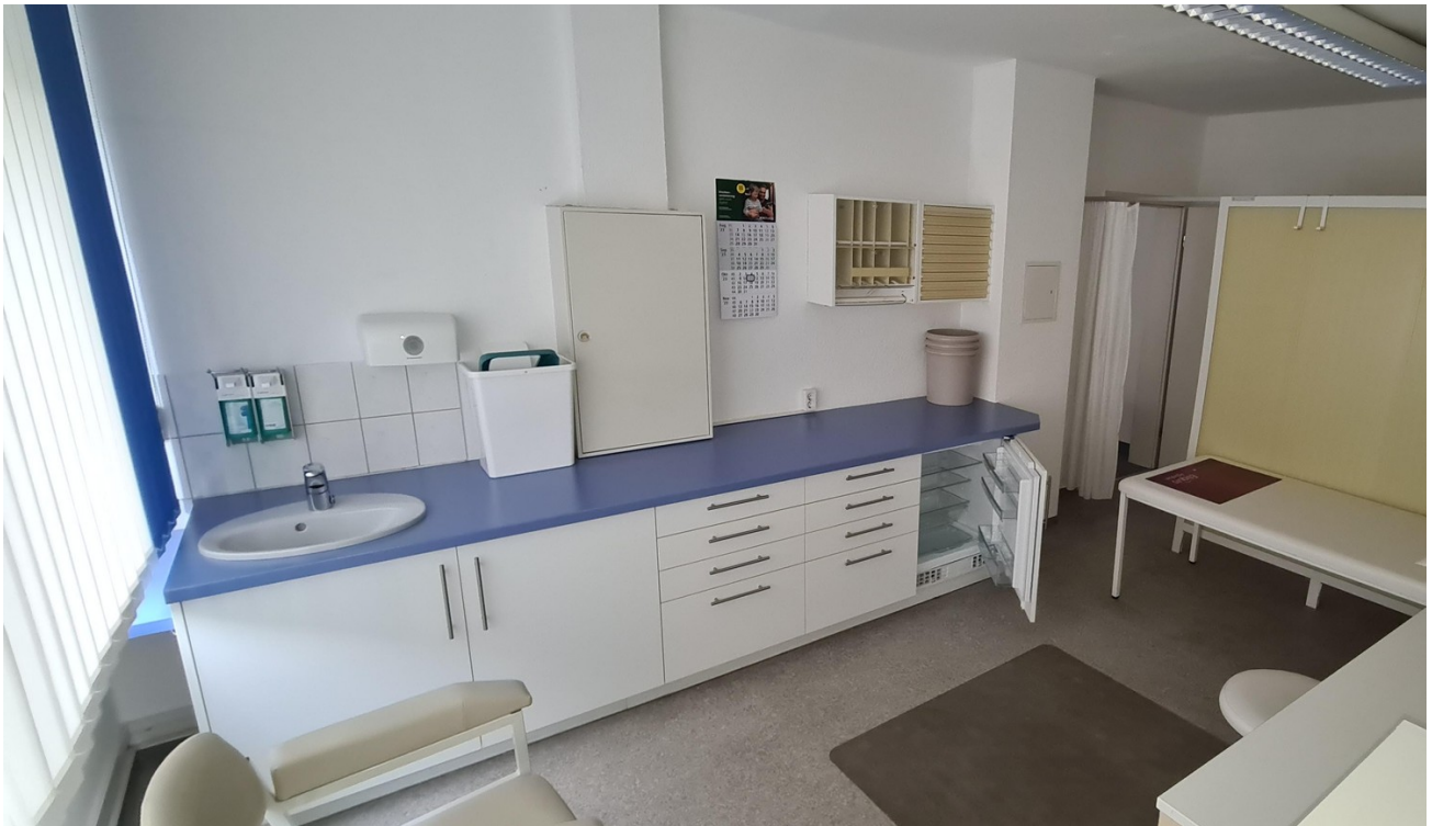
Labor + Behandlungsraum