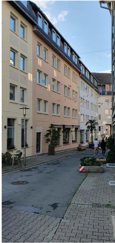
Nachbarschaft Steinweg 3+5