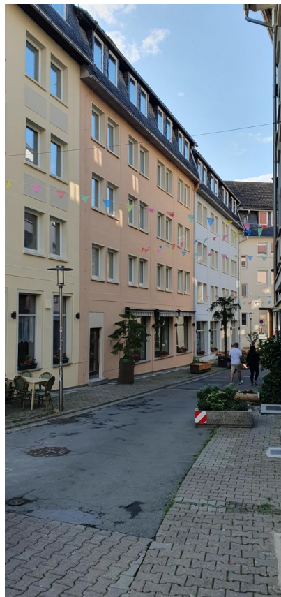
Nachbarschaft Steinweg 3+5