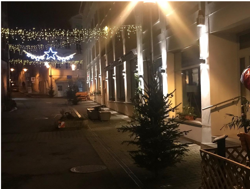
Steinweg an Weihnachten