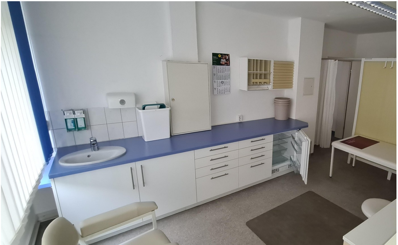
Labor + Behandlungsraum