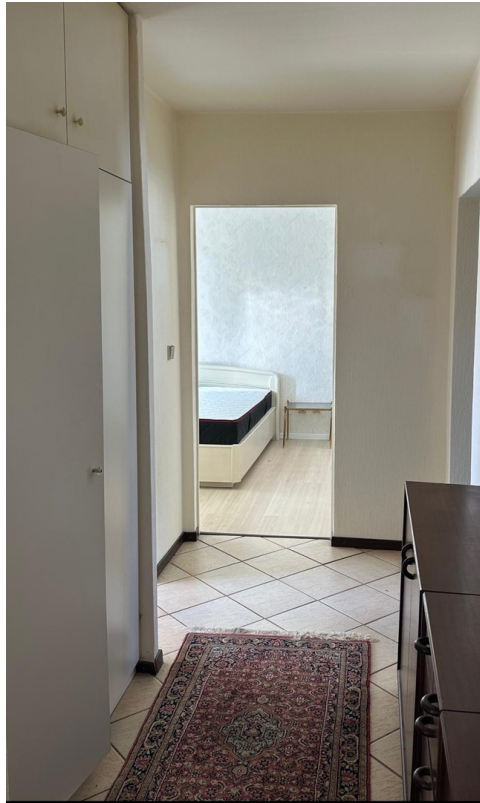
Flur und Schlafzimmer