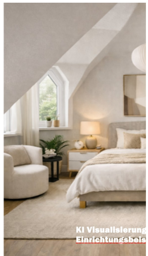
Schlafzimmer unter dem Dach