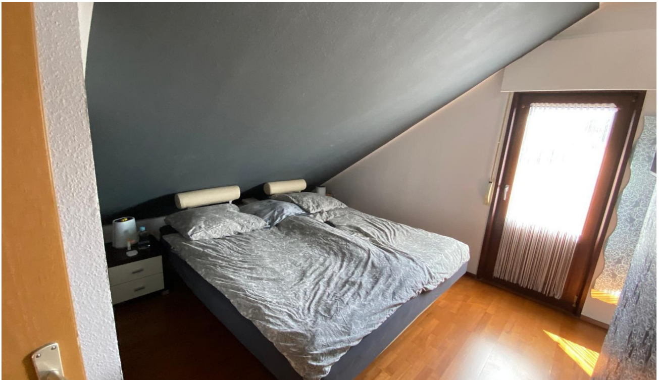
Linke Seite Schlafzimmer