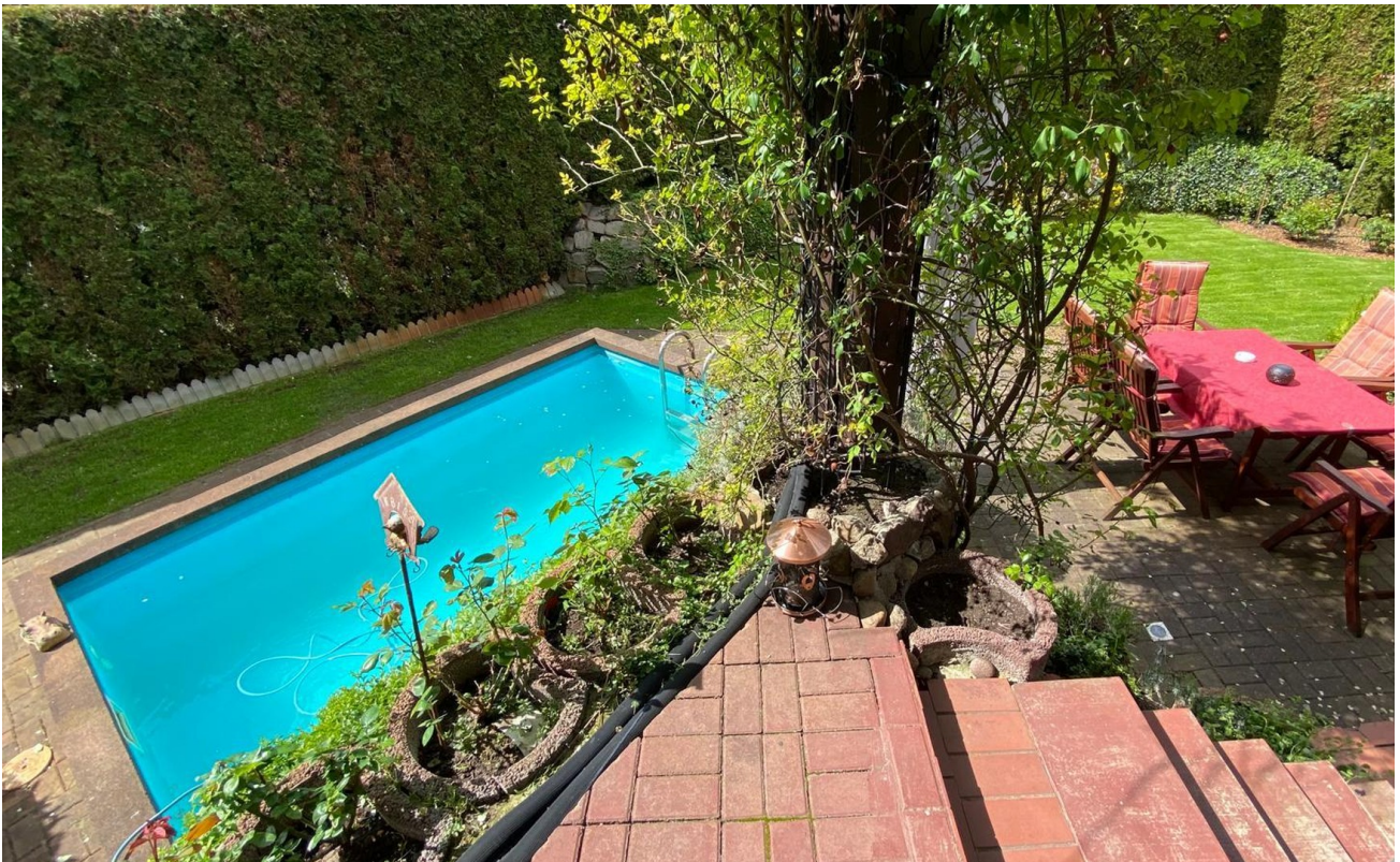
Blick Terrassentür in denGarten