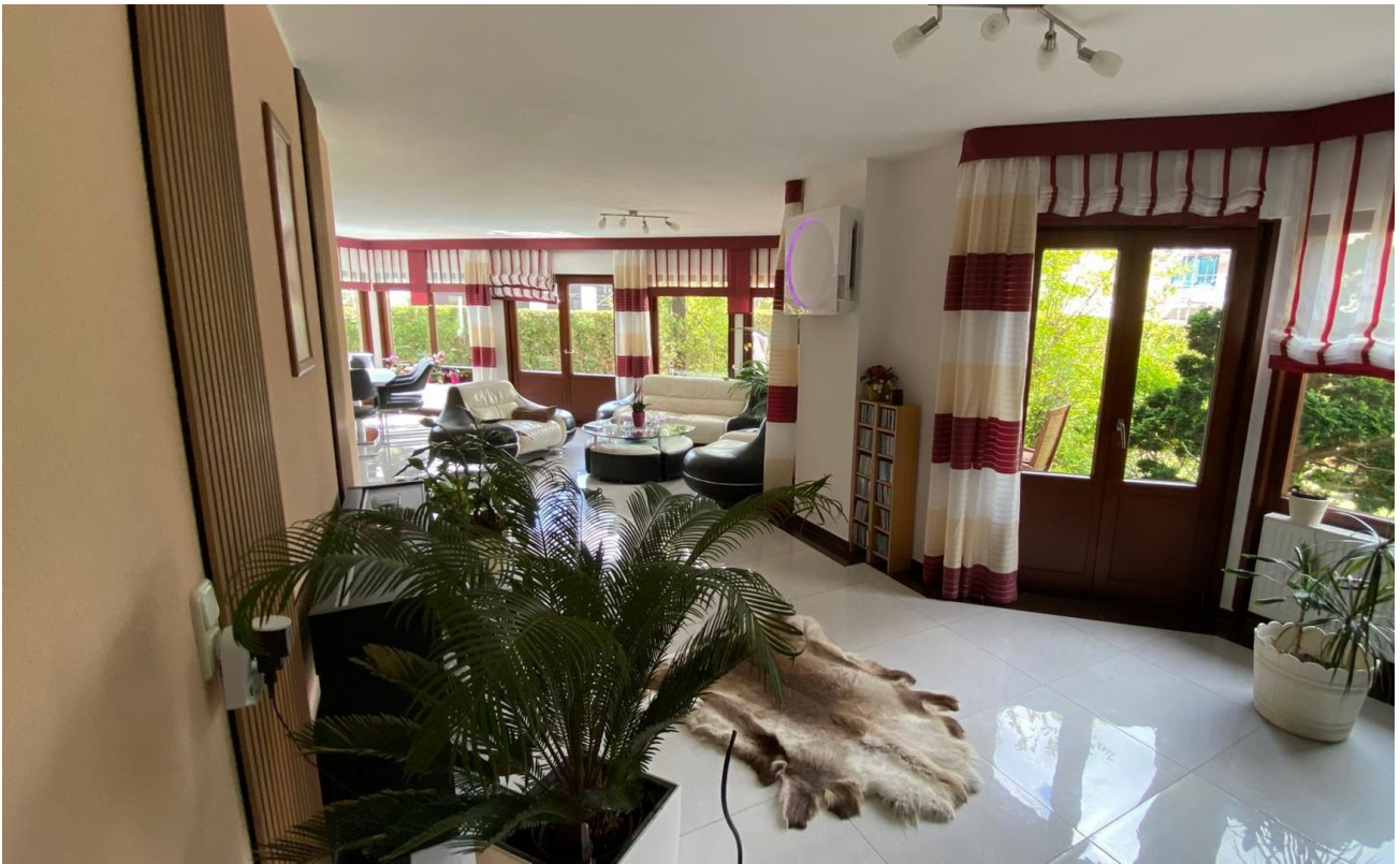
Blick ins Wohnzimmer