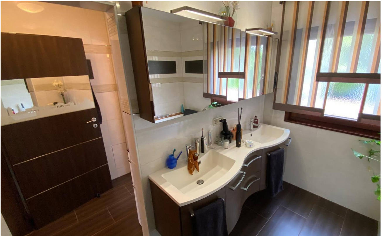
Badezimmer EG Waschbecken