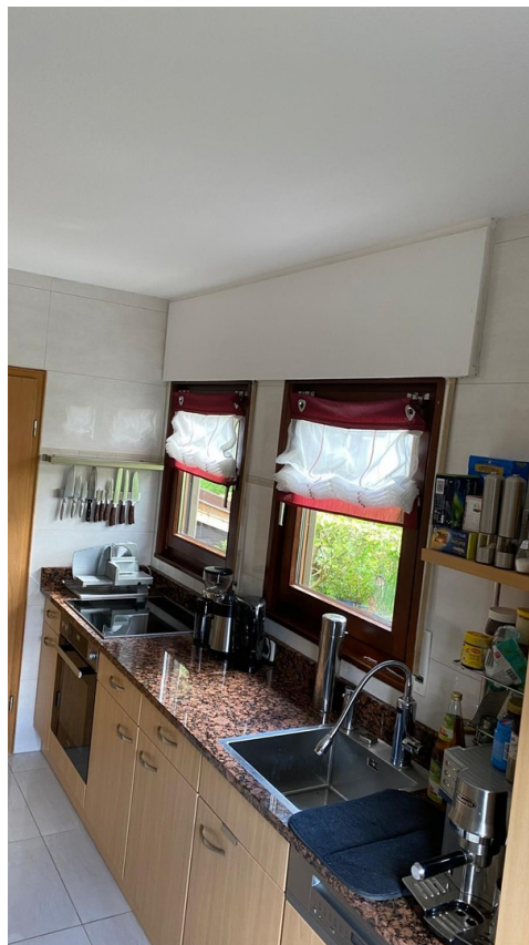
Teil der Küche