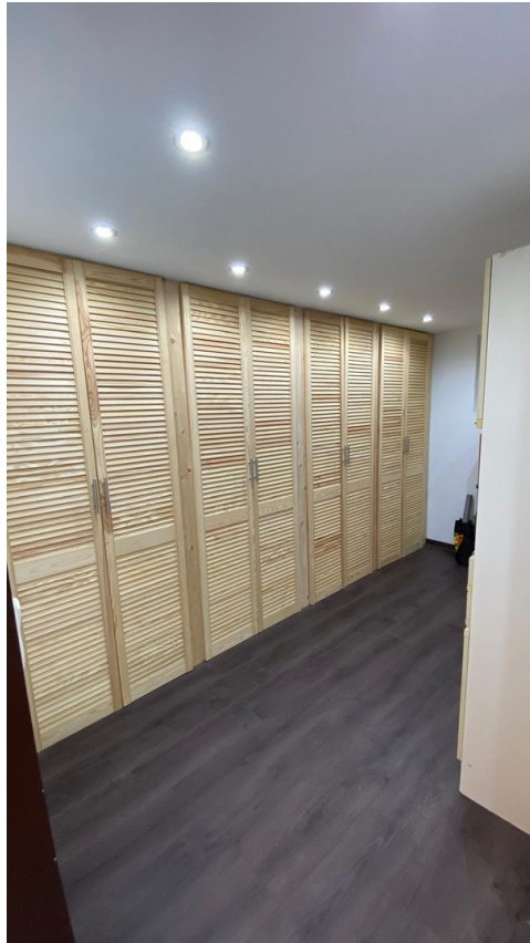
Schränke im Keller