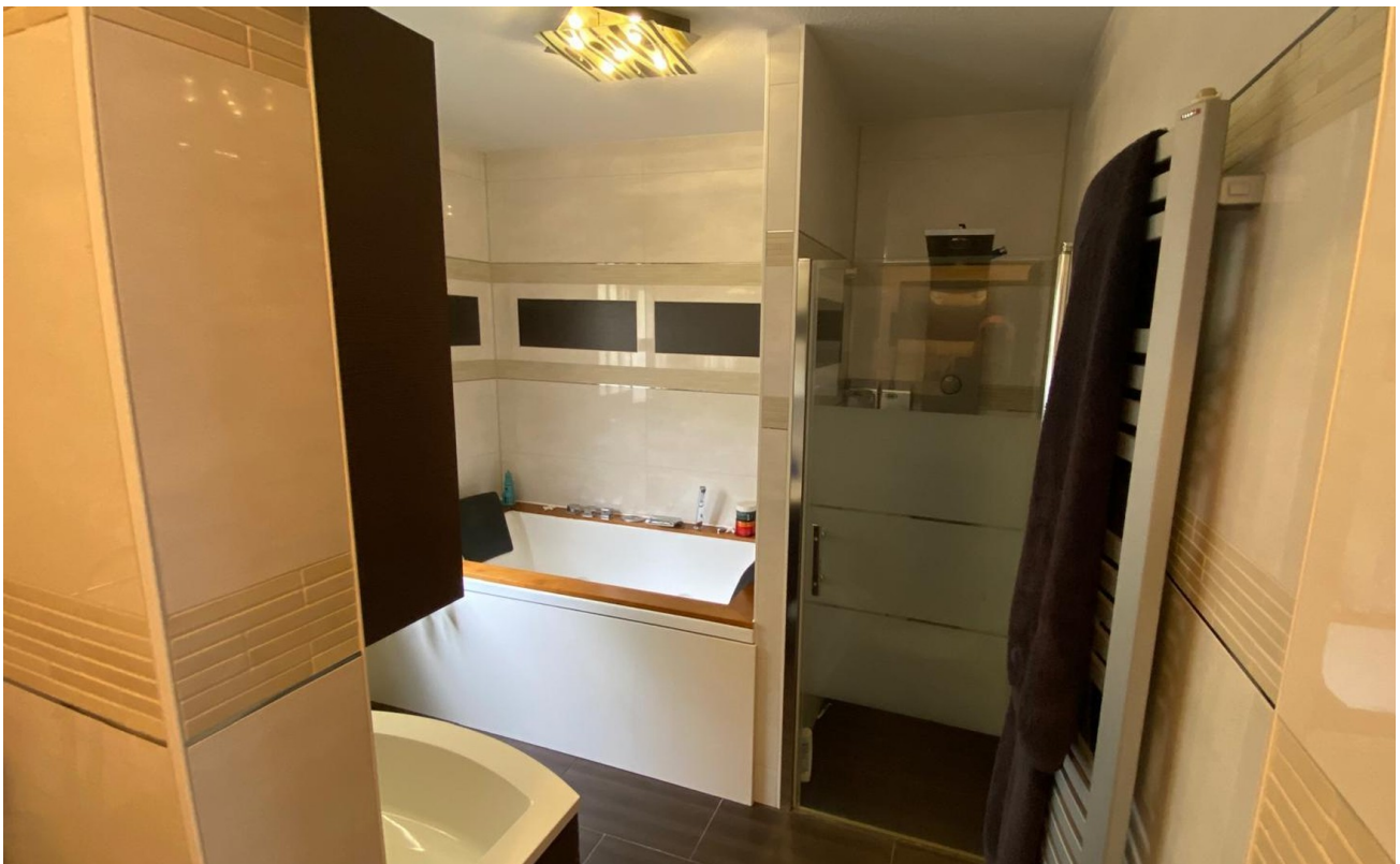
Badezimmer EG mit Dusche