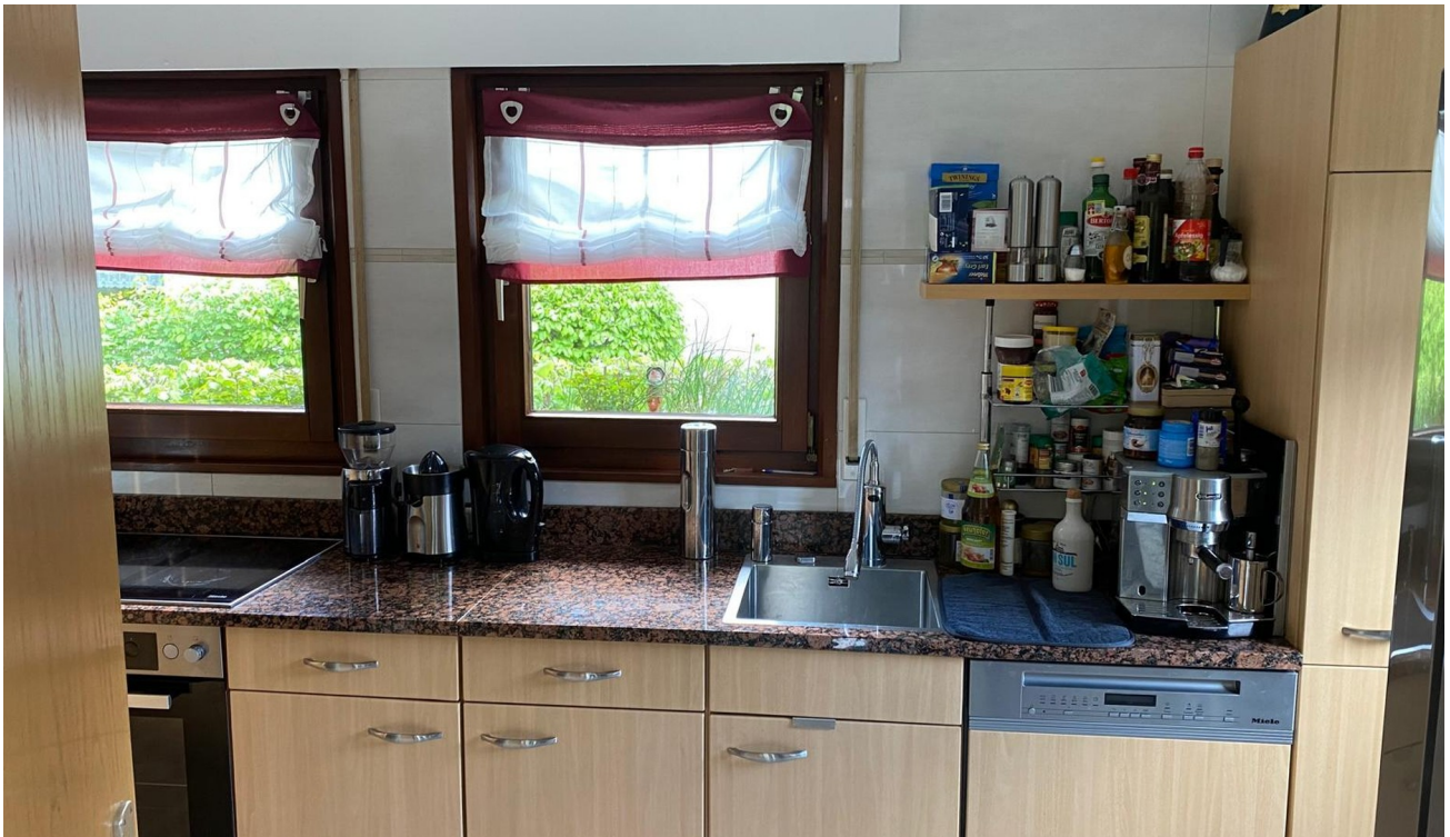
Teil der Küche