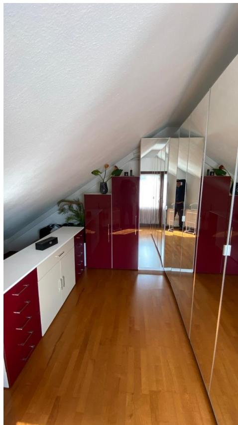
Rechte Seite Schlafzimmer