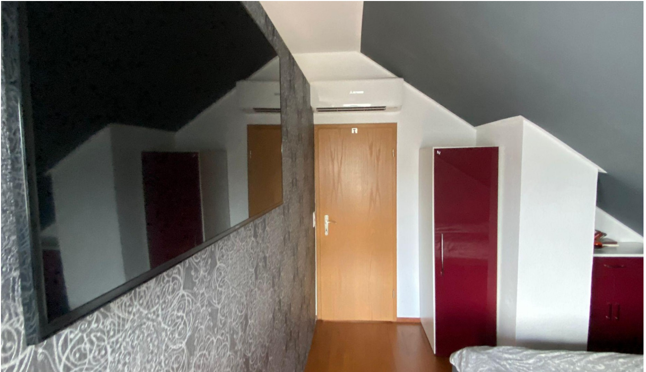
Trennwand begehrer SchrankT