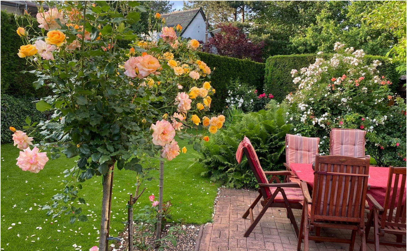
Garten mit Terrasse