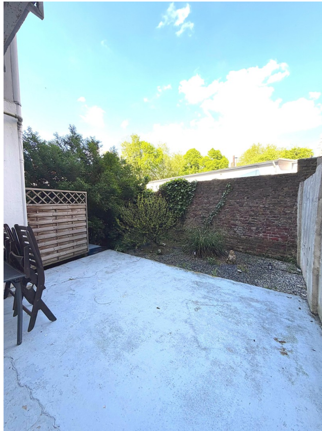
Terrasse mit privatem Garten