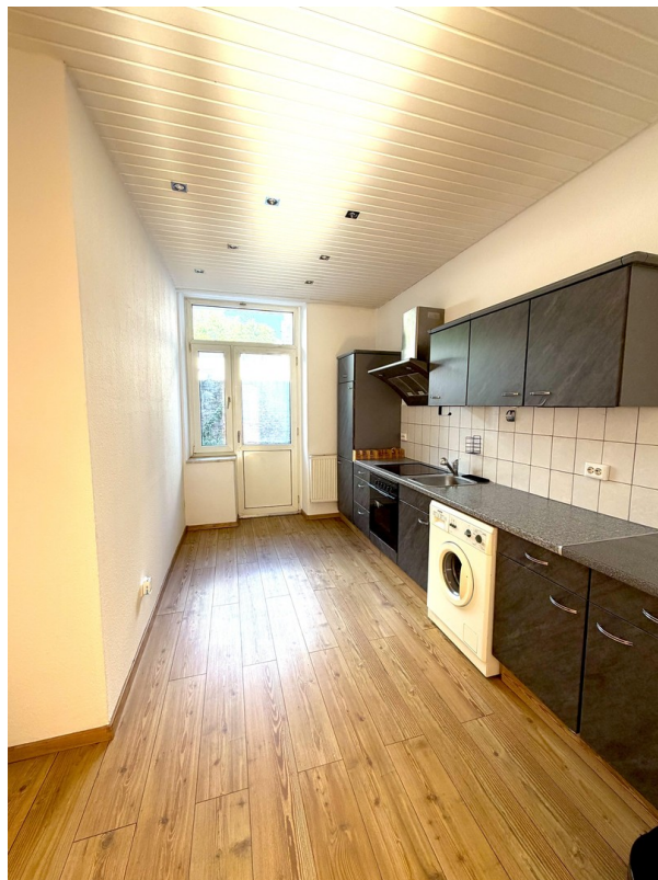
Küche mit Zugang Terrasse