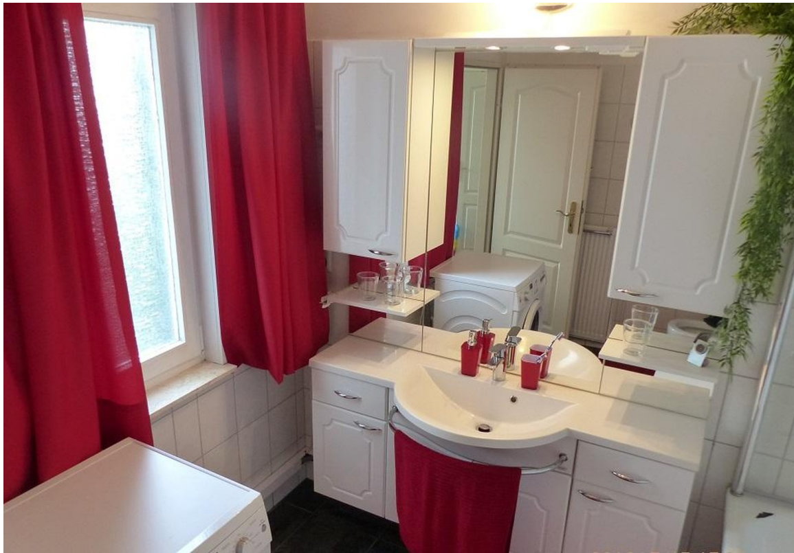
Bad mit Fenster +WaMa