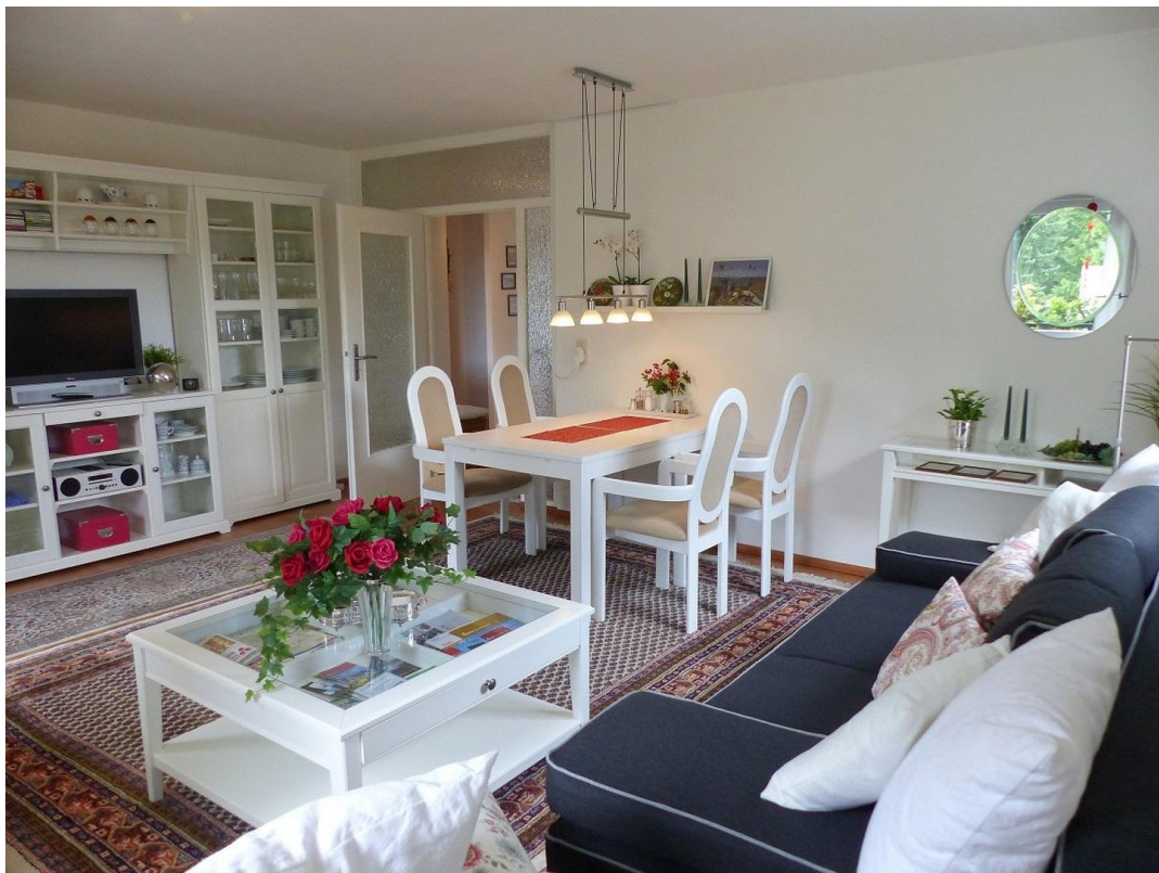
WZ- mit Esstisch