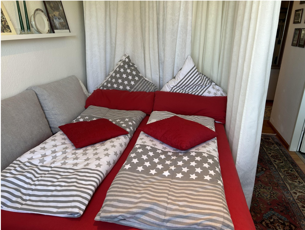
Leserraum mit DoBett-Couch