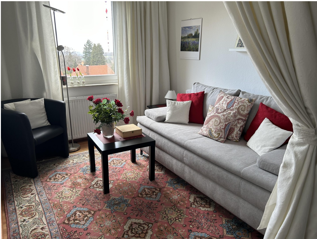
Leseraum mit DoBett-Couch