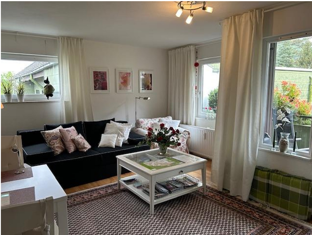
WZ- Blick zum Balkon