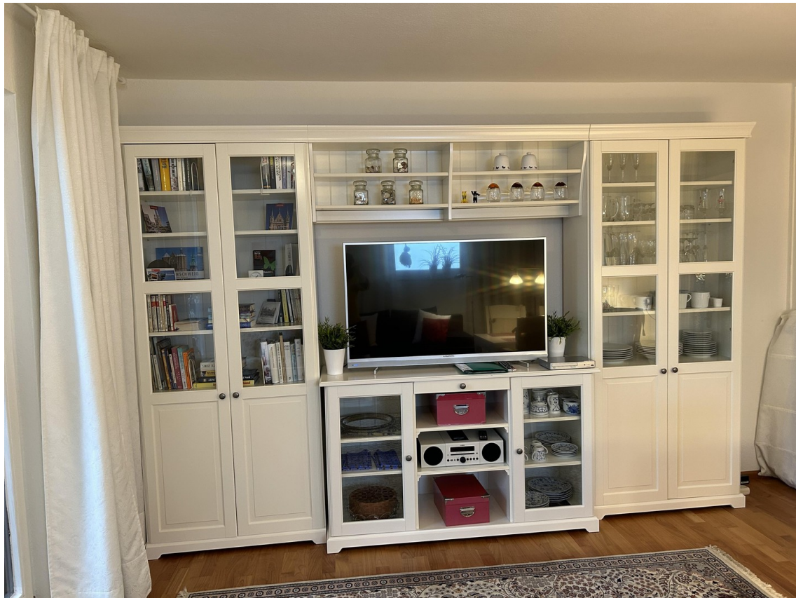
WZ...Schrankwand mit TV