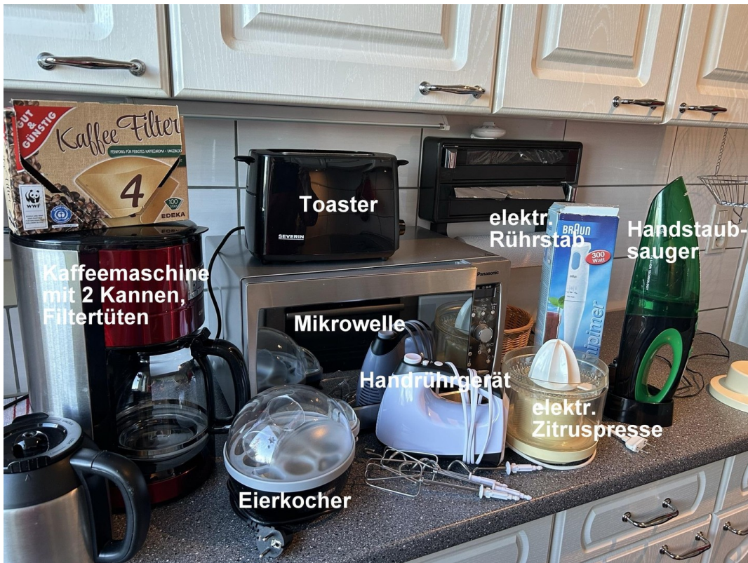
Küche- sehr gut ausgestattet