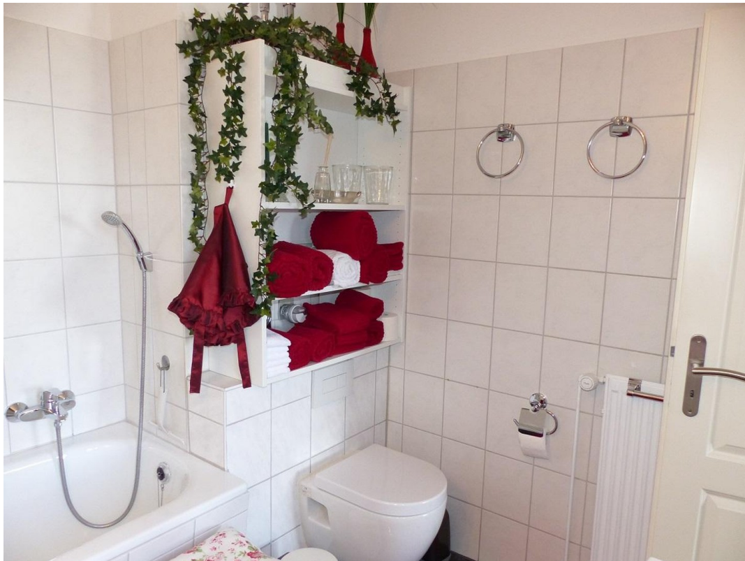
Bad mit Wanne +WC