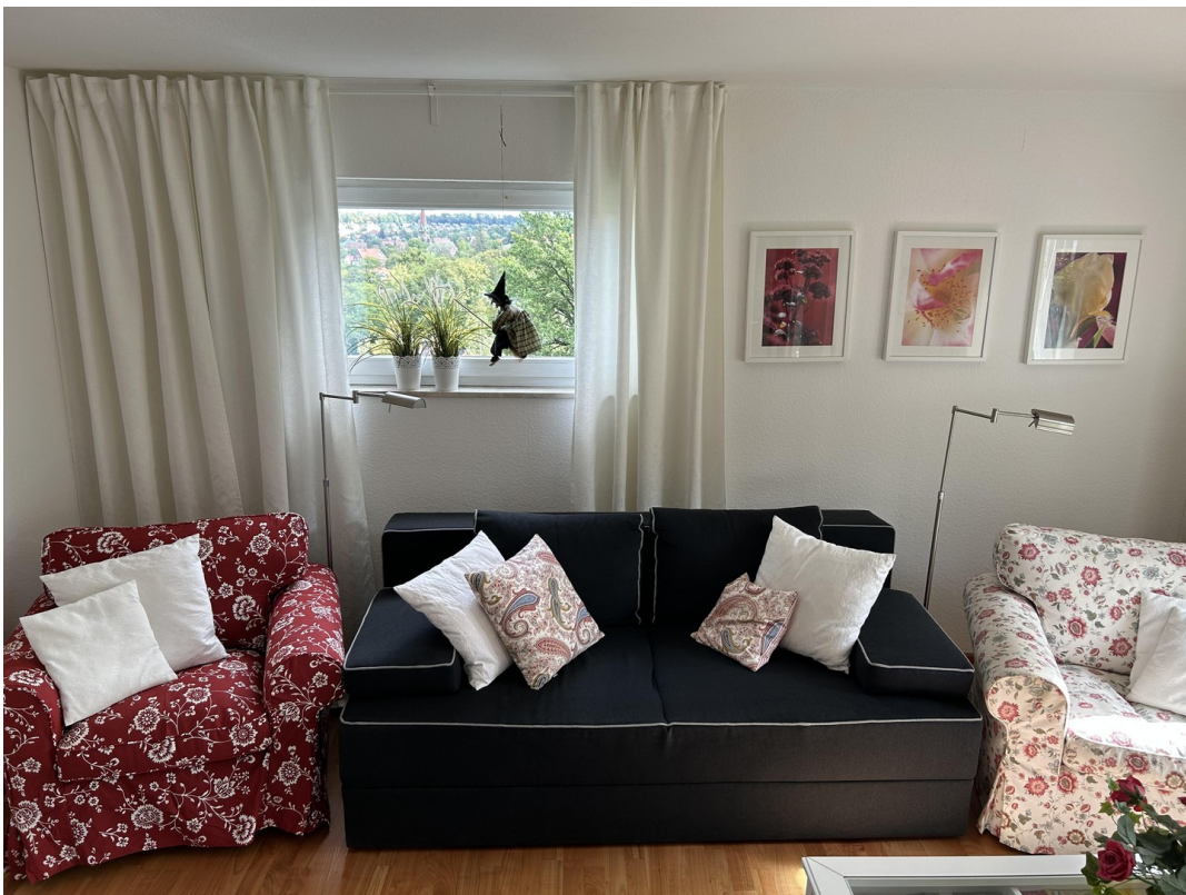
WZ- Schlafcouch + 2 Sessel