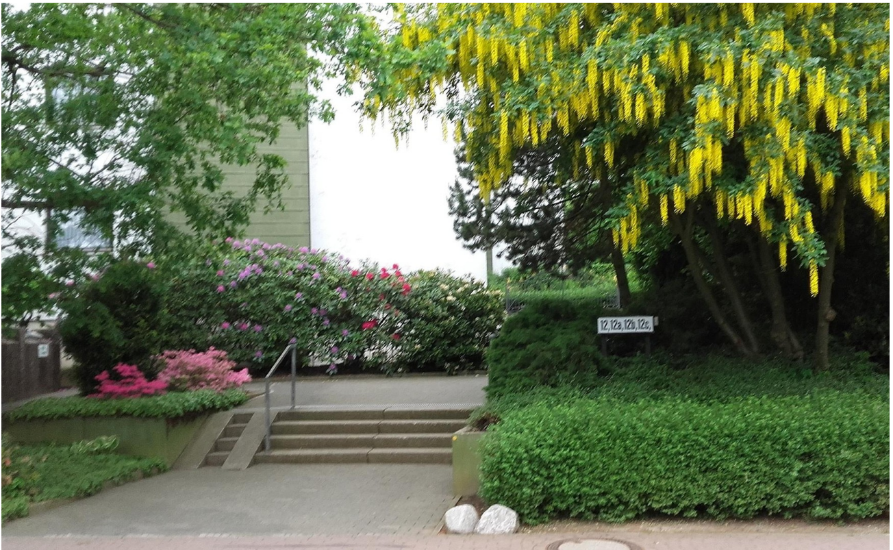
Aufgang zur Wohnanlage