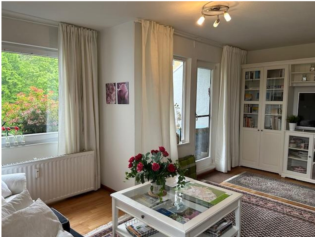
WZ- mit Ausgang zum Süd-Balkon