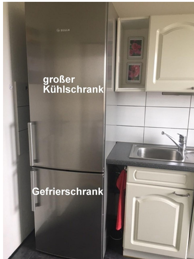
EBK mit Kühl-Gefrierschrank