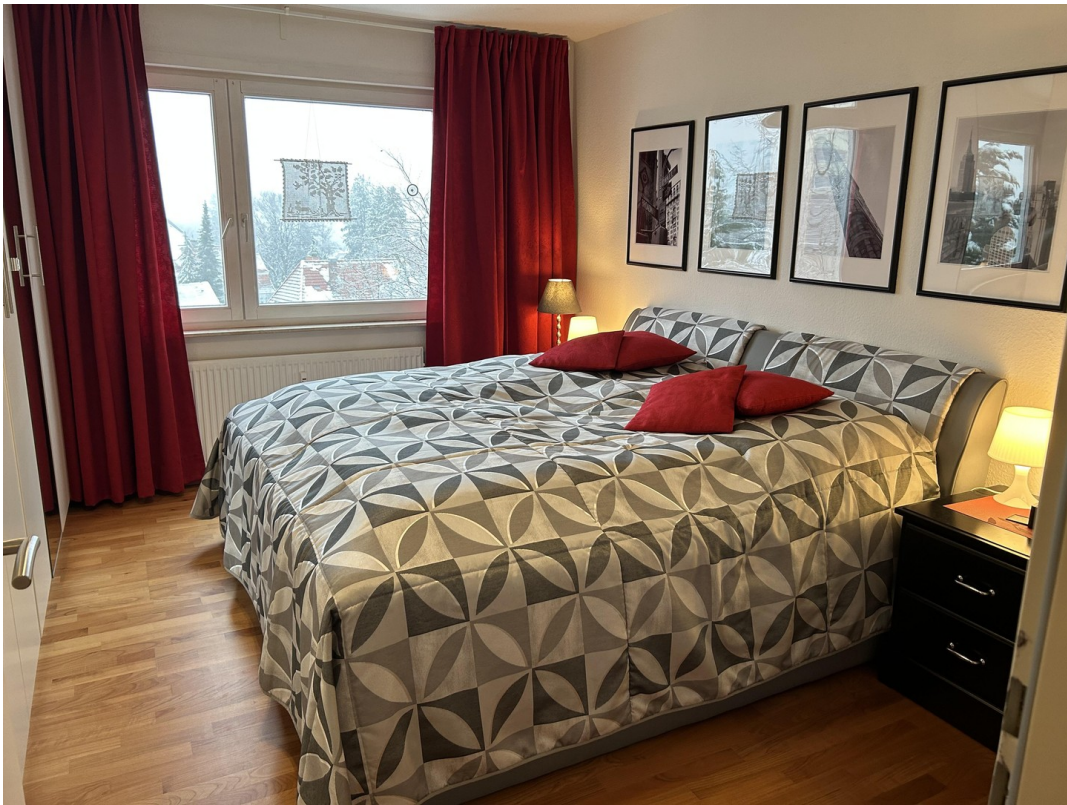
SZ zur Nordseite