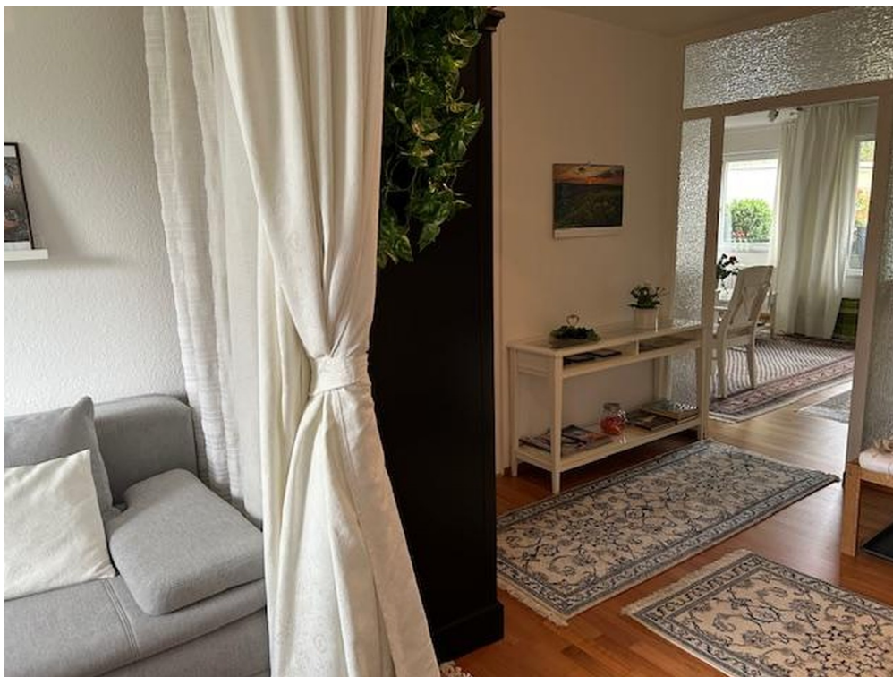
Flur-Abtrennung zum Leseraum