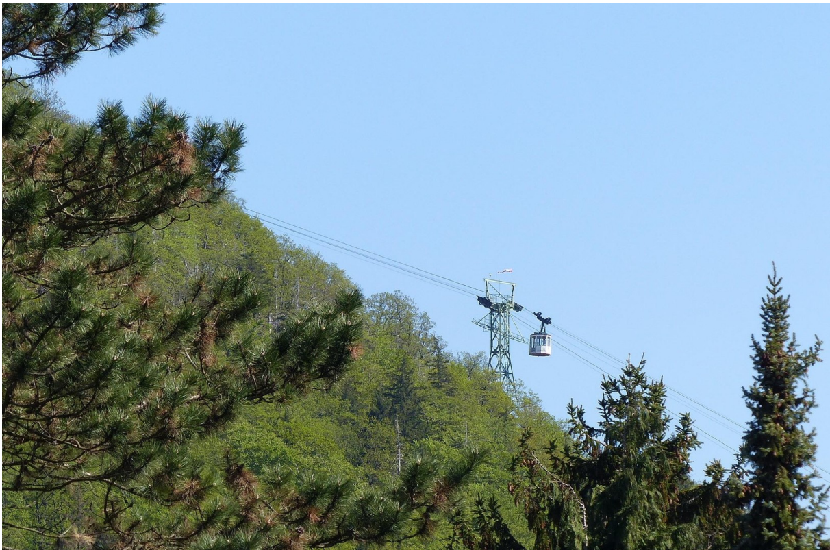
Blick v.Blk zur Gondelbahn