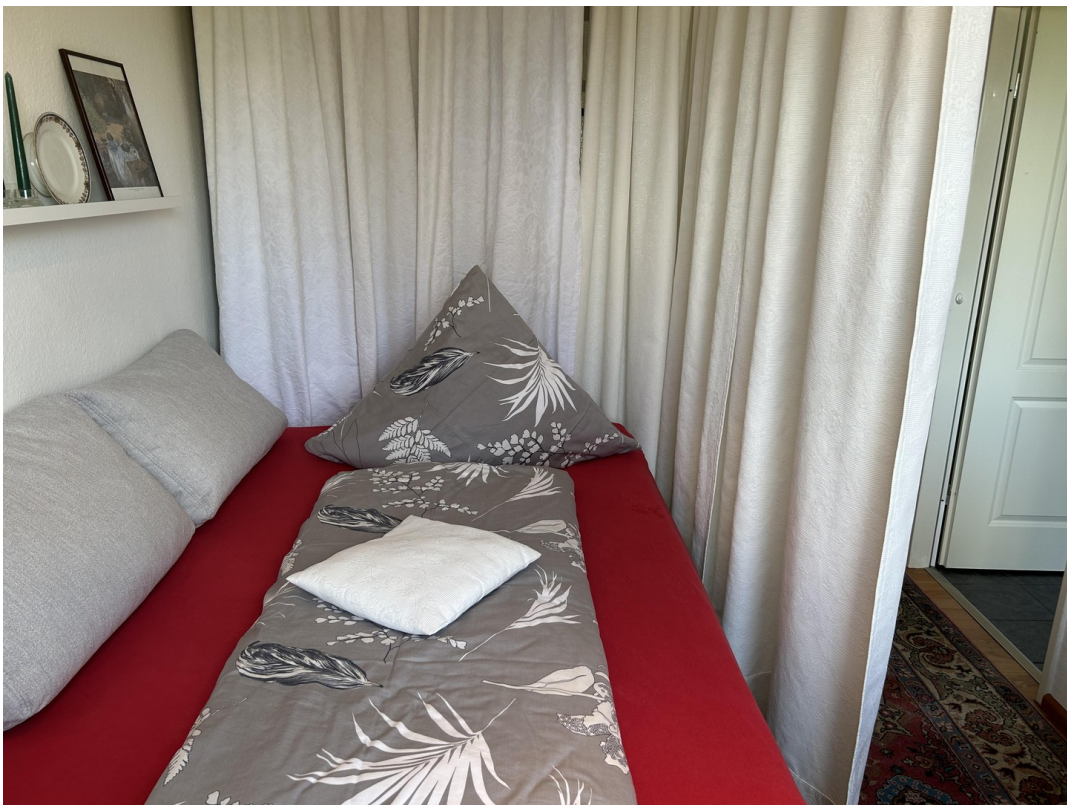
Leseraum mit DoBett-Couch