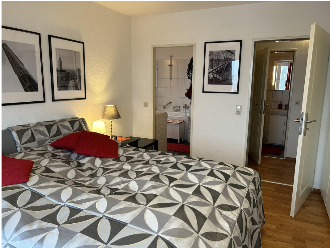
SZ mit Blick zum Bad+Dusche