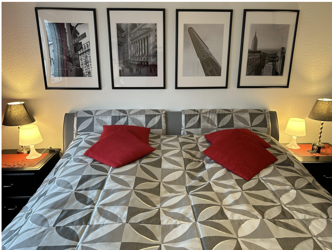
SZ 2 Betten Boxspringhöhe