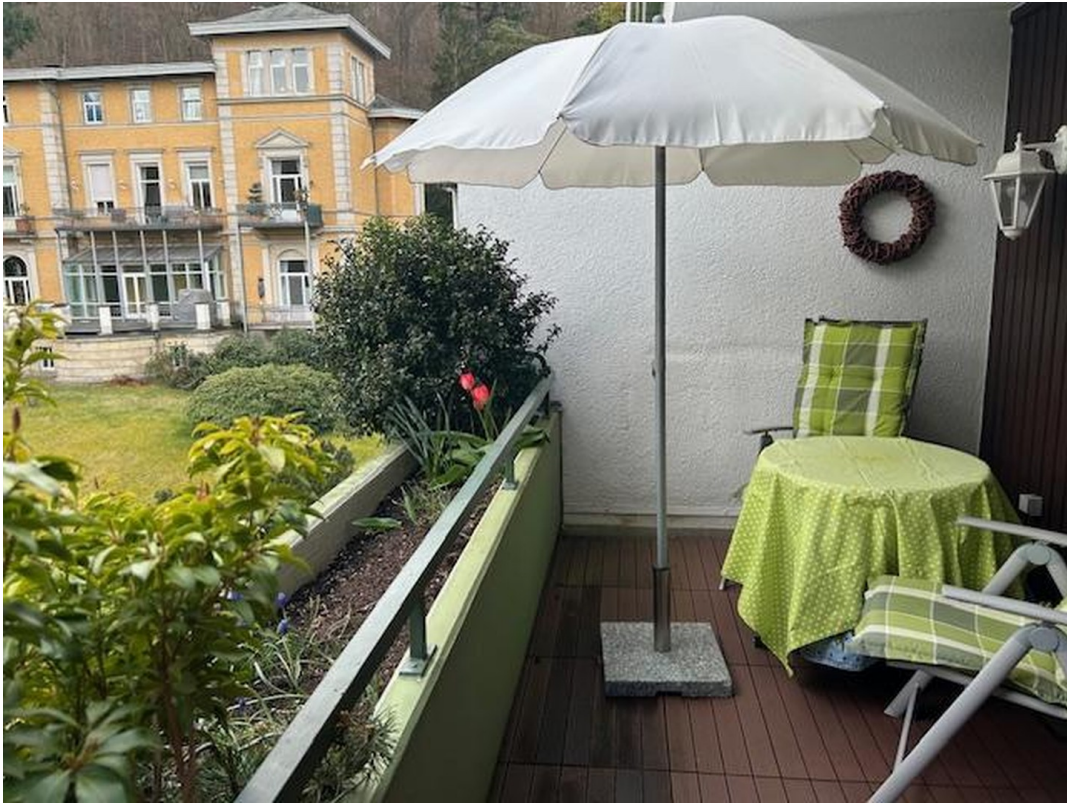
Süd-Balkon mit Möblierung