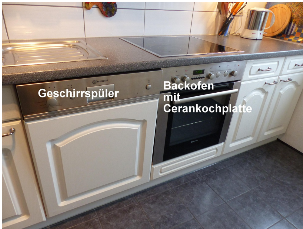
EBK - Backofen, Geschirrspüler