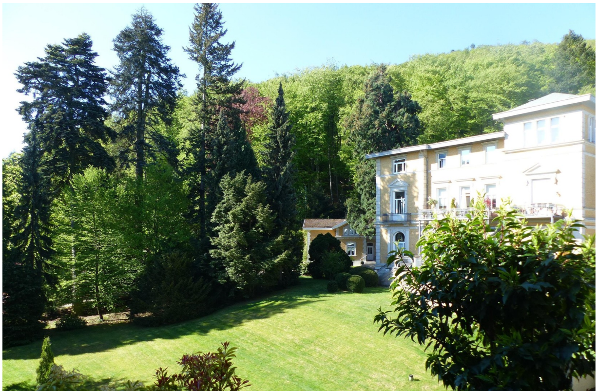
Blick in die Parkanlage der WE