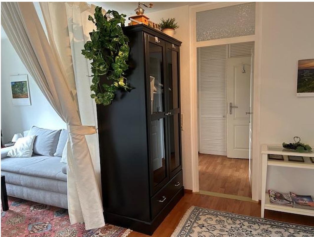
Flur +Blick in den Leseraum