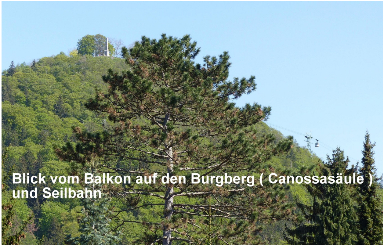
Blick vom Balkon auf den Burgberg ( Canossasäule ) und Seilbahn