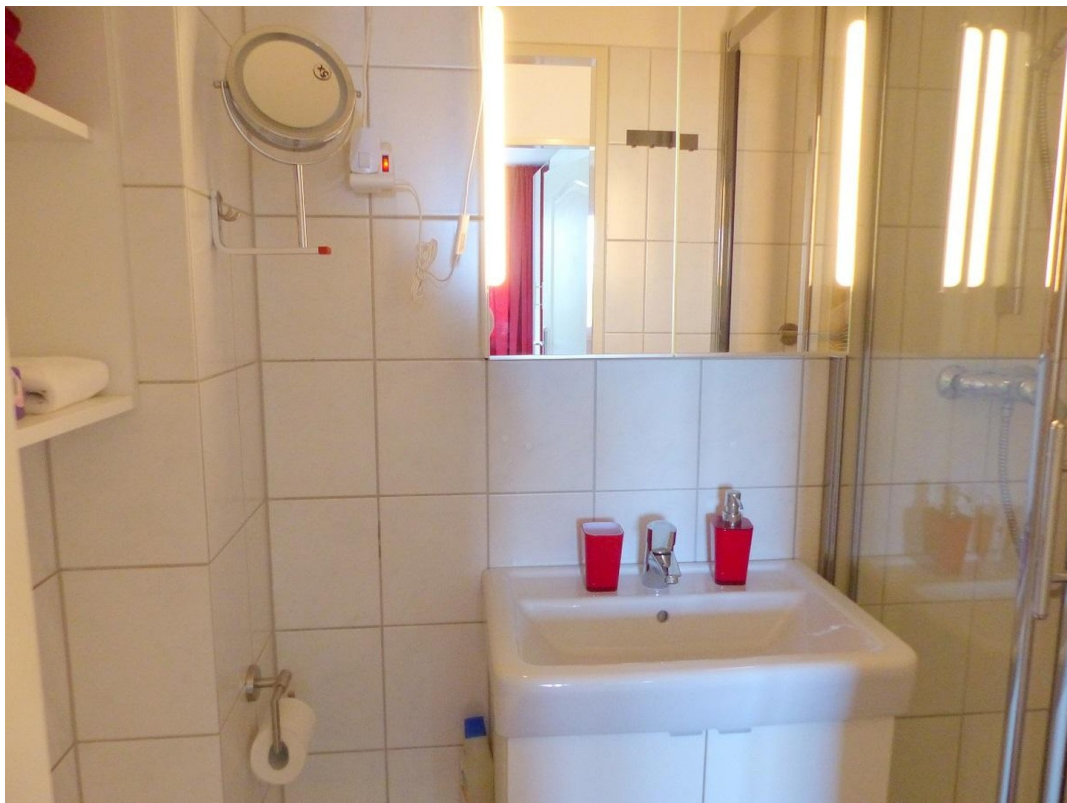
Duschbad mit WC