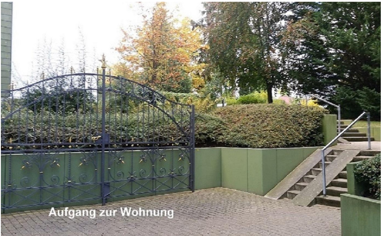
Aufgang zur Wohnung