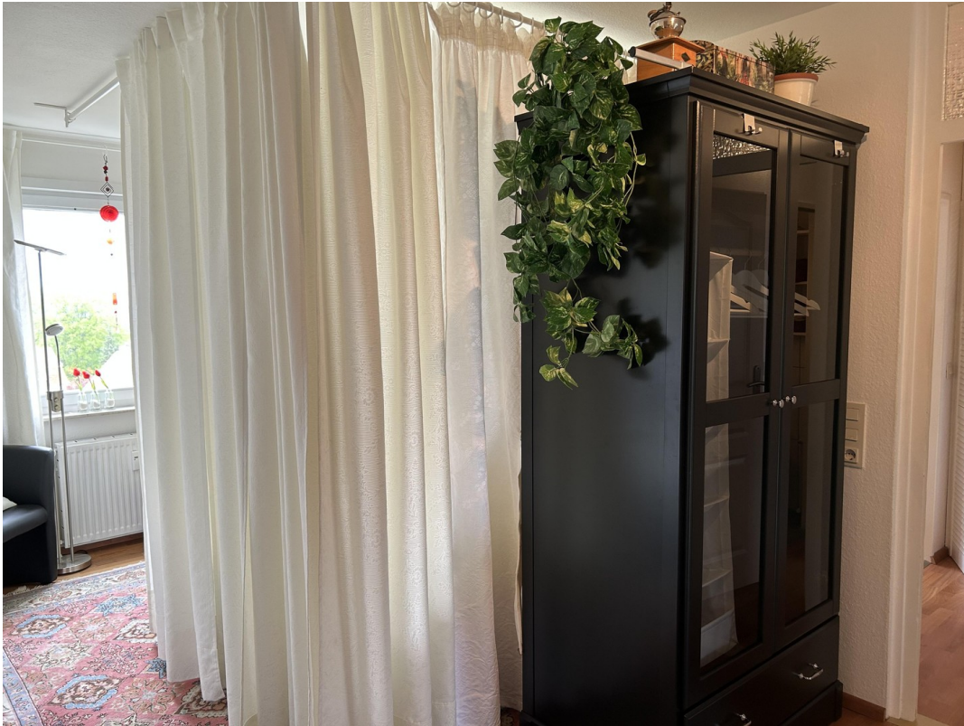
Flur mit Garderobenschrank