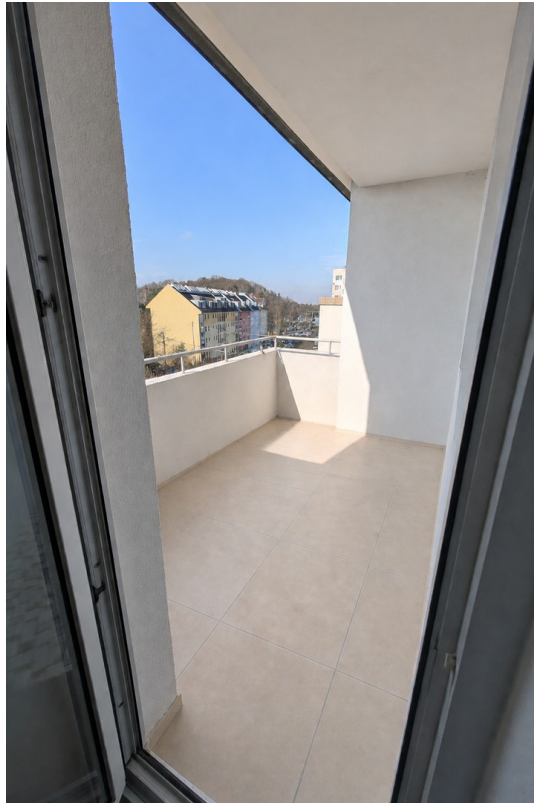
Balkon in den Westen