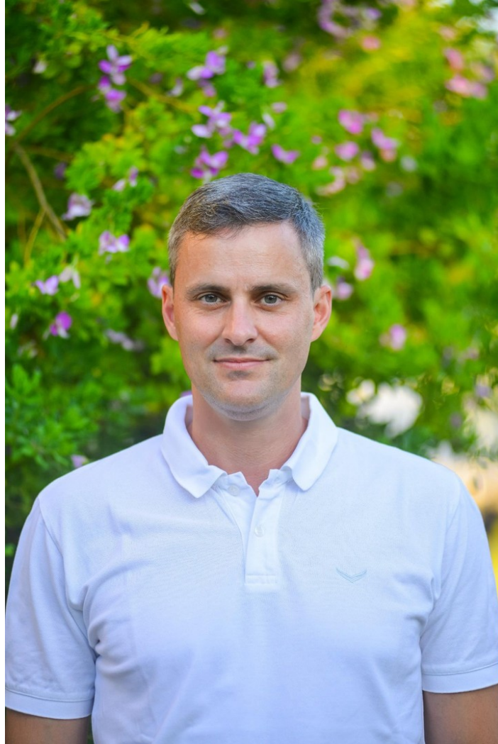
Ihr direkter Ansprechpartner