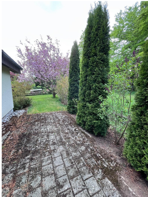
Terrasse mit Gartenanteil