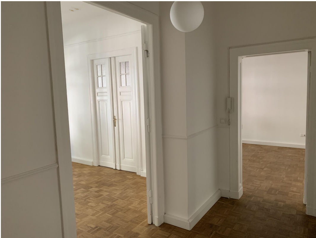
Blick Diele vom Eingang aus