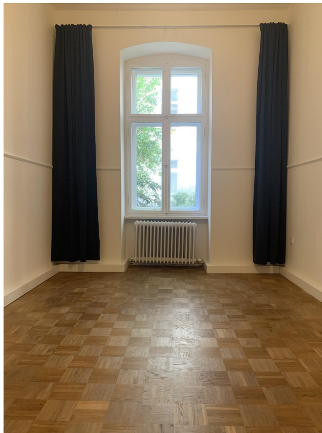
Zimmer zum Hof