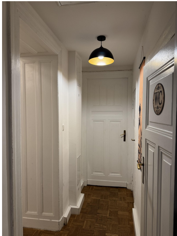
Kleiner Flur Blick aus Küche