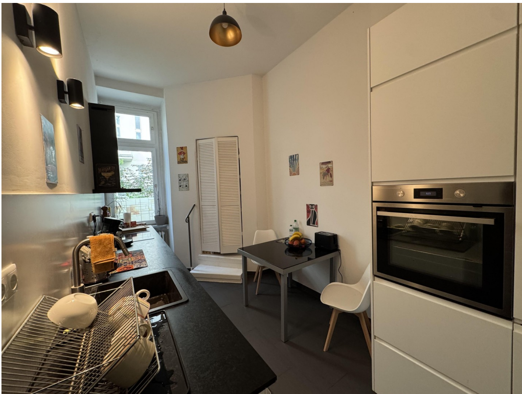
Küche mit Blick zum Hof