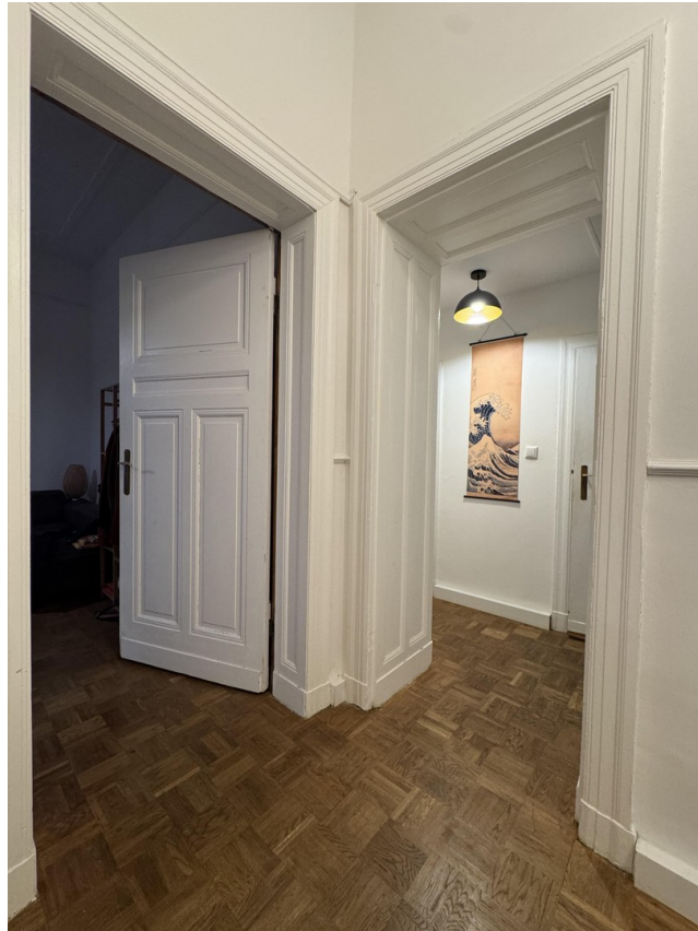
Blick Diele zum kleinen Flur