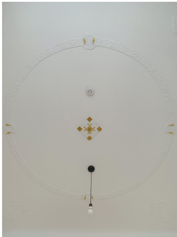
Stuck im Balkonzimmer