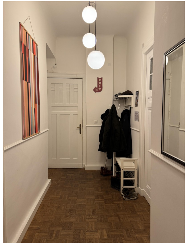
Diele mit Blick zu Ausgang