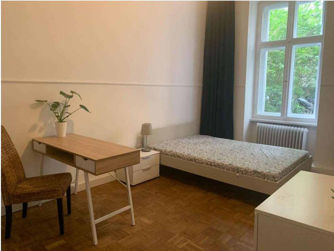
Zimmer zum Hof