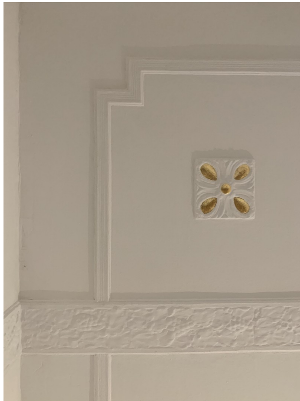
Stuck im Wohnzimmer