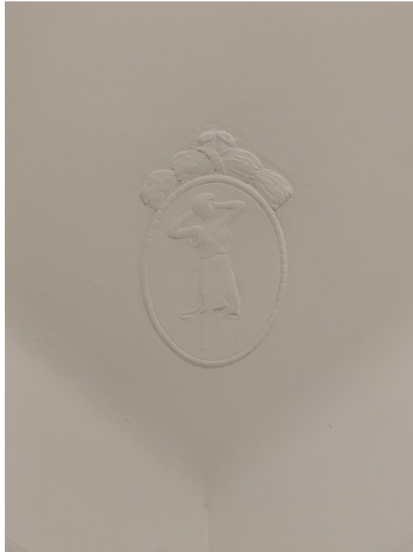
Stuck im Balkonzimmer