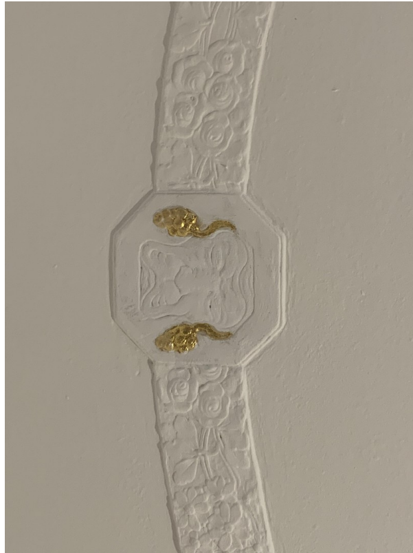
Stuck im Balkonzimmer