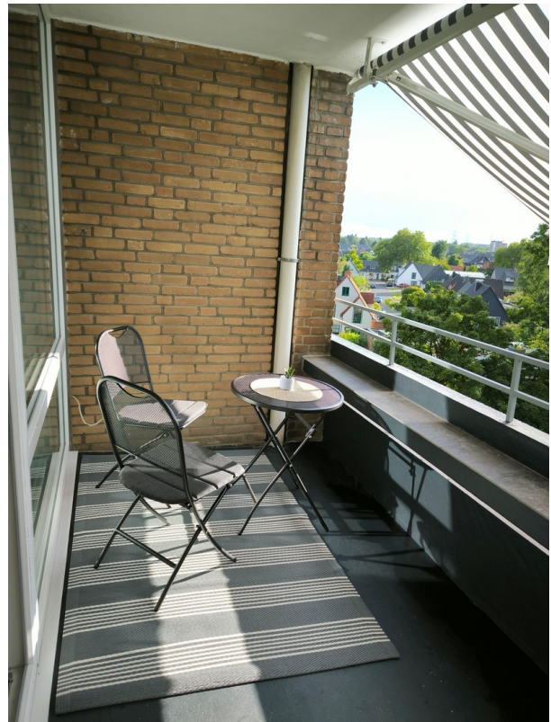
Balkon mit Markise