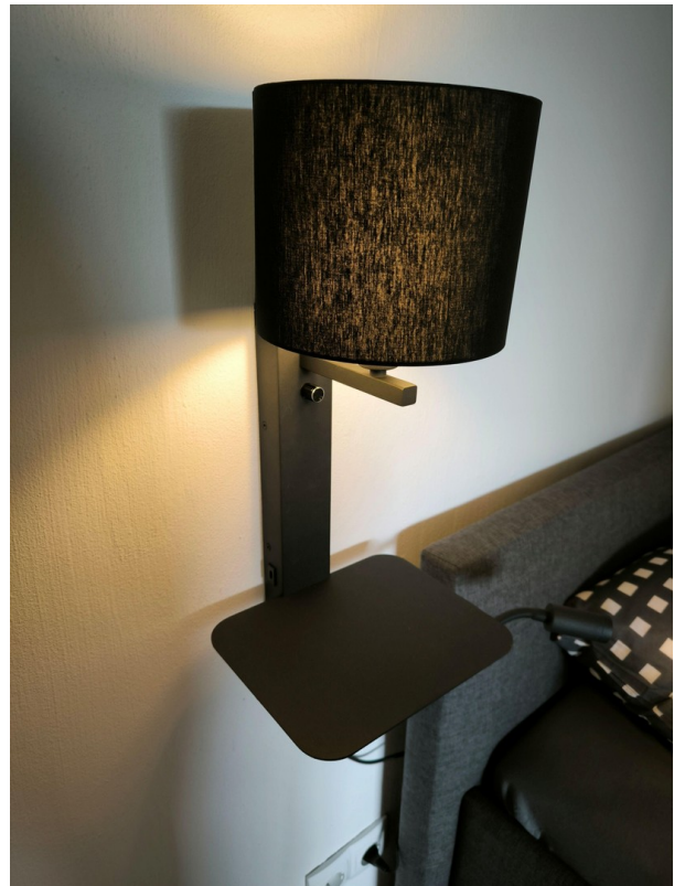
Bett - Detail