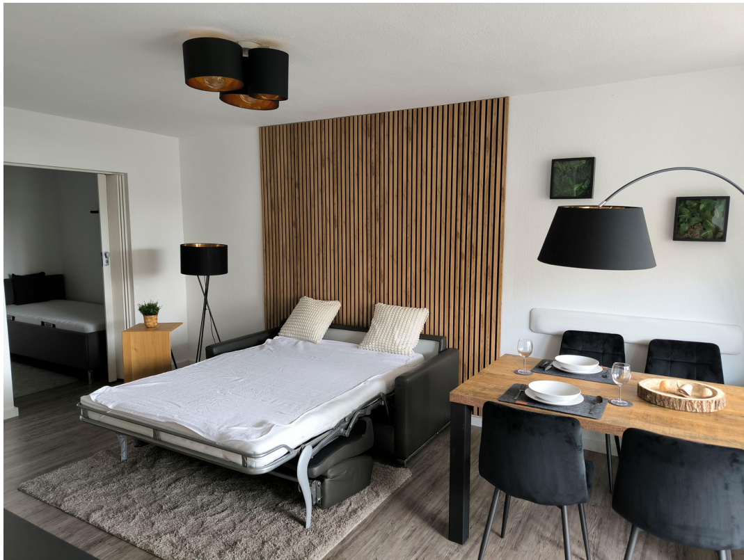
Gästebett - ausgeklappt