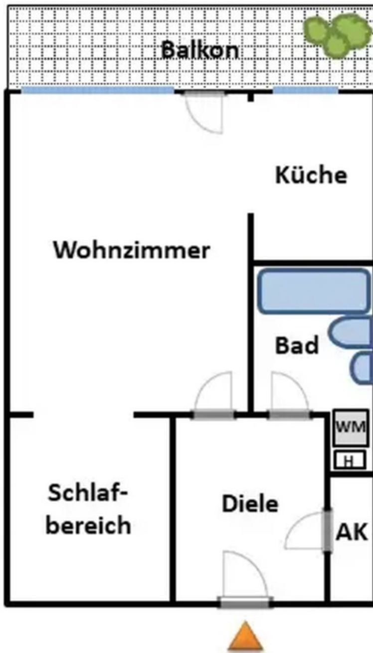
Grundriss - unbemaßt