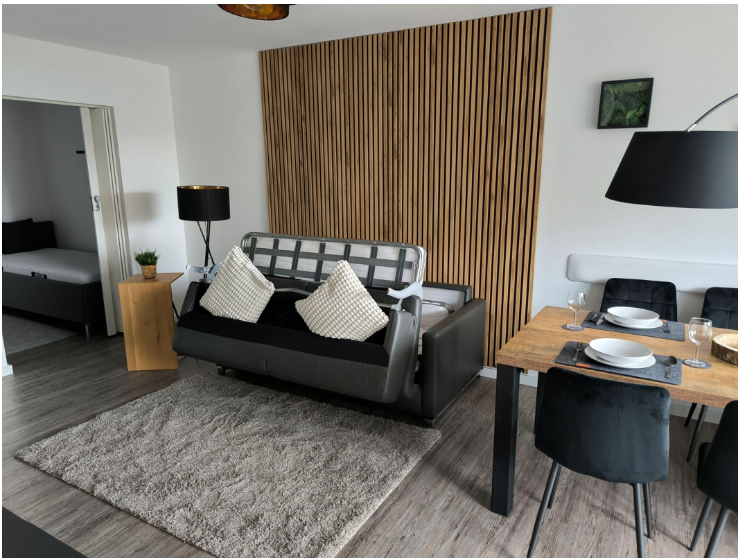
Gästebett - Klappmechanismus