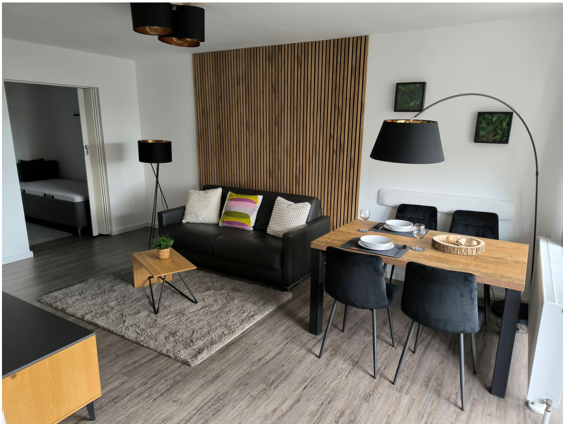
Blick a.d. Küche ins Apartment