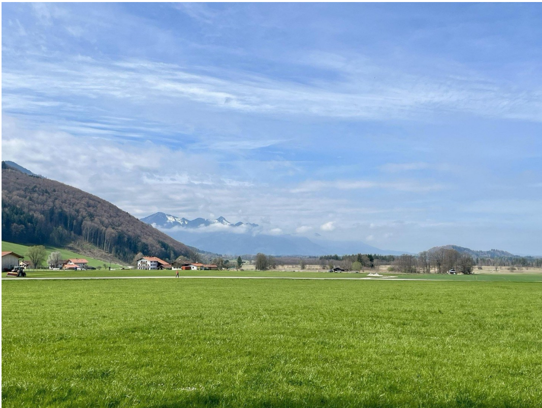
Bild vom Balkon