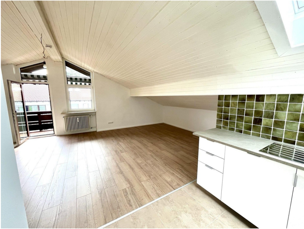
offener Wohn- und Eßbereich